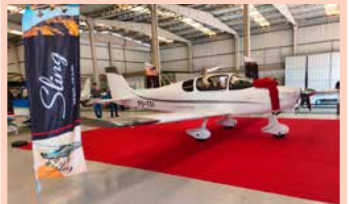
Pela primeira vez, uma aeronave para até quatro pessoas produzida no Espírito Santo foi entregue a um comprador.

A fabricante informa que o Sling TSi transporta até 450 kg de carga útil e consome cerca de 28 litros de combustível por hora, garantindo autonomia aproximada de oito horas de voo.