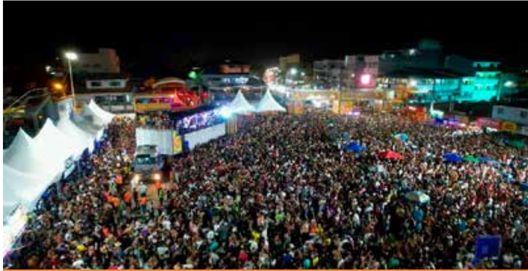
A folia tomou conta do Balneário de Guriri, em São Mateus, e também de Conceição da Barra. Com trios elétricos, blocos e uma mistura de ritmos, a programação segue até terça-feira (17) reunindo atrações locais, regionais e nacionais.

No domingo (15), as apresentações começam às 15h. O principal show será da