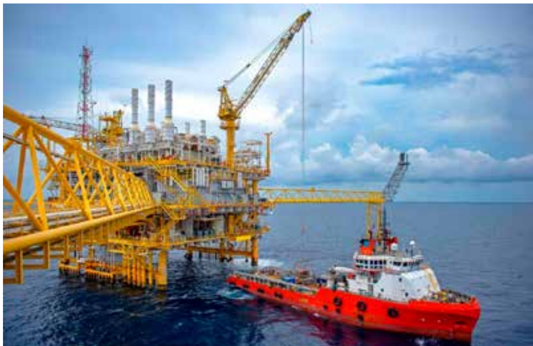
Estado capixaba ultrapassou São Paulo depois de seis anos.

Estratégicos de Petróleo, Gás Natural e Biocombustíveis Zé Eduardo Dutra (Ineep), centro de pesquisas ligado à Federação Única dos Petroleiros (FUP), contextualiza que a entrada em operação do navio-plataforma FPSO Maria Quitéria elevou a produção em Jubarte.