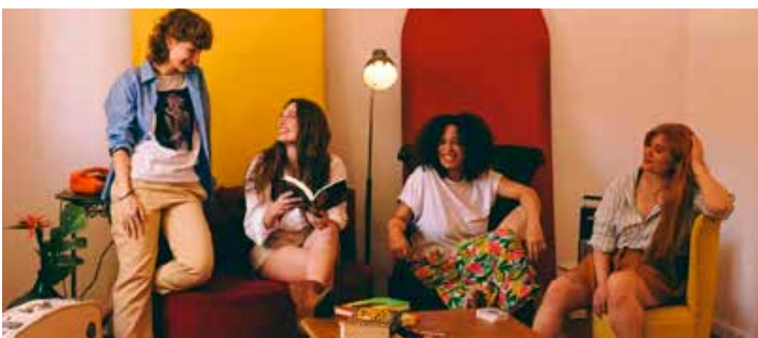
Para muitas mulheres, as noites entre amigas em casa são mais importantes do que nunca, e até melhores que uma balada.

As mulheres também consideram fundamental ter a opção de escolher se querem ou não beber em uma noite em casa com as amigas.