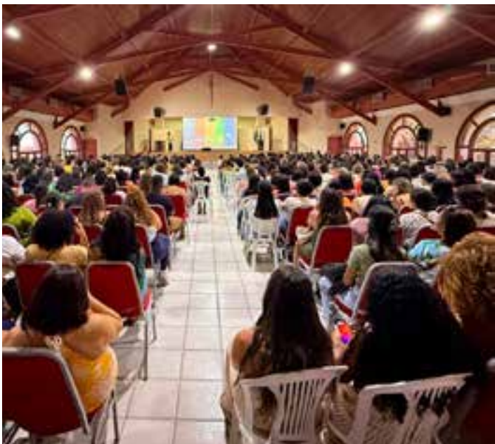
O evento reuniu mais de 1.300 profissionais da educação, entre professores e pedagogos da Educação Infantil e do Ensino Fundamental, entre vários outros.

Por se tratarem de decisões liminares e de primeira instância, ainda cabe recurso tanto por parte da Meta quanto dos administradores das páginas.