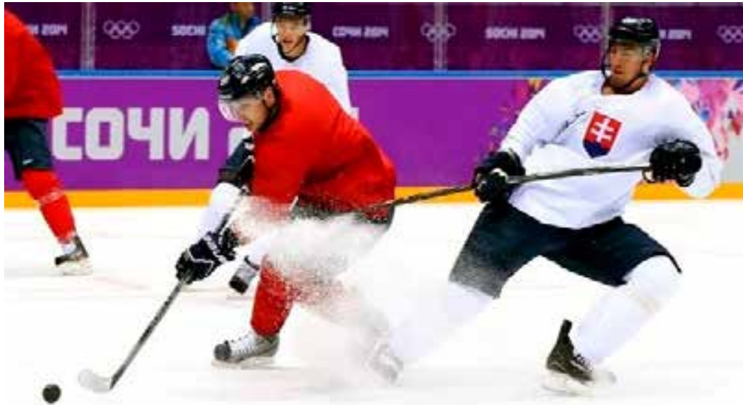
A Agência Mundial Antidoping está investigando possíveis aumentos de pênis que trariam vantagens na competição.

O ácido hialurônico, que não é proibido no esporte, pode ser usado para aumentar a circunferência do pênis em um ou dois centímetros. Isso aumentaria a área de superfície de seus trajes durante a competição, o que, segundo a FIS, a Federação Internacional de Esqui e