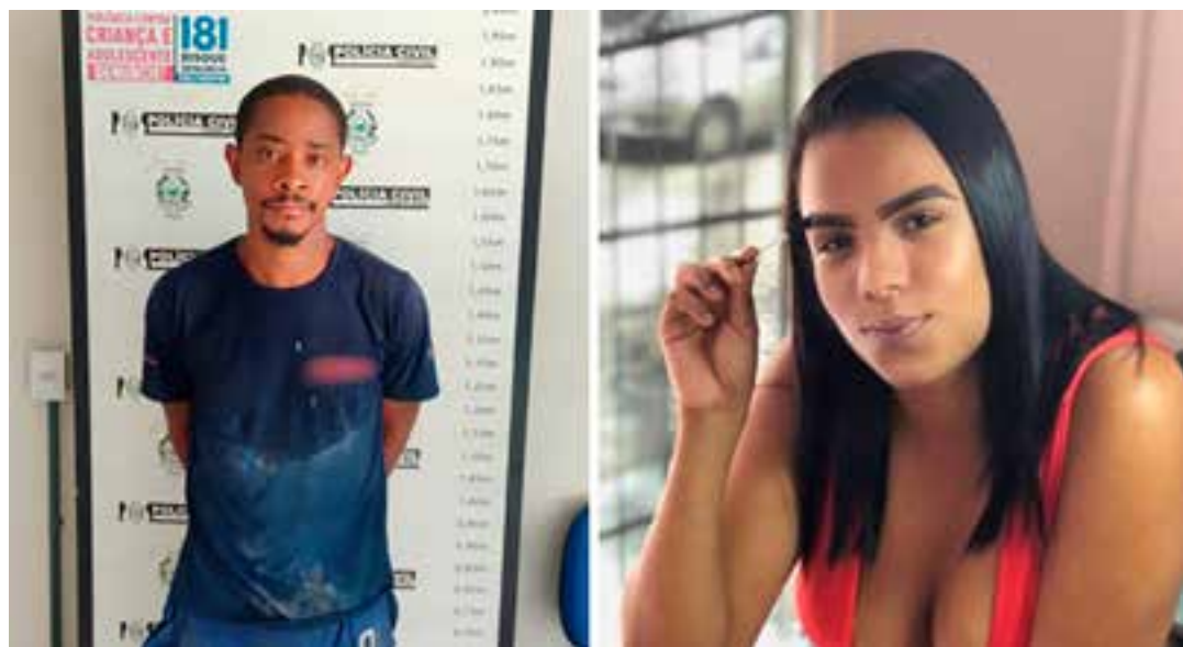
No curso das apurações, o homem confessou em interrogatório ter realizado o disparo que atingiu a companheira.

O caso segue sob responsabilidade da Polícia Civil.