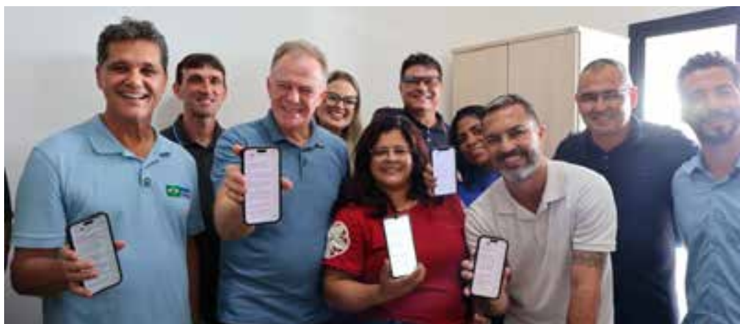
Também foi lançado o Dia D+ de Teleconsultas, ação estadual voltada à redução da demanda reprimida por atendimentos especializados.

“O giro que realizamos pelo Espírito Santo nestes últimos dias reforça o compromisso coletivo com o desenvolvimento do Estado. Em São Mateus, começamos com um encontro com as forças de segurança, reforçando o Estado Presente, e seguimos com entregas importantes na educação, saúde e infraestrutura. São investimentos estruturantes, como as obras de drenagem em Guriri e a modernização das escolas, que fortalecem oportunidades e melhoram a qualidade de vida da população”, destacou o vice-governador Ricardo Ferraço.