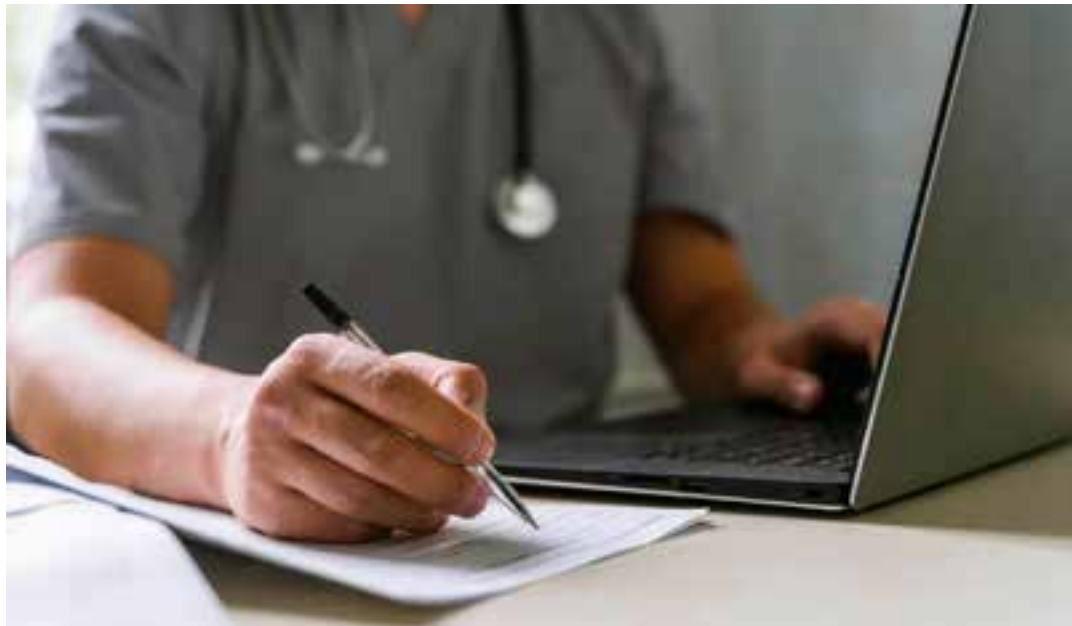
A doença já se aproxima das doenças cardiovasculares como principal causa de morte no país, reforçando o desafio crescente para o sistema de saúde.