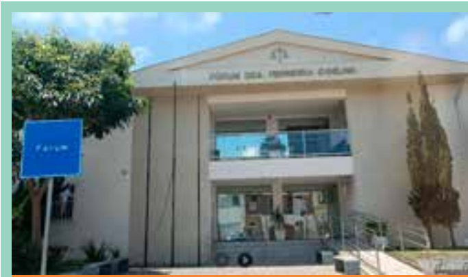
As ordens judiciais foram proferidas pela 1ª Vara de Condição da Barra, que analisou os pedidos separadamente, já que cada ação foi movida contra um perfil distinto.

Com uma programação diversificada, plural e articulada, a Jornada consolidou-se como um importante espaço de estudo, diálogo e construção coletiva, fortalecendo o trabalho pedagógico em toda a Rede Municipal de Educação.