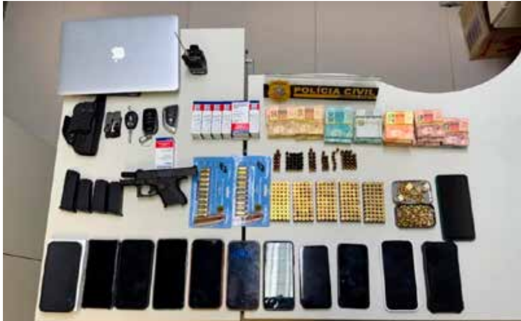
Nos imóveis ligados ao casal, a polícia apreendeu mais de R$ 40 mil em dinheiro, três armas de fogo com diversas munições, sete veículos e aparelhos eletrônicos, além de documentos relacionados à agiotagem.

“O patrimônio era totalmente incompatível com a renda declarada. O casal ostentava imóveis em condo-