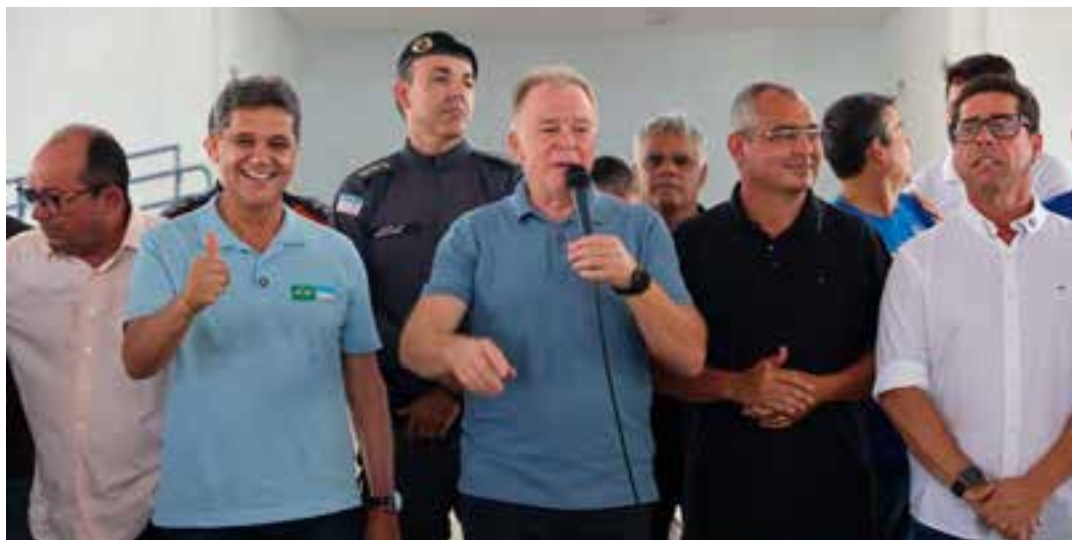
A agenda incluiu inaugurações e autorizações de obras nas áreas de educação, saúde, segurança pública e infraestrutura, além do acompanhamento de intervenções estruturantes no balneário de Guriri.

“Essa escola passa a oferecer um ambiente muito mais adequado ao processo de ensino e aprendizagem, com espaços modernos, acessíveis e preparados para atender às demandas pedagógicas atuais. Investir em infraestrutura escolar é garantir melhores condições de trabalho para os profissionais da educação e mais qualidade no aprendizado dos estudantes”, ressaltou o secretário.