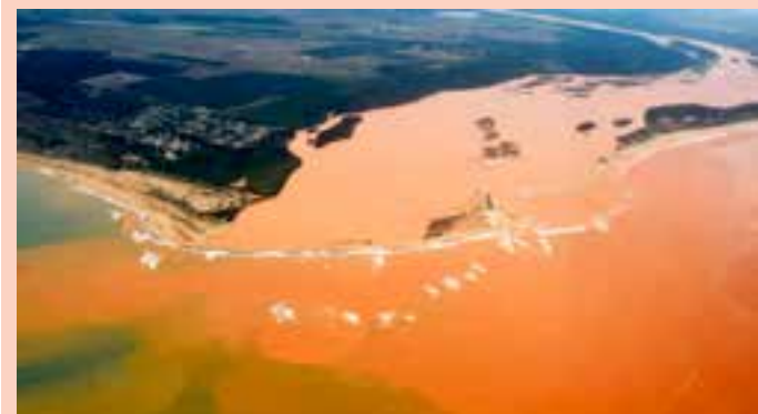
A decisão foi tomada após a corte reconhecer a validade dos programas de indenização implementados no Brasil ao longo dos últimos anos.

Segundo a mineradora, a Samarco segue implementando o Novo Acordo do Rio Doce, firmado com autoridades brasileiras em outubro de 2024, que prevê R$ 170 bilhões em ações de reparação e compensação. Desde o desastre, mais de 610 mil pessoas já receberam algum tipo de auxílio financeiro ou indenização no Brasil.