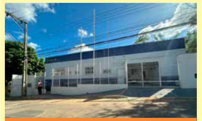
Segundo a Polícia Militar, um funcionário entrou no quarto para realizar a limpeza quando encontrou o corpo no chão.

O casal vai responder pelos crimes de organização criminosa e lavagem de capitais. As investigações seguem para identificar outros envolvidos no esquema.