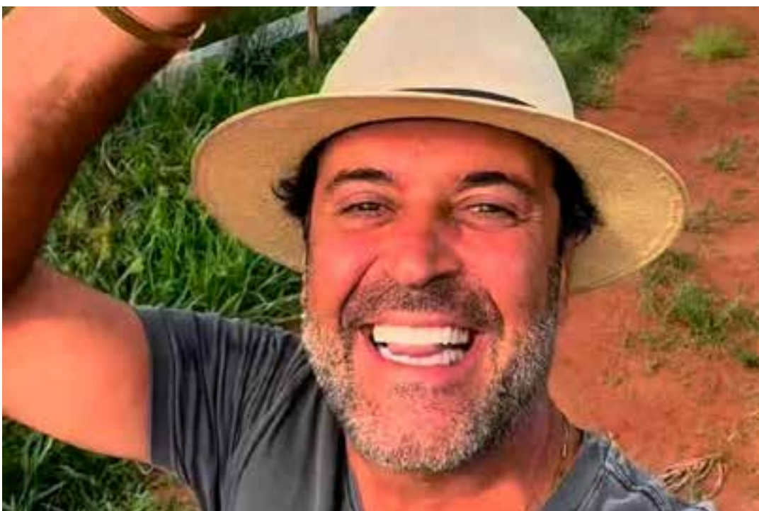
Lembrando bordão do influencer, o vice-governador de Minas Gerais lamentou a morte.

“Sexta-feira, papai. Pode olhar aí, meio-dia. Meu filho, quem fez, fez. Quem não fez, agora pra frente esquece, porque não faz mais”, brincou.