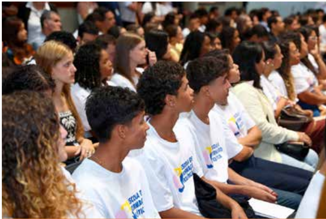
Uma das principais iniciativas de 2025 foi a implantação da Escola de Formação Política para Jovens, projeto que responde à necessidade de formar cidadãos conscientes e lideranças comprometidas com a democracia, os direitos humanos e o bem-estar coletivo.

A organização do curso ficou a cargo da Secretaria da Casa dos Municípios, responsável pela articulação com as cidades capixabas e pelo acompanhamento das aulas, enquanto a Escola do Legislativo respondeu pela certificação dos alunos e professores. Ao todo, foram ofertadas 20 disciplinas, que abordaram temas como ges-