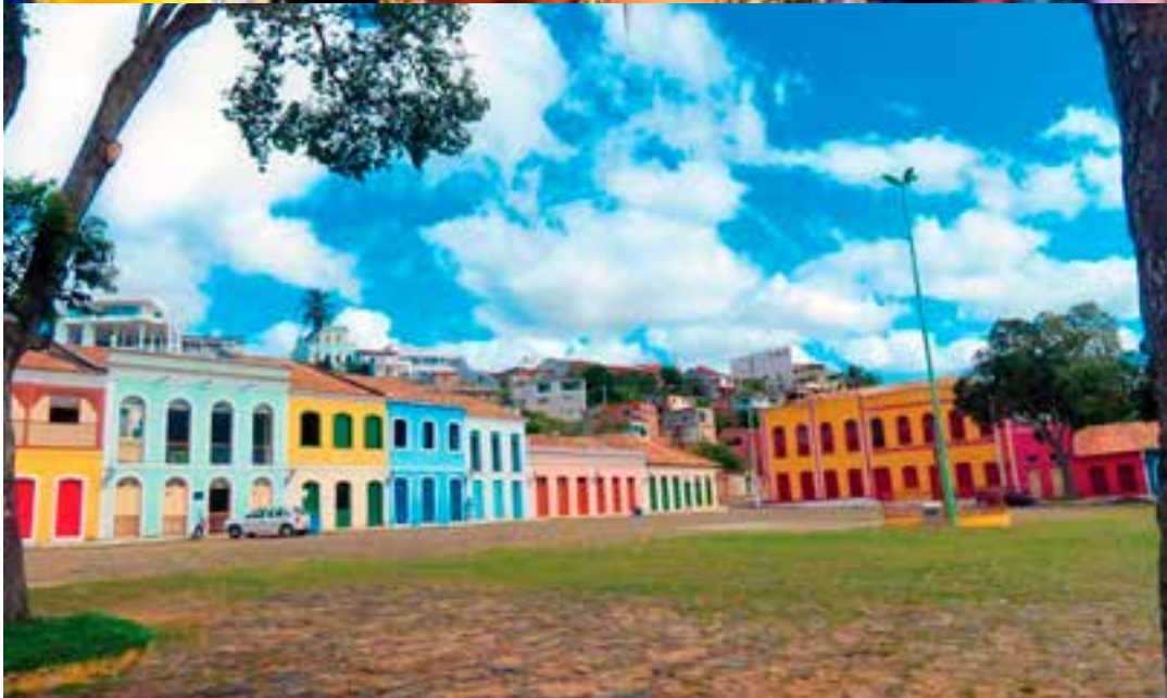
A escola de samba Rosas de Ouro, da Serra, levará a história, a identidade e a riqueza cultural do município para o Sambão do Povo, no Carnaval de Vitória, transformando a trajetória mateense em enredo e espetáculo.