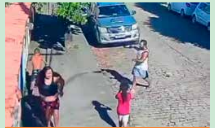
A mãe das crianças contou que o acidente aconteceu quando o Corpo de Bombeiros chegou ao local para fazer a retirada da colmeia, que já estava naquele local há cerca de dois anos.

O balanço das atividades de 2025 evidencia o papel estratégico da Casa dos Municípios como instrumento de apoio técnico, formação e articulação entre a Assembleia Legislativa e os municípios capixabas. As ações desenvolvidas ao longo do ano reforçam o compromisso da Ales com o fortalecimento da gestão pública municipal, o estímulo ao desenvolvimento econômico e a promoção da cidadania em todo o Espírito Santo.