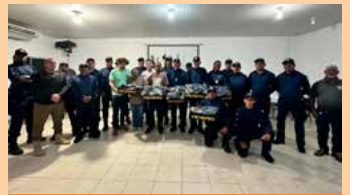
A entrega foi oficializada nesta quarta-feira (14), em cerimônia promovida pela Prefeitura, com a presença de autoridades e agentes da corporação.

Os números reforçam o compromisso do Governo do Estado com a inovação e a integração entre as forças de segurança, ampliando a presença do Estado nos espaços públicos e garantindo mais proteção à população capixaba por meio do Programa Estado Presente em Defesa da Vida.