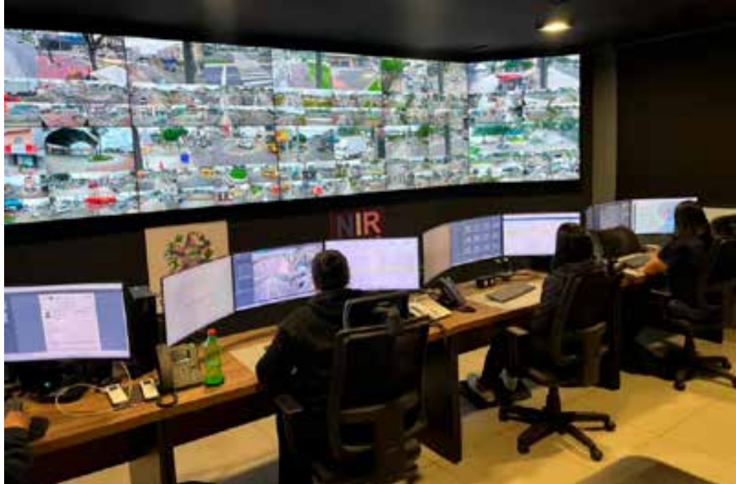
O resultado representa mais um avanço do Programa Estado Presente em Defesa da Vida, que tem investido de forma contínua em tecnologia e inteligência para o enfrentamento da criminalidade.

O vice-governador e coordenador do Programa Esta-