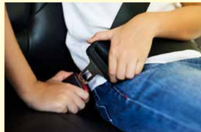
Mais da metade das pessoas que morreram em acidentes na BR-101 no ano passado, no Espírito Santo, e que estavam dentro de carros ou caminhões, não estavam usando o cinto de segurança.

Apesar de a maior parte dos acidentes ter ocorrido no período da tarde, somando 1.308 casos; os acidentes com vítimas fatais se concentraram principalmente à noite, com 38 ocorrências.