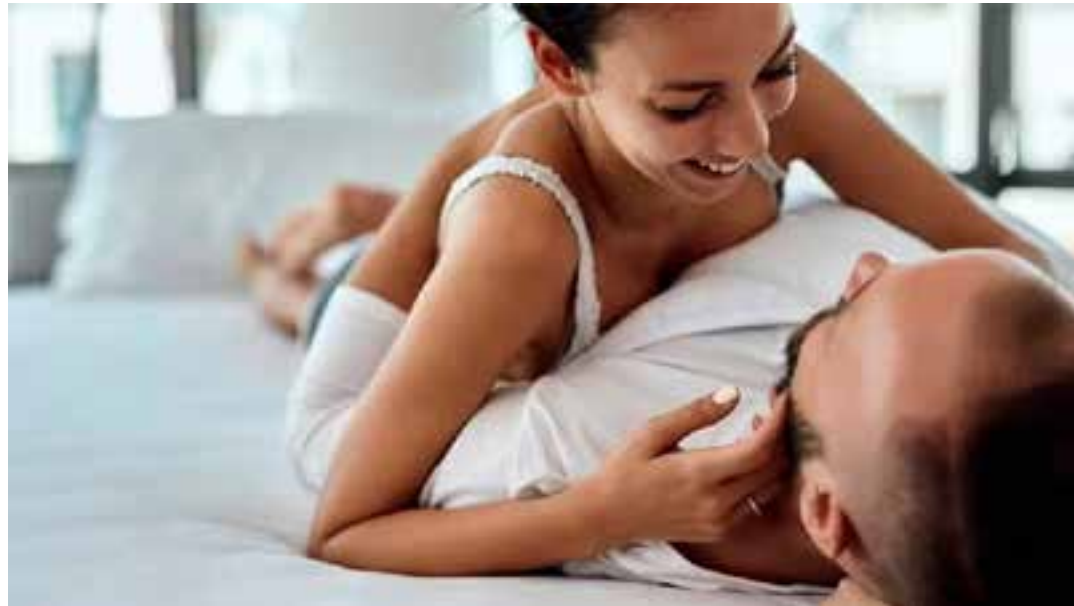
Sexóloga dá dicas de como ter uma vida sexual mais divertida e variada como resolução de Ano-Novo.

Outra dica essencial é priorizar o prazer, não apenas o orgasmo. “Focar apenas no orgasmo pode gerar ansiedade de