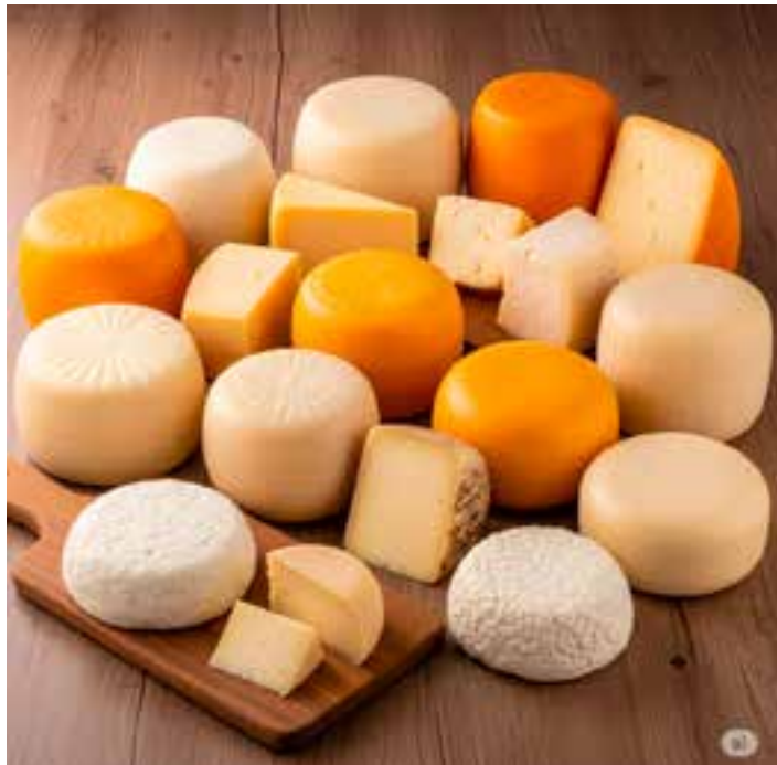
O Prêmio Queijos do Espírito Santo será realizado nos dias 10 e 11 de março de 2026.

As inscrições serão gratuitas e estarão abertas de 2 de fevereiro a 5 de março deste ano, exclusivamente pelo site www.agrolegal-es.com . Poderão participar queijarias e demais empreendimentos que produzam queijos ou requeijão no território capixaba e que estejam regularizados em serviço de inspeção oficial (SIM, SIE ou