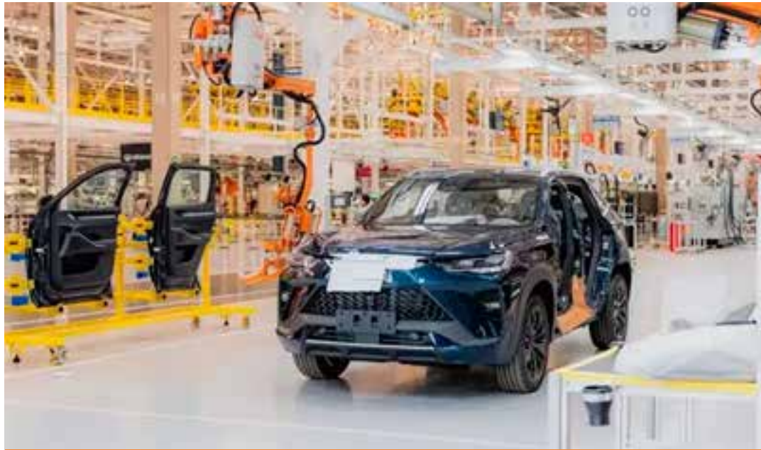
O anúncio foi feito pelo governador Renato Casagrande, que confirmou Aracruz como o município que receberá a fábrica.

O governador ressaltou ainda que a parceria amplia uma relação já existente. A