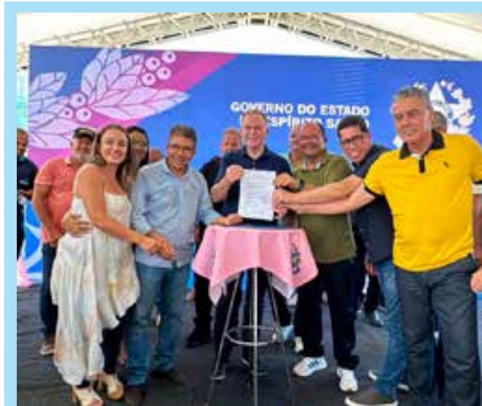
Ordem de Serviço para a pavimentação da Rodovia ES-010, no trecho Guriri – Meleiras – Barreiras, em Conceição da Barra, no Norte do Espírito Santo. A solenidade reuniu autoridades estaduais, lideranças municipais e moradores da região.

O acordo marca um novo capítulo para a industrialização capixaba e projeta Aracruz como polo estratégico para a produção de veículos no Brasil.