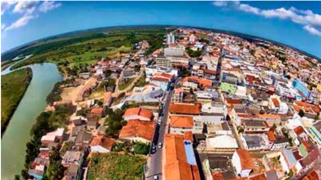
O estudo revela um marco histórico: 23 municípios capixabas já possuem Produto Interno Bruto acima de R$ 1 bilhão, refletindo a expansão da atividade econômica no Espírito Santo.

Destaques do crescimento econômico no ES O município que mais