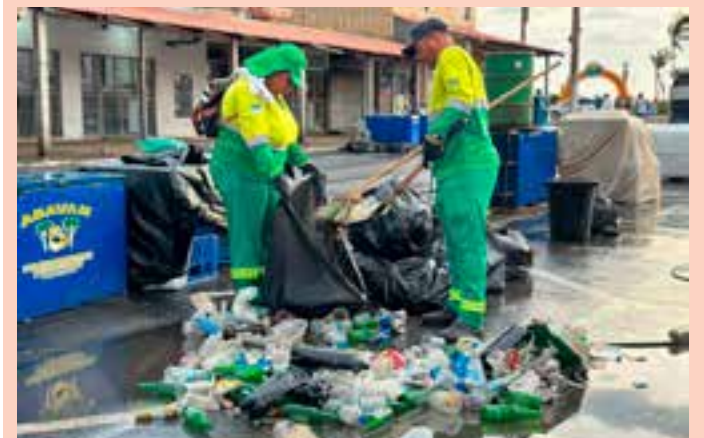
A Prefeitura de São Mateus reforça que manter Guriri limpa é uma responsabilidade compartilhada entre o poder público e a população.

Cuidar de Guriri é cuidar da cidade, do meio ambiente e das pessoas que vivem e trabalham aqui o ano inteiro.