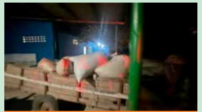
Durante a ação, o caseiro da propriedade e a esposa foram feitos reféns.

Além disso, o Governo do Estado deverá instalar novos totens de segurança no município e ampliar os pontos do cerco inteligente já existentes, reforçando ainda mais a segurança pública na região.