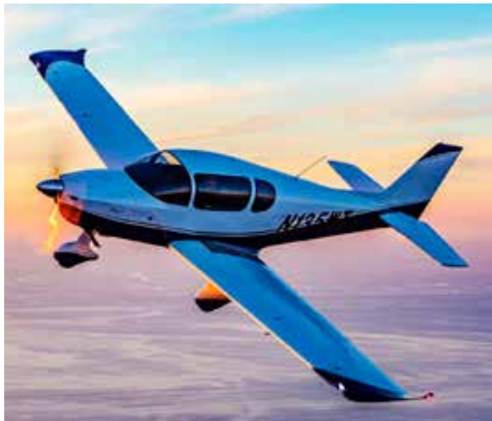
O SLING TSi é um monomotor de quatro lugares, sendo o segundo avião do mundo a atender às características da categoria Aeronave Leve Esportiva Especial com essa capacidade.

O aval da agência reguladora consolida Jaguaré como um polo emergente da aviação leve no Brasil e abre caminho para a expansão das vendas do modelo produzido no Espírito Santo.