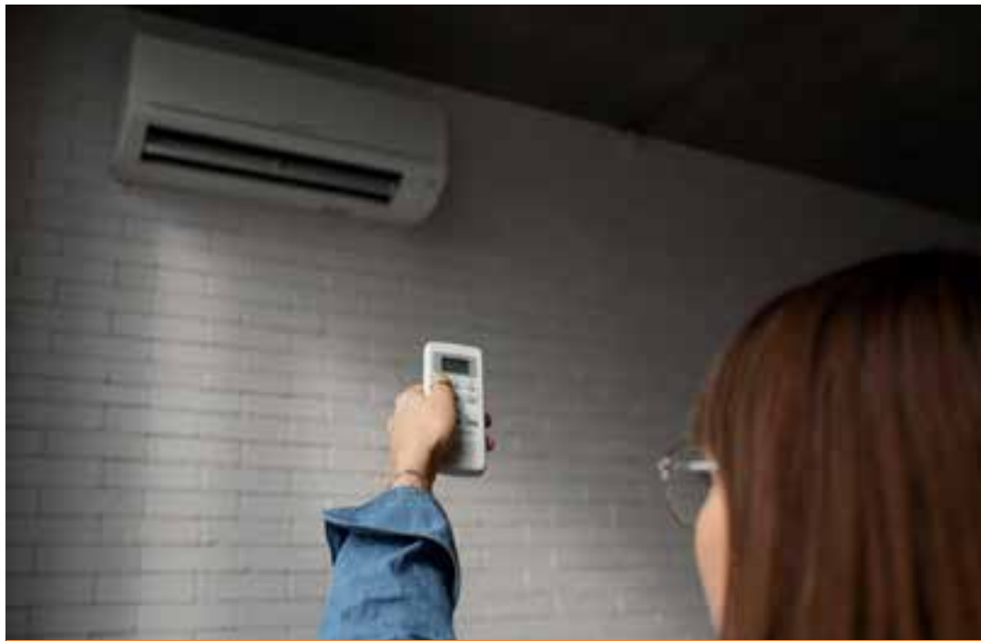
O docente do Curso de Engenharia Elétrica da Faculdade Anhanguera dá dicas para diminuir os gastos.

– Escolha correta do aparelho: no mercado há aparelhos que possuem uma melhor eficiência energética. A tecnologia conhecida como “inverter”