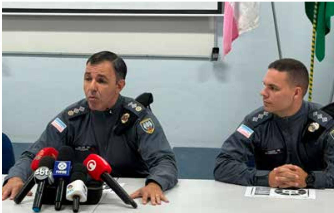
No estado, a abertura contou com a participação do Departamento de Operações de Trânsito (DOT) da Prefeitura da Serra e da concessionária Ecovias Capixabas.

Outro ponto ressaltado pelo subcomandante foi a ausência de registros de mortes tanto na área do evento quanto nas principais rodovias de acesso ao balneário durante o período festivo.