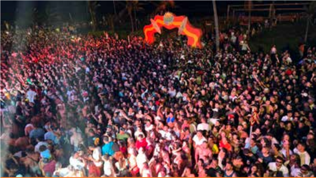
O aumento no fluxo de visitantes refletiu diretamente no consumo de serviços, no comércio formal e nas atividades informais ao longo da semana do Réveillon.

Além do comércio formal, a economia informal também foi fortemente impactada. Levantamentos pre-