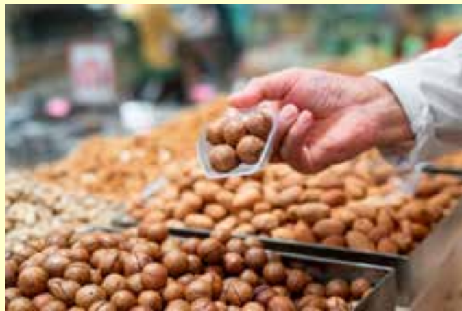
Produzida integralmente em São Mateus, ela combina estabilidade produtiva, ganhos expressivos de eficiência e forte inserção no mercado internacional, com destino praticamente exclusivo aos Estados Unidos.