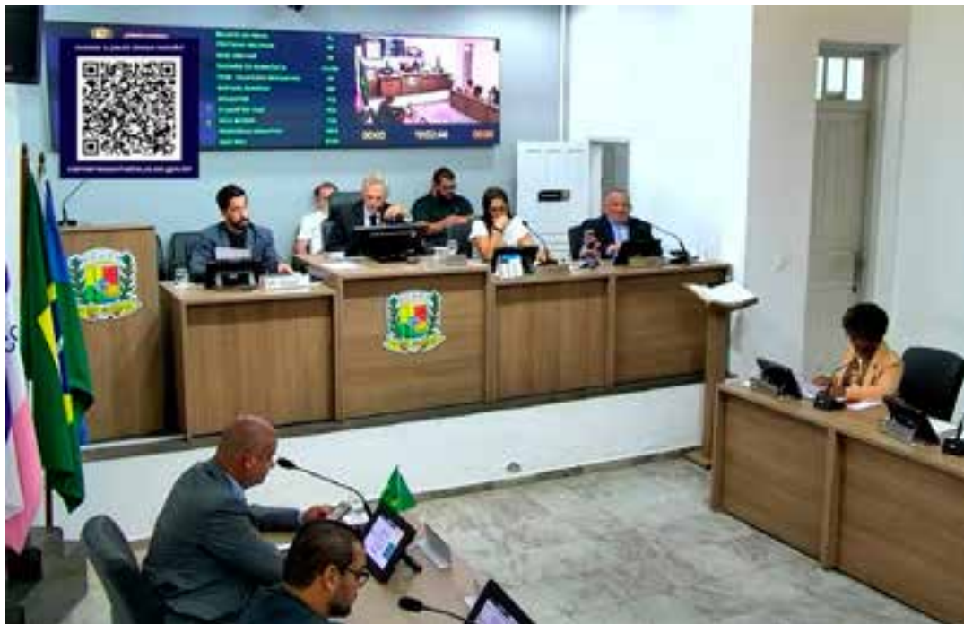
A medida passará a valer a partir da legislatura iniciada após a eleição de 2028, com efeitos práticos a partir de 2029.