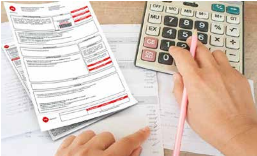
Campanha da distribuidora de energia para quitar dívidas vai até 30 de dezembro e inclui parcelamento em até 12 vezes sem juros.

Os consumidores podem obter informações sobre a