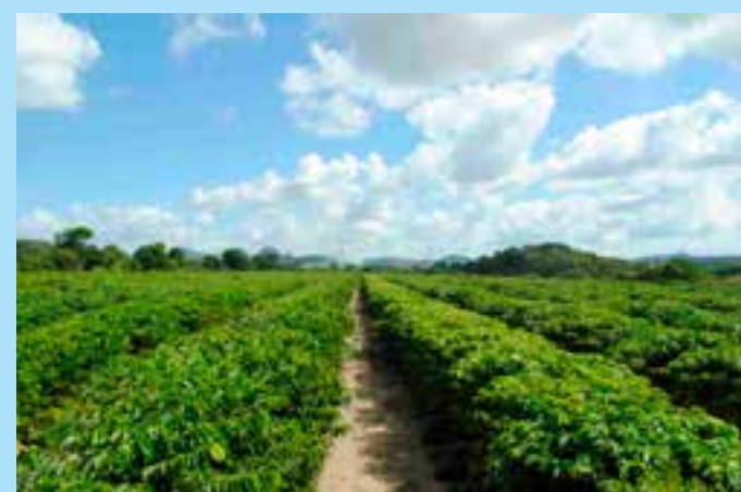
Um corpo em estado de decomposição foi encontrado em uma plantação de café, na altura do bairro Irmã Tereza Altoé, em Jaguaré, no Norte do Espírito Santo.