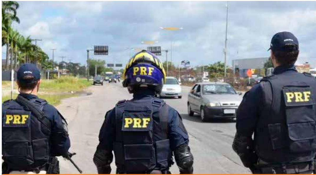
No estado, a abertura contou com a participação do Departamento de Operações de Trânsito (DOT) da Prefeitura da Serra e da concessionária Ecovias Capixabas.

Fase 1: de 18 de dezembro de 2025 a 4 de janeiro de 2026, com foco nos feriados de Natal e Ano Novo, quando há aumento expressivo do fluxo de veículos.