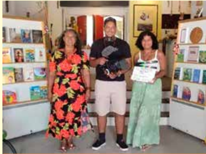
Filmando no Porto de São Mateus, “Constâncias” retrata diferentes gerações de mulheres ligadas à poesia e à arte.

O novo trabalho de Spike Luu dá continuidade à sua pesquisa artística voltada às narrativas negras, à memória ancestral e às práticas culturais como ferramentas de transformação social.