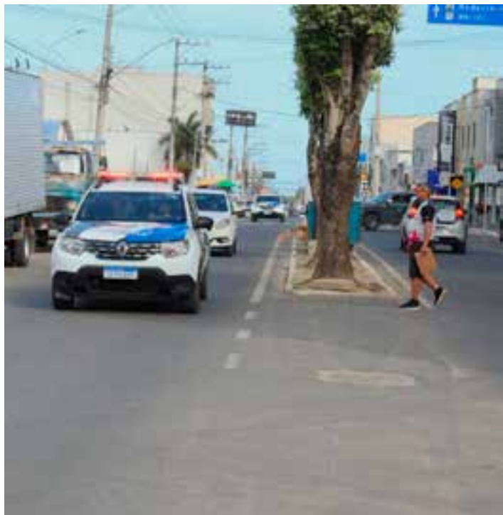
Dados apontam redução de crimes em Jaguaré; trabalho em conjunto entre as forças policiais e autoridades municipais reflete a eficiência das políticas públicas que são desenvolvidas no município.

Em Jaguaré, o município conta com o Gabinete de Gestão Integrada Municipal – GGIM, que é um fórum deliberativo e executivo que reúne a Prefeitura, polícias (Civil e Militar), Ministério Público, Judiciário e sociedade civil para tratar de políticas de segurança. Essas parcerias demonstram a integração das ações de segurança e a eficácia das estratégias adotadas para ampliar a proteção da população e do patrimônio dos moradores.