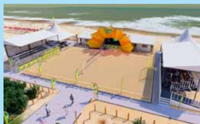
Estrutura de 1.200 m² será montada na faixa de areia e terá esportes, cultura, lazer e convivência durante toda a temporada.