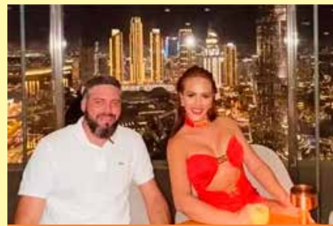
A investigação começou após uma vítima de Vila Valério relatar prejuízo de R$ 30 mil.

A Petrobras respeita o direito de manifestação dos empregados e, em caso de necessidade, adotará medidas de contingência para a continuidade de suas atividades”.