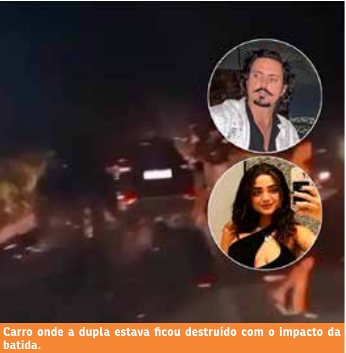
Carro onde a dupla estava ficou destruído com o impacto da batida.

A Polícia Civil (PCES) informa que o caso seguirá sob investigação da Delegacia de Polícia (DP) de Conceição da Barra.