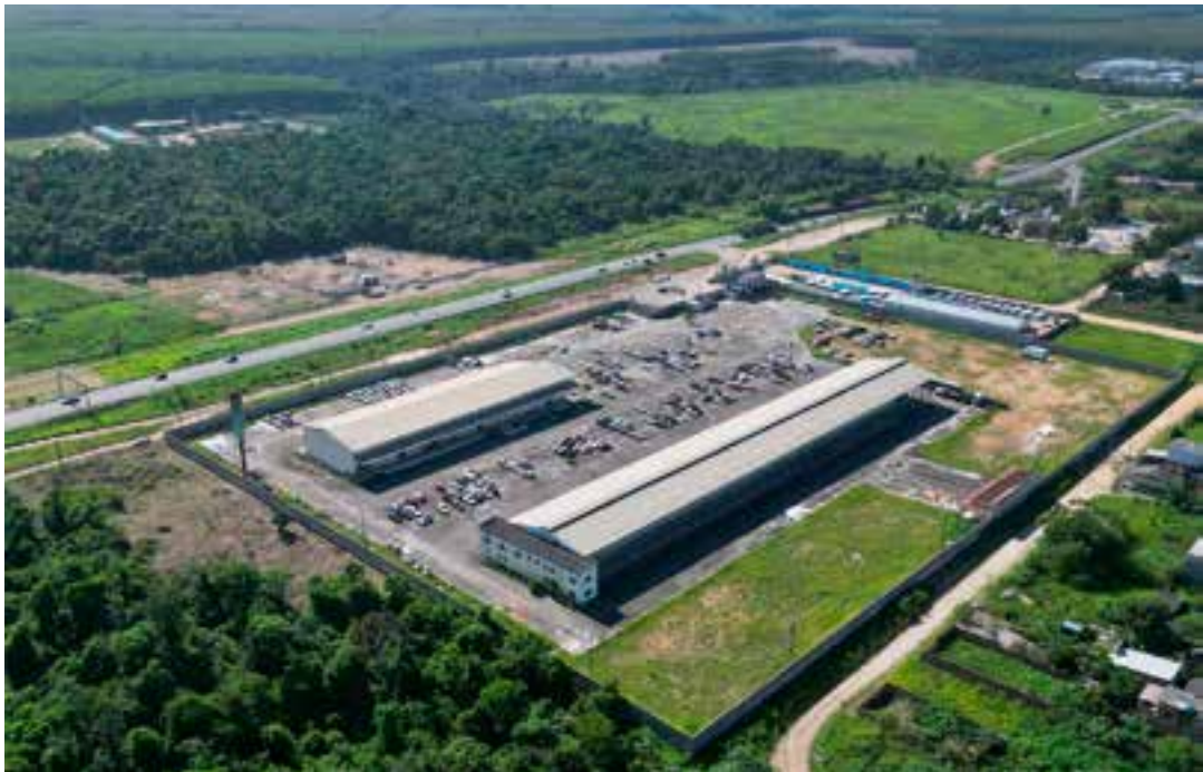
O primeiro Projeto de Lei prevê o pagamento de um ticket natalino no valor de R$ 541,54 a todos os servidores municipais de São Mateus.

Localizado às margens da BR-101, uma das principais rotas rodoviárias do país, o novo complexo reforça a posição de São Mateus como polo de integração logística. A localização facilita escoamento de produção e recebimento de insumos, fatores que ampliam a competitividade industrial e fortalecem a diversificação da economia local, hoje marcada pelo agronegócio e pelo