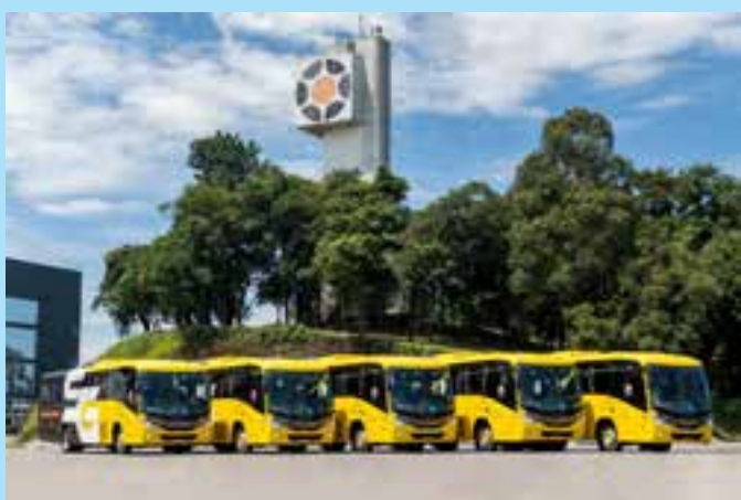
Aquisição inclui modelos Paradiso G8 1800 DD, Ideale, Torino e Viaggio G8 1050.

A prova prática também continua sendo obrigatória e deve ser agendada por meio dos canais disponibilizados pelo Detran, que também avaliará o desempenho do candidato.