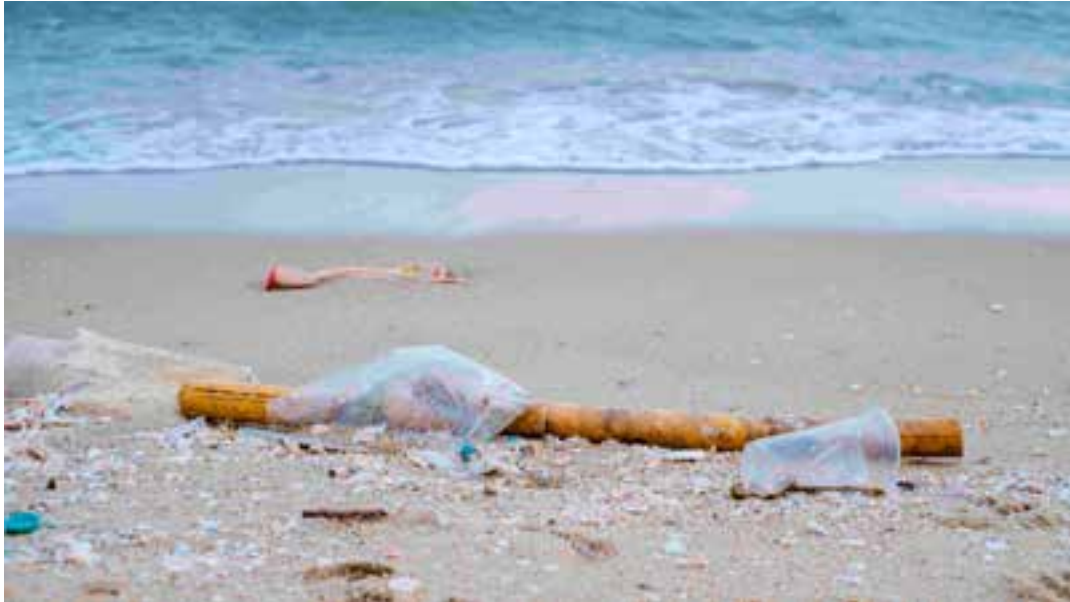
Pesquisa acende alerta ambiental e expõe fragilidades no saneamento, na gestão de resíduos e na proteção da vida marinha.