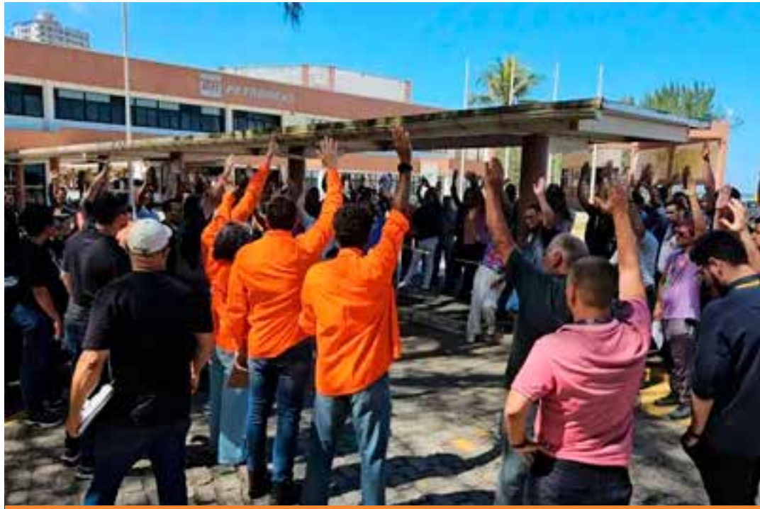
Categoria rejeita proposta da Petrobras para acordo coletivo.

proposta, os sindicatos dizem que vão notificar oficialmente a Petrobras sobre a paralisação na sexta-feira (12), cumprindo os prazos legais.