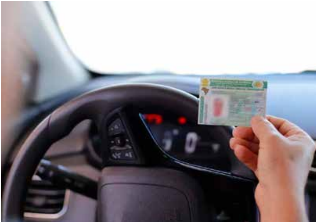
Além do fim da obrigatoriedade das aulas em autoescolas, governo lança aplicativo com conteúdo teórico gratuito.

A medida simplifica o processo de obtenção da CNH. O candidato poderá solicitar a abertura do processo pelo site da Secretaria Nacional de Trânsito (Senatran) ou pelo aplicativo.