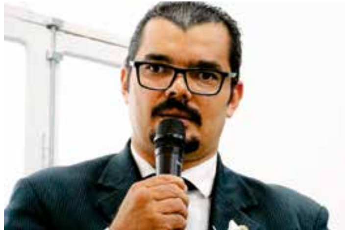
Suspeitos, de 23, 14 e 15 anos, renderam motorista após solicitarem uma corrida em Guriri, na terça (24). Eles foram alcançados pela polícia e detidos na sequência.

Entre as medidas apontadas pelo MPT-ES, que eram utilizadas pelos réus, estão a retirada do acesso aos computadores de trabalho das pessoas que declararam não ser eleitoras do então vereador.