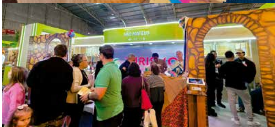
Entre os destaques mais comentados do evento está o estande de São Mateus, que tem conquistado o público com identidade, criatividade e muito sabor.

jovens... todos os públicos de uma forma geral. Então eu só tenho a agradecer por esse momento da nossa presença aqui”, concluiu.