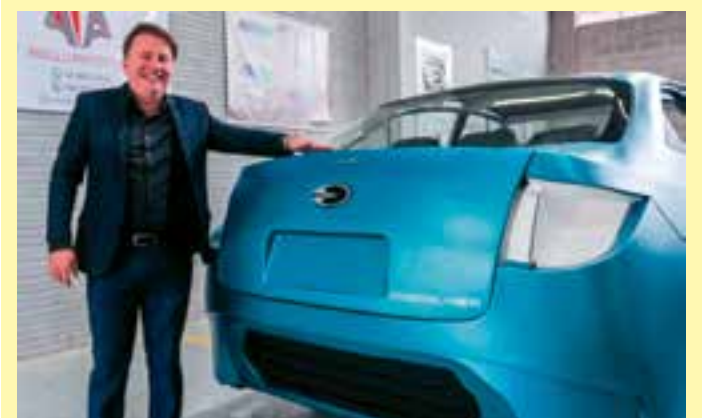
A Lecar quer ser a 1ª marca de carros elétricos do Brasil, com fábrica no Espírito Santo e parceiras como WEG e Marcopolo.

Também foram acionados o Corpo de Bombeiros, a Polícia Civil e a Polícia Científica. A reportagem procurou as corporações e a concessionária para ter mais detalhes sobre a ocorrência, mas não obteve retorno.