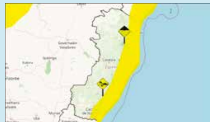
Os avisos, que indicam perigo potencial, foram emitidos nesta sexta-feira (4) pelo Instituto Nacional de Meteorologia (Inmet), e se somam a um terceiro, também de acumulado de chuva, que já estava em vigor.

Presencial, em qualquer agência dos Correios, para quem prefere atendimento físico ou não tem acesso à internet.