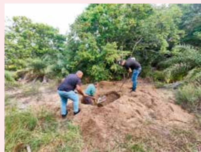
Uma denúncia anônima ajudou a polícia a encontrar o ponto exato; O local fica entre o Balneário de Guriri e Barra Nova.