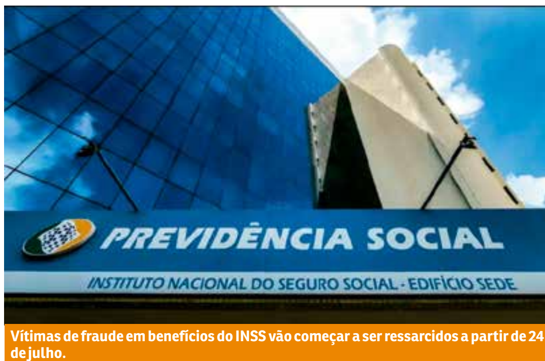
Vítimas de fraude em benefícios do INSS vão começar a ser ressarcidos a partir de 24 de julho.

Quando acontece um caso como esse, que é extraordinário, isso não pode ser computado como um gasto do governo. Esses gastos têm que ser considerados extraordinários para que não compute dentro do teto