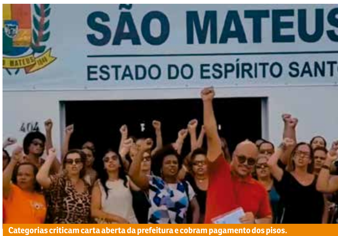
Categorias criticam carta aberta da prefeitura e cobram pagamento dos pisos.

O prefeito afirma que a gestão foi alertada pelo Tribunal de Contas do Estado (TCES) sobre uma “significativa queda na arrecadação municipal”, que somada aos efeitos das chuvas em Guriri,