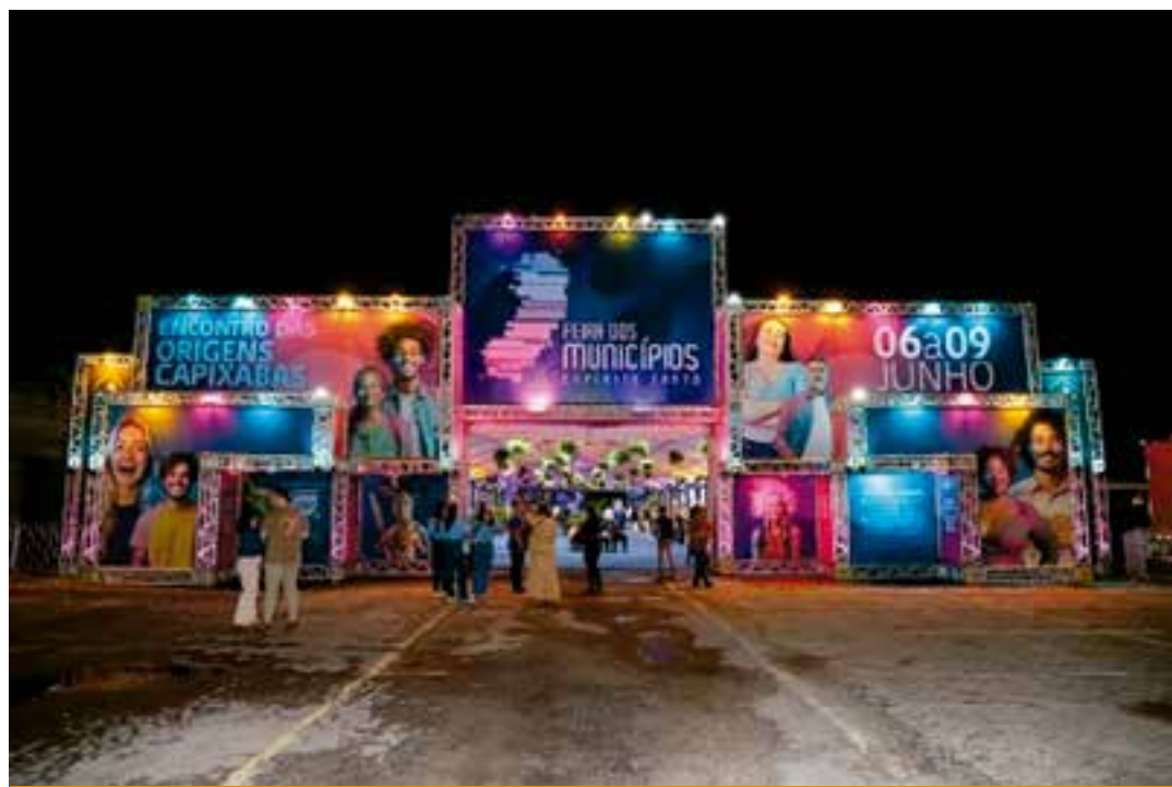
A feira, organizada pela Fundação Espírito Santo Turismo e Eventos, é uma oportunidade para o banco abrir diálogo com o público de todo o Estado, divulgando seus produtos e serviços, com ênfase nos programas de gestão municipal e linha para Turismo.

A iniciativa utiliza recursos do Fundo Geral do Turismo (Fungetur), do Ministério do Turismo, oferecendo soluções de crédito específicas. O acesso ao financiamento é feito por meio dos Correspondentes Bancários Bandes, Federação das Indústrias do Espírito Santo (Fines) e o Serviço Brasileiro de Apoio às Micro e Pe-