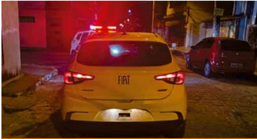
Suspeitos, de 23, 14 e 15 anos, renderam motorista após solicitarem uma corrida em Guriri, na terça (24). Eles foram alcançados pela polícia e detidos na sequência.