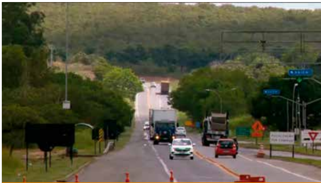
Empresa Ecovias 101 vai continuar administrando os 478 quilômetros da rodovia no ES e Sul da Bahia. O novo contrato é válido até 2048. A concessionária é responsável pelo trecho desde 2013.

Assim que o contrato for assinado, os motociclistas terão isenção de pedágio em