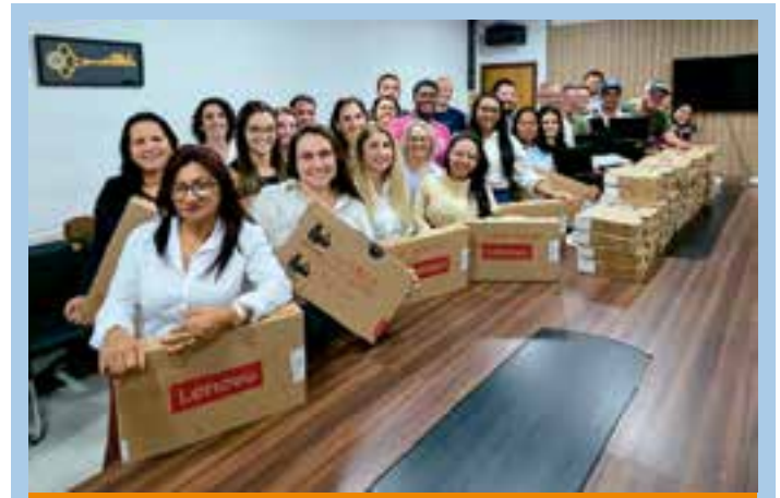
A doação faz parte das exigências definidas no processo de licenciamento do loteamento e representa um avanço na modernização dos serviços públicos do município.