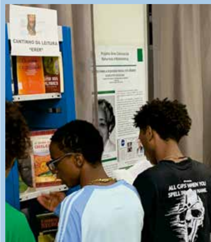
O evento envolveu todos os turnos escolares, transformando os espaços da escola em verdadeiros territórios de memória, cultura e resistência.

A categoria também denuncia o adoecimento mental provocado por jornadas extensas, salas superlotadas e estrutura precária. Relatos de ansiedade, depressão e esgotamento físico e mental são cada vez mais frequentes, como tem denunciado a vereadora Professora Valdirene (PT), que também participou da reunião da mesa de negociação e criticou a postura da administração, que havia prometido, no final de março, um reajuste linear de 5,51% para os servidores, mas não cumpriu.