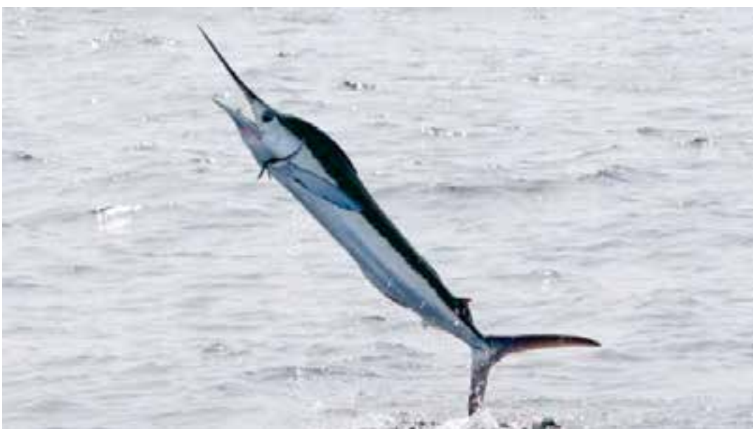
O acidente ocorreu quando ele tentava soltar o anzol do peixe de aproximadamente 27 quilos, e o animal saltou da água, atingindo-o na boca e lançando-o de volta ao barco.

Situações envolvendo objetos penetrantes no crânio são raras, mas já foram descritas em registros médicos desde o século 19, como no caso de Phineas Gage, em 1848, que sobreviveu a uma barra de ferro atravessando seu crânio.