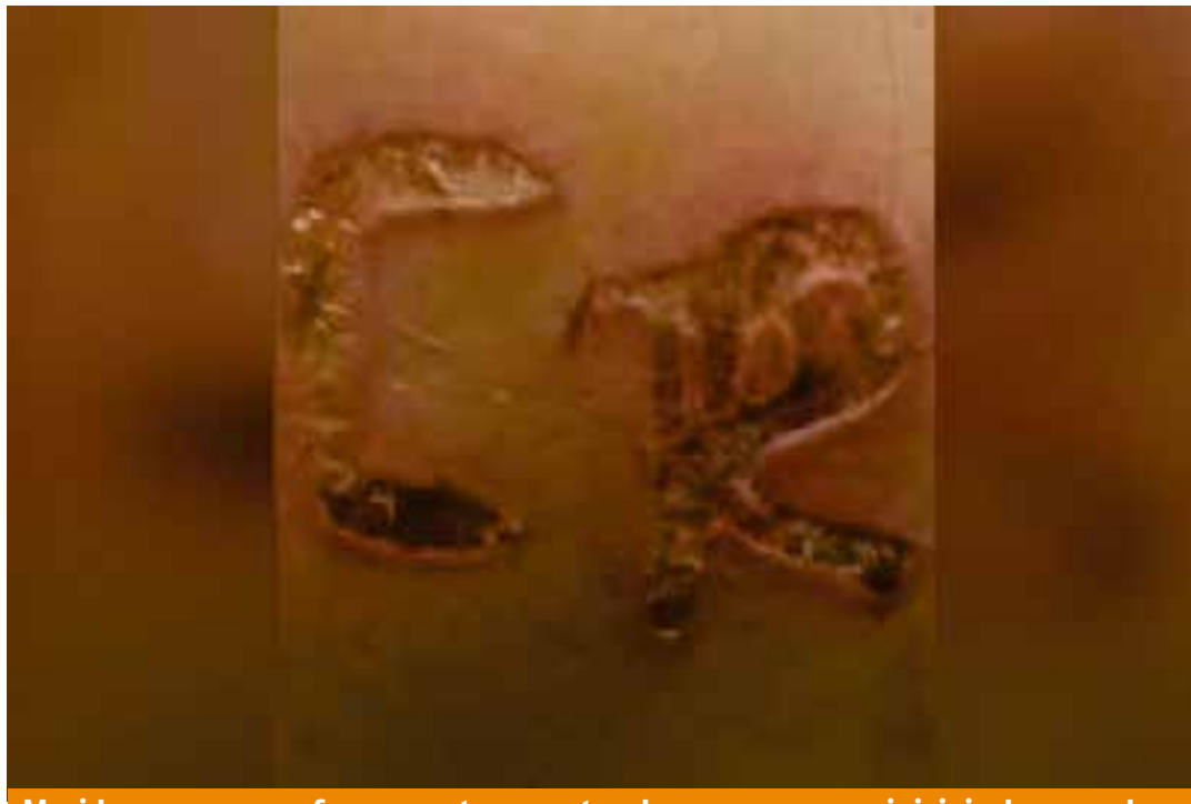
Marido marcou com ferro quente as costas da esposa com as iniciais do seu sobrenome, "C" e "R". Caso aconteceu em Cosmorama (SP)

Além disso, o denunciante indicou que a vítima estaria amarrada em uma corda para cachorros e que havia sido marcada com as letras C e R em suas costas,