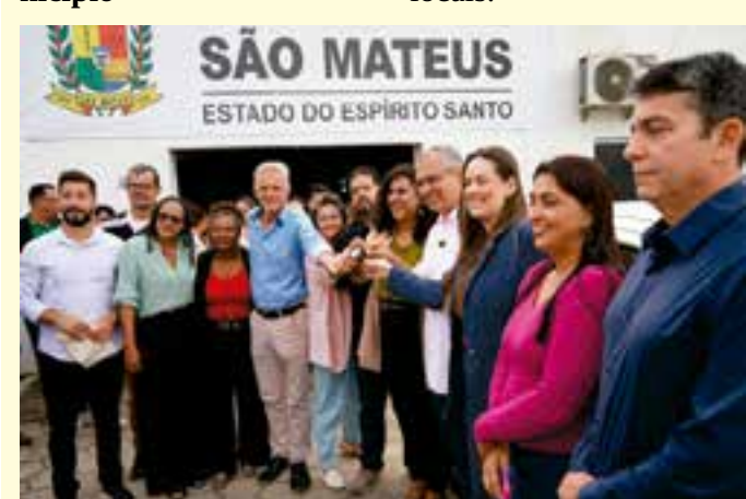
Evento reforça compromisso com políticas públicas de proteção e acolhimento às mulheres