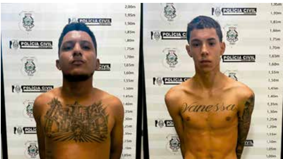
Assassinato ocorreu há quase dois anos; Polícia afirma que, conforme as investigações, criminosos confundiram o carro da vítima com o veículo de integrantes de uma facção rival.

No momento da operação, um terceiro homem foi detido ao ser flagrado com uma arma ilegal, 50 munições, cinco carregadores e drogas.