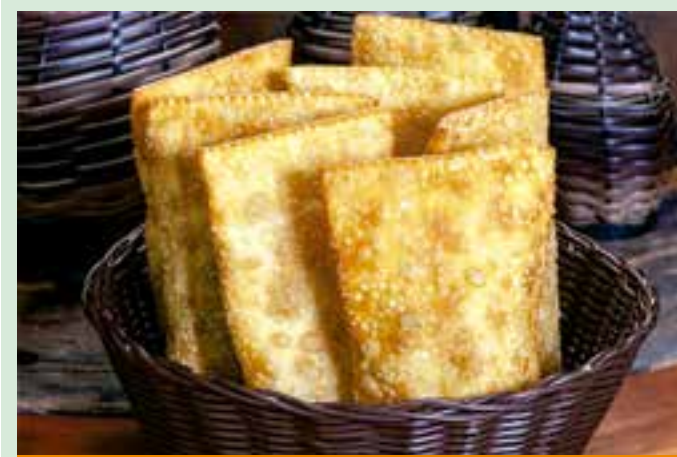
Empresa chegou a pedir multa por má-fé, mas juiz optou por um "esporro". O prazo para recurso da decisão está aberto.

O caso seguirá sob investigação da Delegacia de Proteção à Criança ao Adolescente (DPCA). Por envolver menor de idade, o procedimento tramita sob sigilo, conforme previsto em lei.