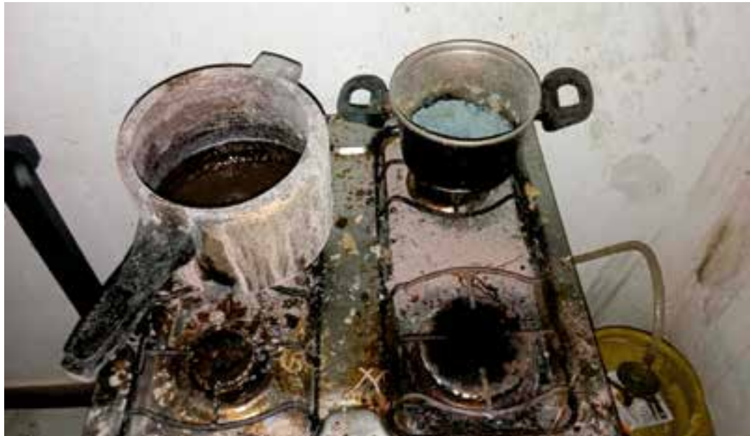
A casa onde estavam os três irmãos não tinha nenhum tipo de mobília, apenas dois colchões. As crianças foram entregues ao Conselho Tutelar.

Três crianças, de 4, 9 e 13 anos de idade, foram encontradas pela Polícia Militar sozinhas, sem comida e em um imóvel em condições precárias no bairro Porto Novo, em Cariacica. A mãe das crianças, que tem 37 anos, acabou presa por abandono de incapaz.