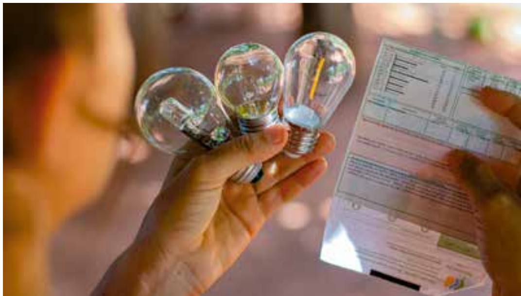
Segundo o governo federal, mais de um milhão de consumidores capixabas podem ser beneficiados pelo programa Tarifa Social, que libera de pagamento famílias com consumo de até 80kWh mensais.

Para ter direito ao benefício da Tarifa Social de Energia Elétrica, deve ser satisfe-