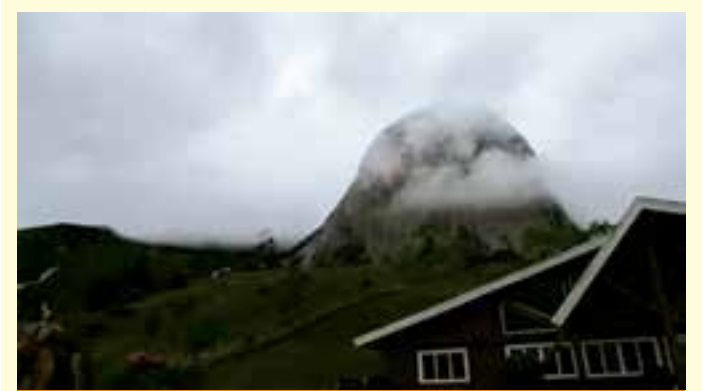
Confira a previsão do Instituto Nacional de Meteorologia (Inmet) sobre a estação mais fria do ano, que começou nesta sexta-feira (20).

A Prefeitura de São Mateus reforça seu compromisso com a qualidade do transporte público e segue atuando de forma firme na cobrança por melhorias. As mudanças anunciadas são fruto direto da atuação da atual gestão e da disposição para o diálogo com os concessionários, sempre priorizando o interesse da população.