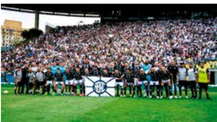
O valor faz parte de um Projeto de Lei que tramita na Assembleia Legislativa e prevê repasses milionários aos times capixabas que se classificarem para torneios como a Copa do Brasil ou as séries do Campeonato Brasileiro.