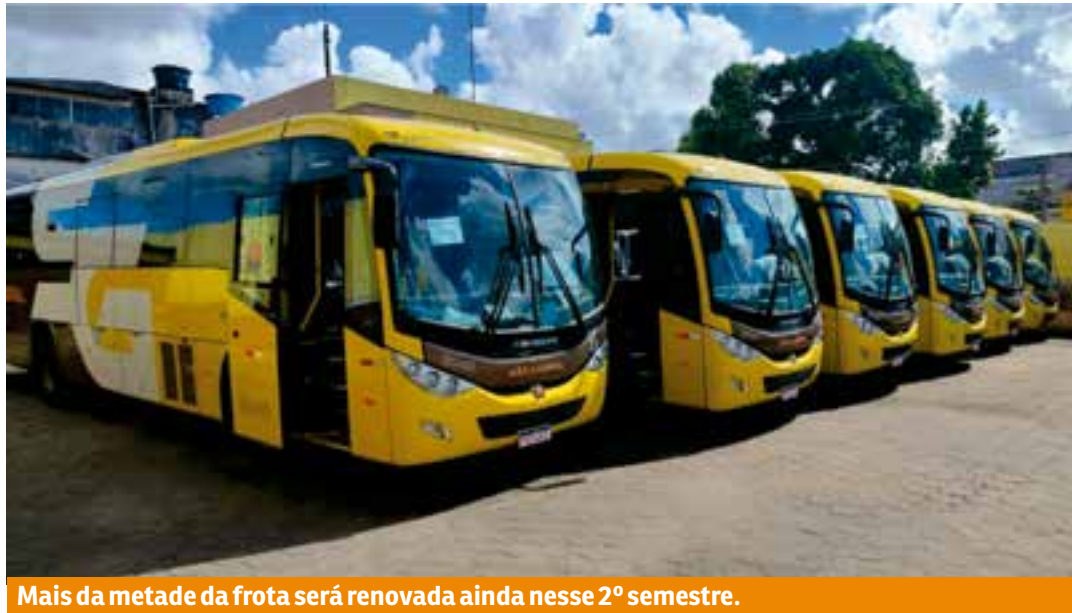
Mais da metade da frota será renovada ainda nesse 2º semestre.

A identidade visual dos veículos também ganhará novos elementos, com referências a bairros turísticos e pontos de interesse cultural de São Mateus, como a Igreja Velha e o bairro do Porto, que concentram importantes marcos históricos e atra-