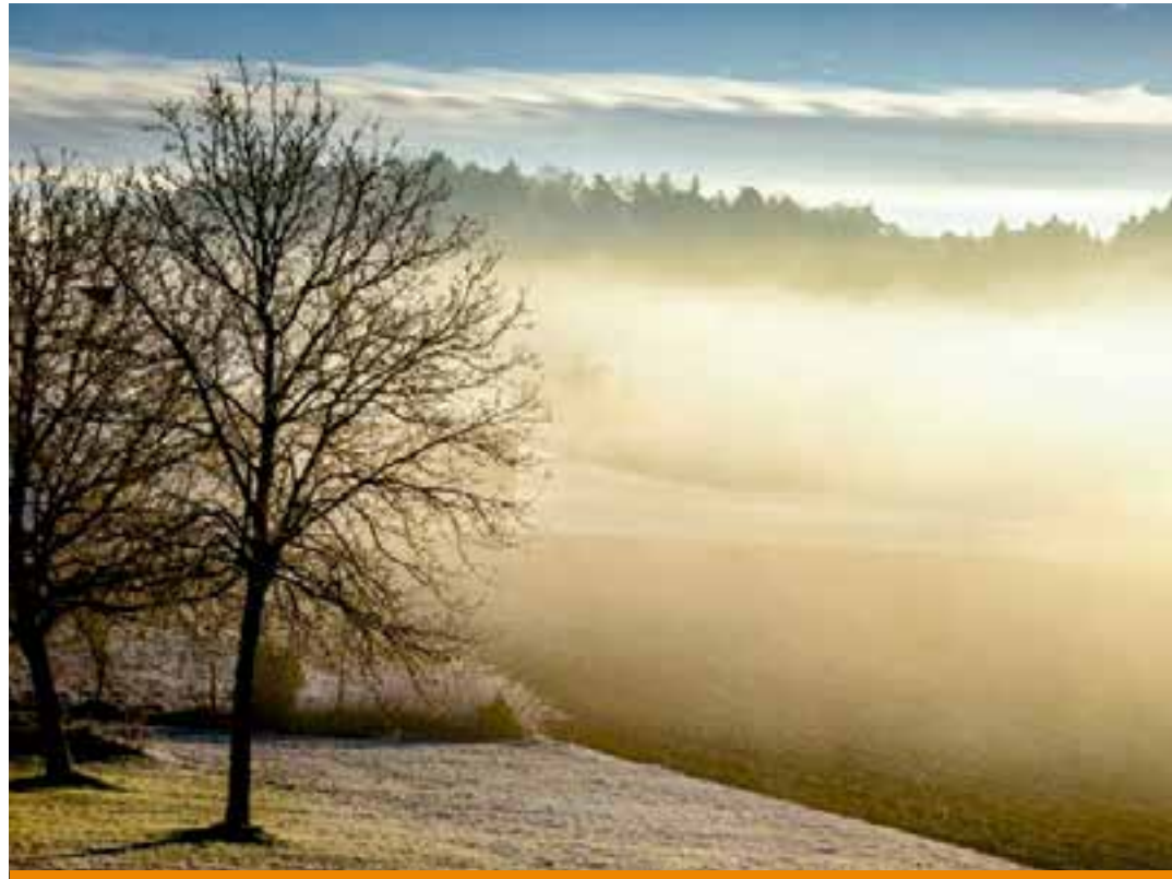
A estação é marcada por redução nas chuvas e temperaturas mais amenas, especialmente nas regiões Serrana e do Caparaó, onde os termômetros podem registrar mínimas abaixo dos 10°C nas áreas mais elevadas.

Entre os fenômenos típicos da estação estão a formação de nevoeiros ao amanhecer em áreas de vale, com risco de baixa visibilidade nas estradas, e a ocorrência de geadas nas regiões mais altas, que podem afetar lavouras sensíveis e causar desconforto tér-