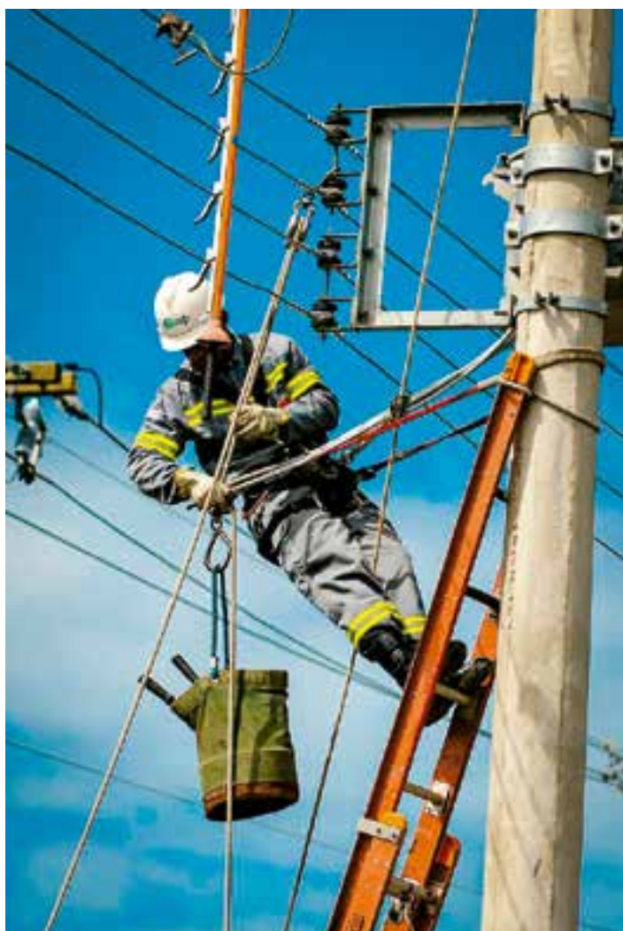
Iniciativa é gratuita e oferece formação profissional completa.