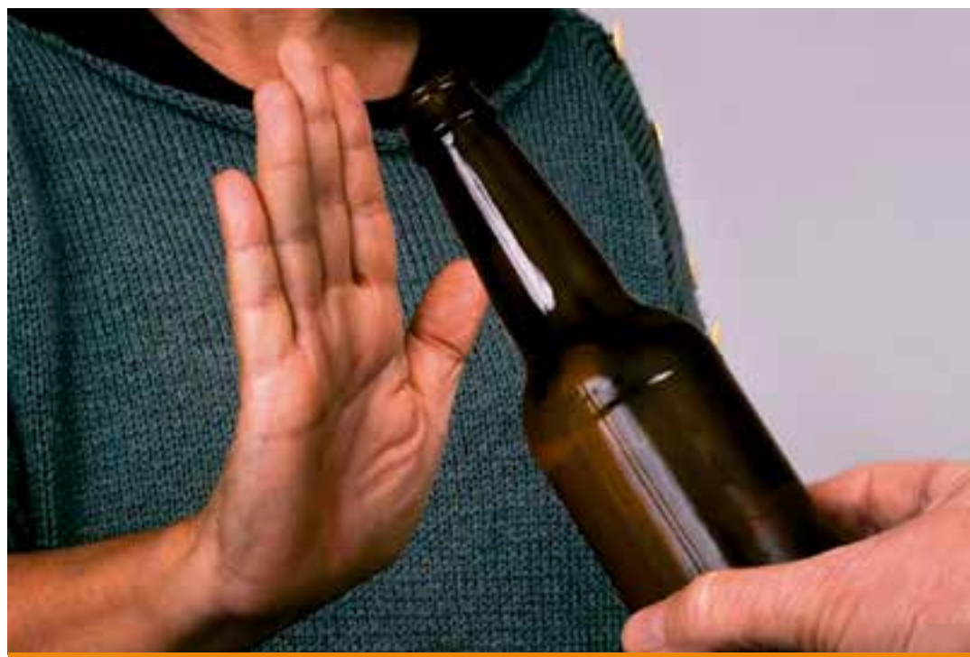
Estudo com 2,5 milhões de pessoas mostra relação entre álcool e risco de câncer de pâncreas, independente do sexo e do tabagismo.

Os novos dados do IARC indicam uma ligação significativa, ainda que modesta, entre a ingestão de bebidas alcoólicas e a doença. A análise reuniu informações de 30 estudos