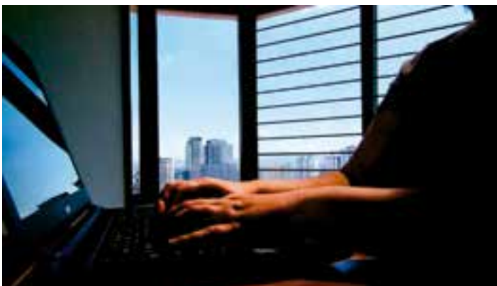
Golpistas clonam cartão, se passam por clientes, compram passagens com agências e as anunciam por preços muito abaixo em redes sociais.

O caso de golpe está sendo investigado pela Polícia Civil. Até o momento nenhum suspeito foi identificado.