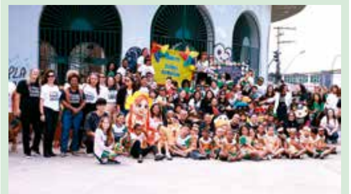
Na manhã de quinta-feira, 12 de junho, foi realizada em São Mateus uma passeata em alusão ao Dia Mundial e Nacional de Combate ao Trabalho Infantil.

Além disso, Hoffman defende que os órgãos de fiscalização, como a ANP, os Procons estaduais e o Ministério Público Estadual (MPES) deveriam ter uma atuação mais firme e articulada para garantir que as reduções anunciadas pela Petrobras sejam, de fato, repassadas ao consumidor final. “É papel do governo, inclusive em parceria com o MP, verificar quanto foi reduzido na refinaria e quanto realmente está chegando ao consumidor”, cobra.