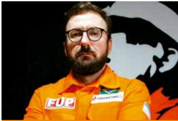
População enfrenta efeitos da privatização, aponta coordenador da entidade no Estado.

Apesar da estabilidade ou até redução em alguns custos ao longo dos últimos anos, como os tributos federais zerados desde 2023, o preço final do botijão continua elevado. O sindicalista cita dados da Agência Naci-