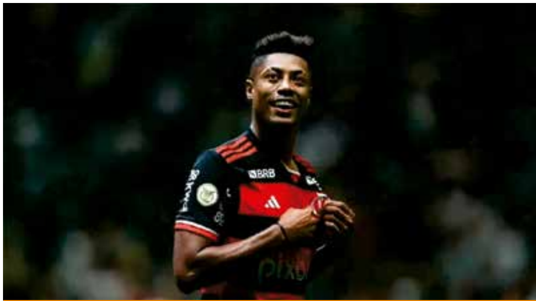
A defesa do atleta foi procurada, mas a reportagem ainda não obteve resposta. O clube carioca também foi procurado, mas também não se manifestou.

A pena para o crime de fraudar competição ou evento esportivo, prevista no art. 200 da Lei Geral do Esporte, é de dois a seis anos de prisão. A de estelionato, de um a cinco anos de reclusão. Para o MPDF, houve associação criminosa do grupo.