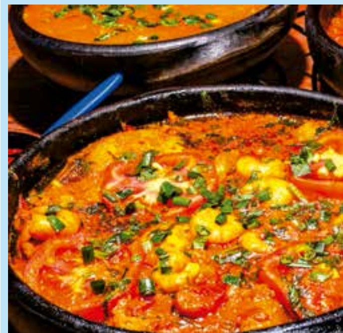
Festival da Moqueca de Conceição da Barra vai servir mil unidades em panelas de barro e terá versões do prato a partir de R$ 12.