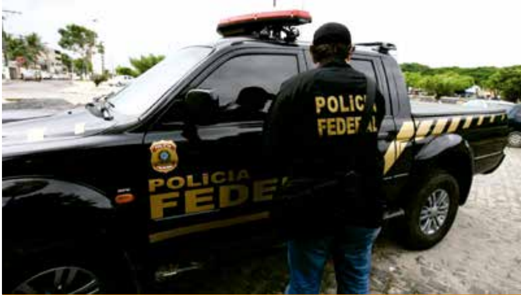
São vagas para delegado, perito, escrivão, agente e papiloscopista.

Os interessados devem se inscrever exclusivamente no site oficial da banca organizadora, o Centro Brasileiro de Pesquisa em Avaliação e Seleção e de Promoção de Eventos (Cebbraspe).