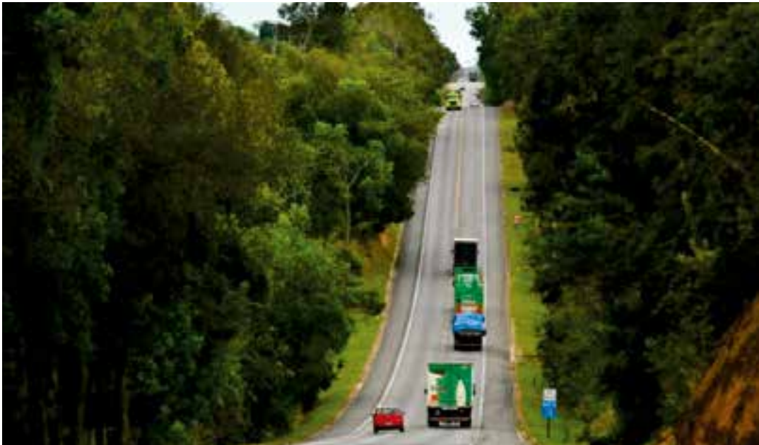
A BR-101 é a segunda estrada mais longa do Brasil, estendendo-se por 12 estados, desde o Nordeste até o Sul.

Embora parte da BR-101 já esteja duplicada, o estado ainda enfrenta pontos críticos com pistas simples, tráfego intenso de veículos pesados e sinalização deficiente. Esses fatores contribuem significativamente para o aumento do risco de acidentes. Nos últimos anos, moradores e autoridades locais têm solicitado mais fiscalização e agilidade nas obras de duplicação em trechos considerados perigosos.