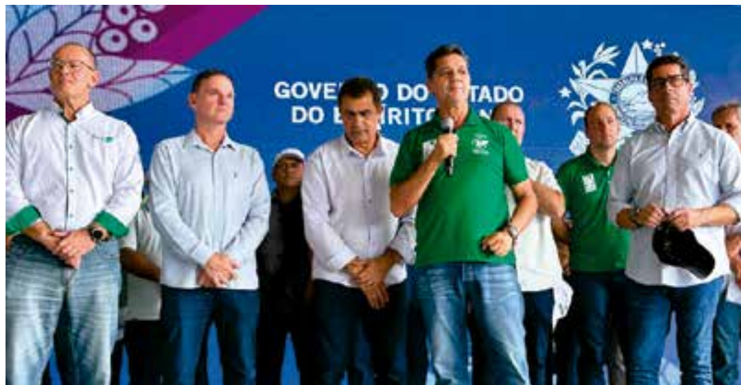
O evento teve a presença do governador em exercício, Ricardo Ferrão.

“Fazemos tradicionalmente esse momento de celebração dessa riqueza extraordinária que distribui tanta renda e tantas oportunidades para nossa gente no Espírito Santo. É melhor ainda numa época como essa, em que o café está remunerando o produtor rural com justiça. Nosso Estado não chegou onde chegou por acaso. A determinação e o empenho das cafeicultoras e dos cafeicultores, bem como a dedicação dos pesquisadores e extensionistas, crédito facilitado, investimentos, estímulo e apoio do Governo do Estado e o poder público, muito cooperativismo e empreendedorismo nos transformaram numa potência internacional. É muito café e café de qualidade. Na última semana, uma das mais modernas fábricas de café solúvel do mundo começou oficialmente a processar o café capixaba para levar produtos com valor agregado para todos os continentes do pla-