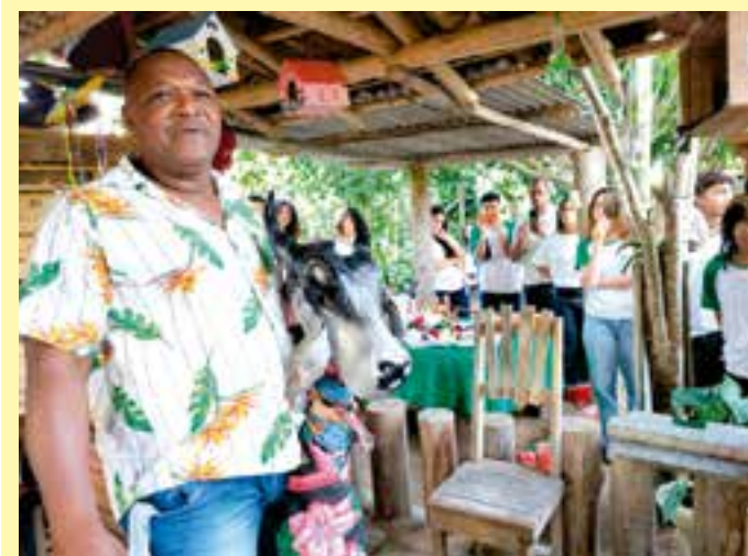
Estudantes visitaram comunidade quilombola e vivenciaram práticas tradicionais, saberes intergeracionais e reflexões sobre identidade e resistência.