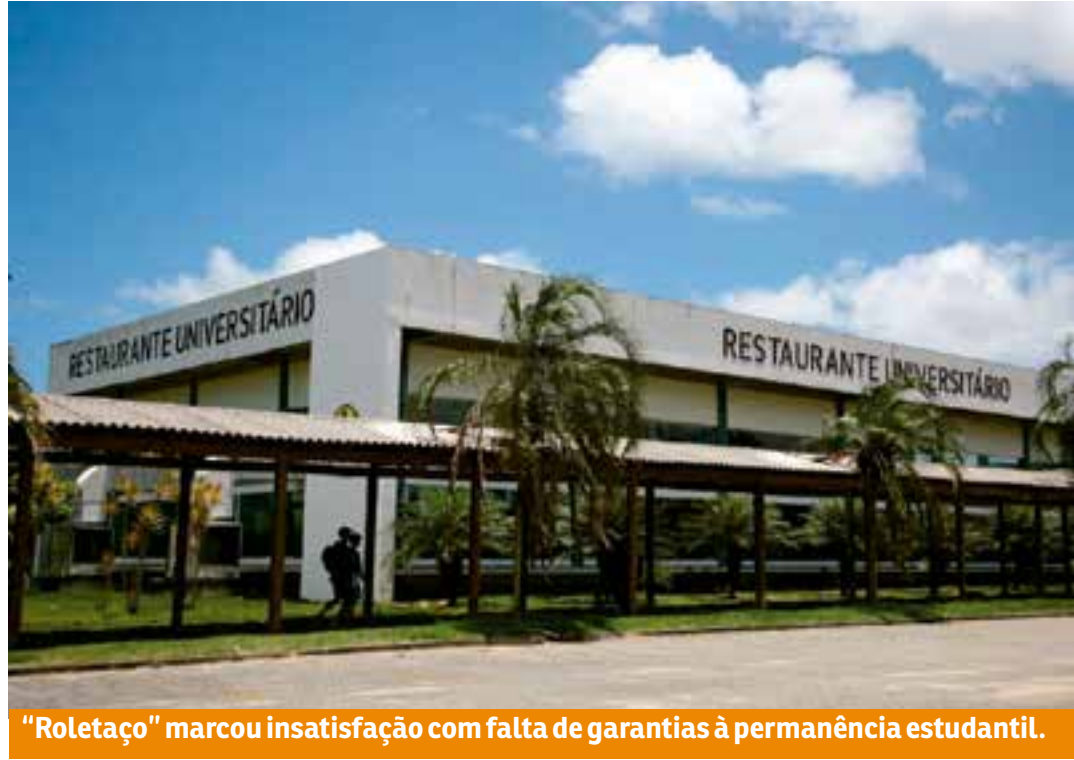
“Roletaço” marcou insatisfação com falta de garantias à permanência estudantil.

“Essa situação é inadmissível. Estão negando nossos direitos mais básicos”, diz a nota do diretório.