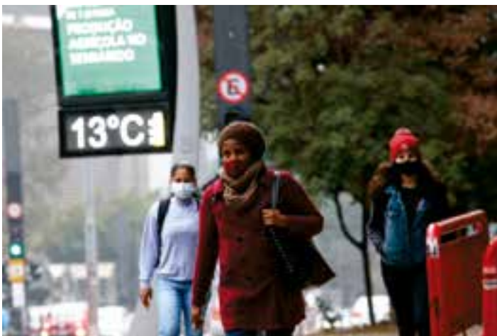
Segundo o Incaper, os termômetros podem marcar mínima de 19°C na Grande Vitória neste final de semana. Veja a previsão do tempo.