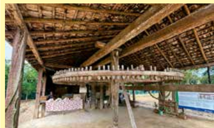
O local passou por uma restauração orçada em R$ 140 mil, inteiramente financiada pela empresa Suzano.

Casa de Farinha de São Mateus Endereço: Av. Dom José Dalvit, São Mateus/ES Funcionamento: Sextas-feiras e sábados (6h às 18h) e domingos (6h às 13h)