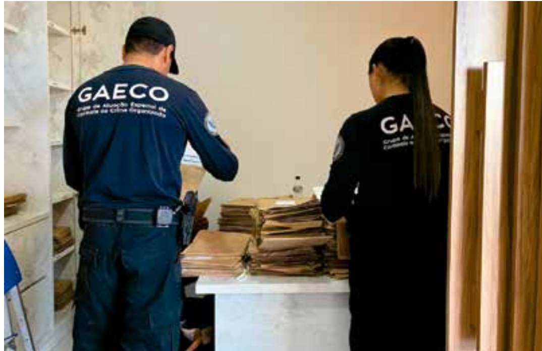
Ao todo, estão sendo cumpridos nove mandados de busca e apreensão nos municípios de Baixo Guandu (ES) e Aimorés (MG).

Ao todo, estão sendo cumpridos nove mandados de busca e apreensão nos municípios de Baixo Guandu (ES) e Aimorés (MG). Nesta