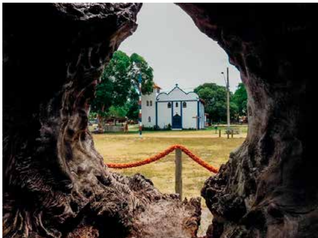
Dados apresentados demonstram que o consignado está chegando no público inicialmente previsto e que necessitava do crédito.

Com uma programação diversificada, a Festa Internacional da Palavra vai contar com bate-papos, oficinas, lançamentos de livros, performances artísticas, shows,