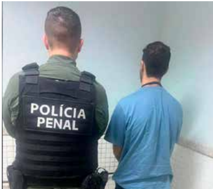
Professor preso pela Polícia Penal confessou que participava de esquema de entrega de cartas de detentos

E era nas aulas que tudo acontecia: o professor confessou aos policiais penais que os detentos digitavam as cartas, ele pegava os arquivos em um pen drive e depois entregava as mensagens para os familiares dos presos. "Identificamos inicialmente em torno de umas seis cartas. É um documento no word, no cabeçalho tem a