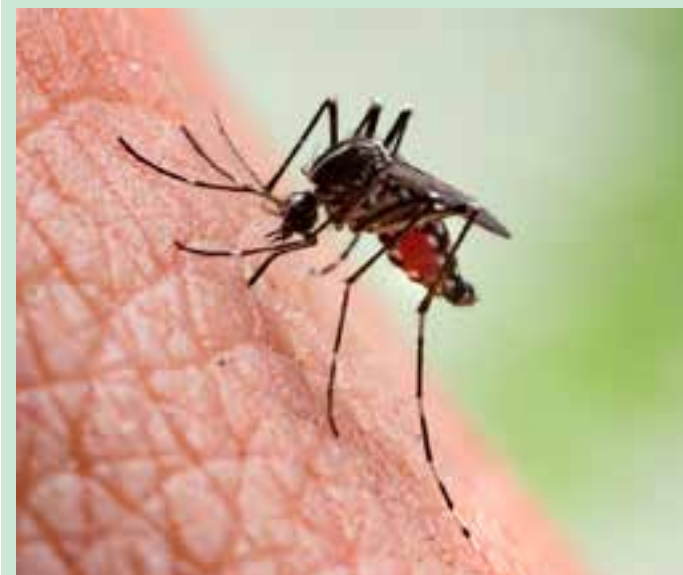
Durante o evento, o prefeito municipal, secretários e outras autoridades estiveram presentes, reforçando, junto ao Legislativo, o compromisso com a valorização institucional da Guarda.

A Secretaria de Saúde orienta, que a população faça imediatamente a limpeza dentro de suas casas e quintais para eliminar os focos. Proprietários de terrenos baldios devem ficar atentos quanto à realização de limpeza com frequência dos seus lotes. Dada a gravidade da situação, penalidades – como advertência e multas, devem começar a ser aplicadas.