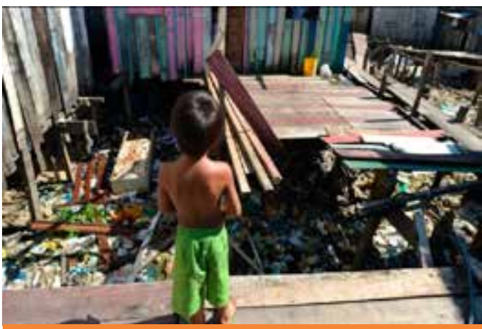
Dados de um estudo elaborado pelas Coordenações de Estatística e de Estudos Sociais do Instituto Jones dos Santos Neves (IJSN), divulgados nesta sexta-feira (9), mostram que o Estado fechou o ano passado com um índice de 1,7%, enquanto que em 2023, foi de 2,7%.

O estudo também mostra uma melhora nacional no Índice de Gini, um indicador que mede a desigualdade de renda. Segundo o levantamento, esse número saiu de 0,518 em 2023 para 0,506 em 2024. A renda média mensal real dos brasileiros com rendimento também apresentou crescimento em relação ao ano anterior, e saiu de R$ 2,8 mil para R$ 3 mil no mesmo período.