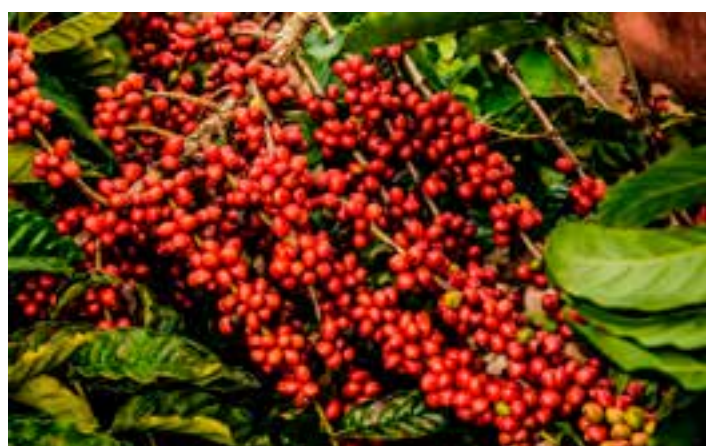
A Abertura da Colheita do Café Conilon no Espírito Santo em 2025 será, mais uma vez em Jaguaré.