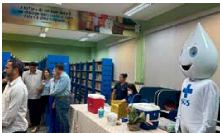
No Espírito Santo, 4.687 mil doses foram aplicadas até a última quarta-feira (30), por meio da nova estratégia definida pelo Ministério da Saúde, entre os dias 14 e 30 de abril, com a Semana de Mobilização.

A Estratégia de Vacinação nas Escolas visa fortalecer o vínculo entre a saúde e a educação no desenvolvimento de ações de vacinação nas escolas de Educação Infantil, de Ensino Fundamental e Médio da rede pública, tanto estadual, quanto municipal. As ações buscam alcançar crianças e adolescentes menores de 15 anos não vacinados, a fim de atualizar o esquema vacinal para, assim, reduzir o risco de adoecimento por doenças imunopreveníveis; ampliar a co-