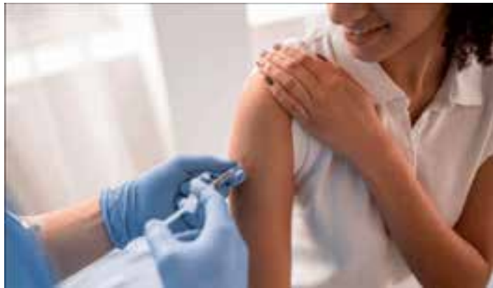
A ação acontece concomitante em diferentes partes do País.

VITÓRIA – Municípios capixabas realizam, neste sábado (10), o dia “D” de mobilização de vacinação contra a gripe. O dia “D” de mobilização é uma estratégia nacional que visa aumentar a adesão dos grupos prioritários à vacinação da Influenza e, consequentemente, ampliar as taxas de cobertura vacinal dos grupos que têm meta de cobertura de 90%. A ação acontece concomitante em diferentes partes do País.