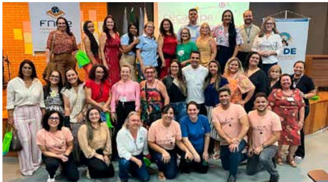
O evento reuniu gestores/as escolares, representantes de caixas escolares e profissionais da educação básica de 18 municípios do Espírito Santo em suas duas turmas.

A programação dos dois dias contou com mesas institucionais e dialogadas, nas