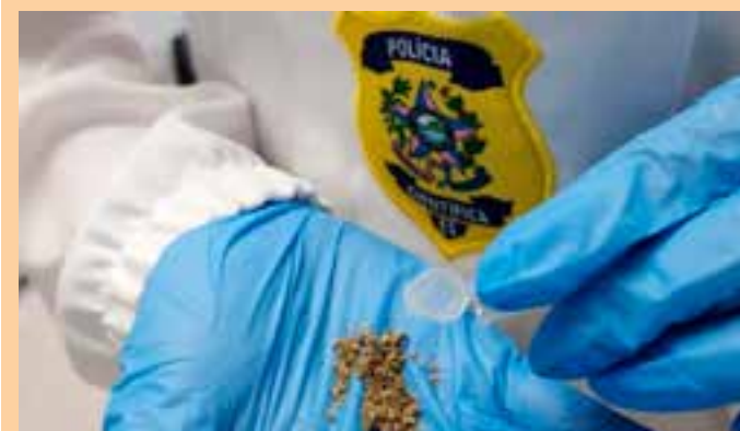
O entorpecente imita os efeitos da maconha, mas os sintomas são muito mais potentes e acentuados do que os da cannabis.

“Há também relatos de rabdomiólise, degradação das fibras musculares, além de danos renais, hepatite, e, em alguns casos, fatalidades advindas do uso dessas drogas. Por serem aplicados sobre material vegetal, os canabinóides sintéticos podem ser confundidos com a maconha tradicional, levando os usuários a consumirem doses perigosas sem saber”, informou.