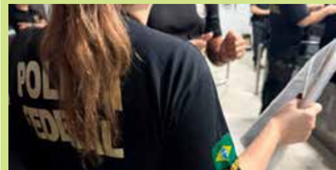
Um celular e um computador foram apreendidos na casa do investigado.

O suspeito poderá responder pelo crime previsto no art. 241-B da Lei nº 8.069/1990 (Estatuto da Criança e do Adolescente), com penas de quatro anos de reclusão