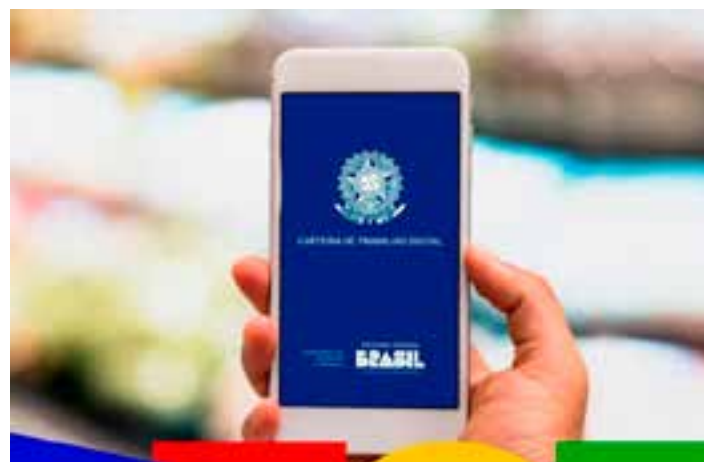
No primeiro trimestre de 2025, estado acumula saldo de 8,6 mil postos formais. Em todo o país foram abertas 654,5 mil vagas nos três primeiros meses de 2025.

da, aparecem os municípios de Serra (912), Cariacica (287), Linhares (256) e Anchieta (142).