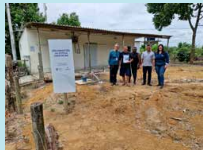
Poço vai abastecer moradores com água potável e fornecer água para a Casa do Mel.