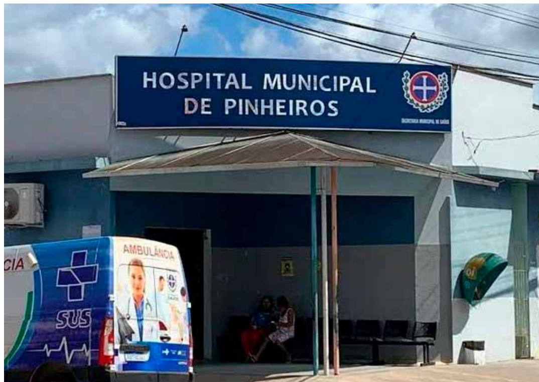
A profissional de 26 anos foi desligada do Hospital Municipal de Pinheiros devido a desdobramentos do atendimento a uma idosa de 63 anos, que chegou na unidade, com sinais de um AVC.

A filha da idosa, que a acompanhava no momento do atendimento, relatou à polícia que a mãe havia so-