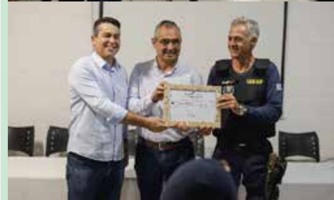
Durante o evento, o prefeito municipal, secretários e outras autoridades estiveram presentes, reforçando, junto ao Legislativo, o compromisso com a valorização institucional da Guarda.