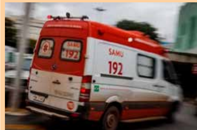
Polícia Civil informou que as circunstâncias do fato serão apuradas pela Delegacia de Polícia de Baixo Guandu.

Procurada pela reportagem, a Polícia Civil informou que as circunstâncias do fato serão apuradas pela Delegacia de Polícia de Baixo Guandu. O corpo da vítima foi encaminhado à Seção Regional de Medicina Legal (SML), da Polícia Científica, em Colatina, para ser necropsiado e, em seguida, liberados para os familiares.