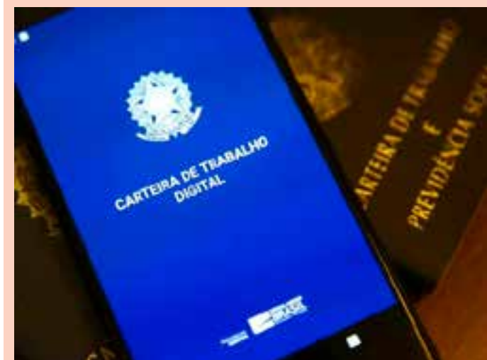
Em março, 7,7 milhões de brasileiros estavam desempregados, uma queda de 10,5% sobre o mesmo mês do ano passado.

Isso permitiu que a massa de rendimento real, em março, totalizasse 345 bilhões de reais. Segundo o IBGE, o montante permaneceu estável em relação a dezembro, mas cresceu 6,6% sobre um ano atrás. A taxa de informalidade também melhorou, ao terminar março em 38%, ante 38,6% em dezembro e 38,9% no mesmo mês do ano passado.