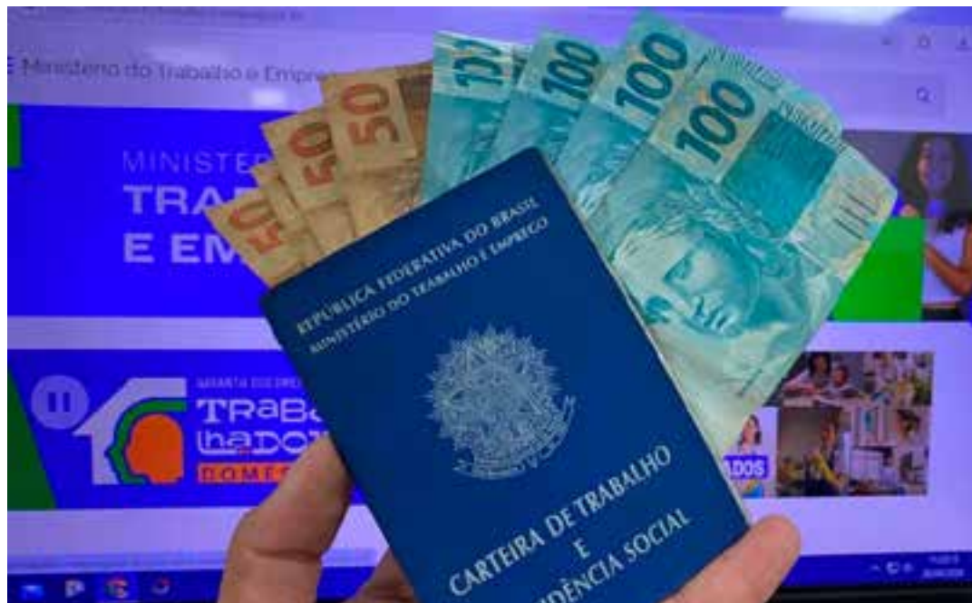
Dados apresentados demonstram que o consignado está chegando no público inicialmente previsto e que necessitava do crédito.

Além disso, o ministro lembrou que, até o último dia 25, o consignado só podia