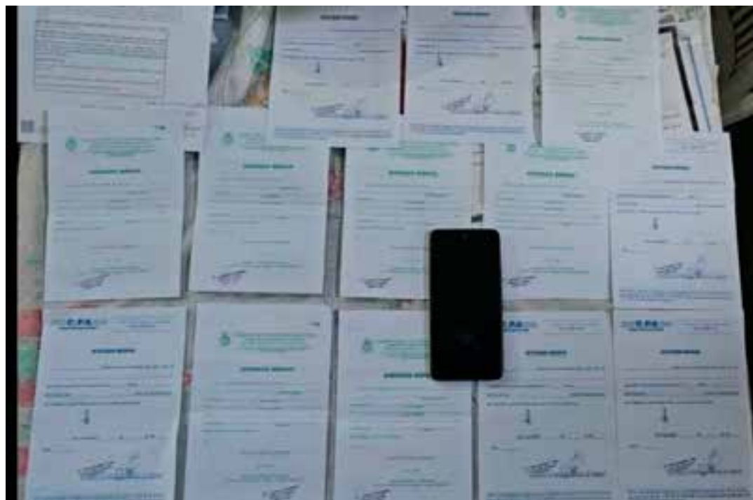
Um esquema estruturado de fraudes de documentos, envolvendo mais de 30 pessoas, entre intermediários e falsificadores está na mira da Polícia Civil no Espírito Santo.

A rede atuava em quatro cidades da Grande Vitória: Vitória, Vila Velha, Serra e Cariacica. A documentação falsa era usada tanto para acessar cargos públicos quanto para vagas em em-