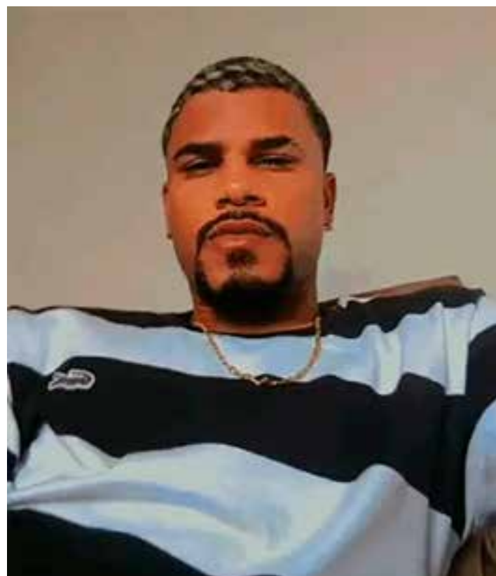
O rapaz foi atingido por disparos de arma de fogo enquanto assistia a uma partida de futebol ao lado da companheira.

Até o momento, nenhum suspeito foi detido. A motivação do crime ainda não foi esclarecida, e as buscas pelos autores continuam.