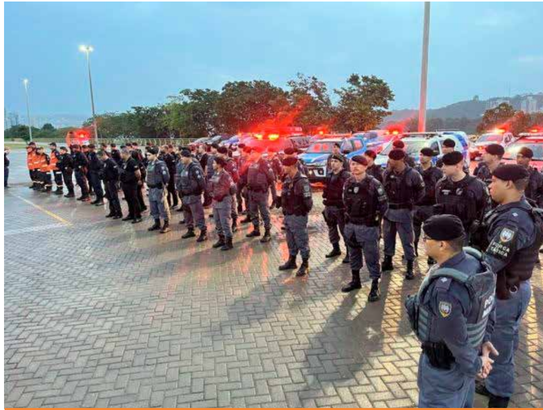
O número representa uma redução de 21% com relação a 2024, que registrou 320 casos e era, até então, o melhor resultado desde 1996.

“Seria impossível manter esta curva de redução por tanto tempo sem a atenção que o nosso governador dedica à área de Segurança Pública. É ele quem conduz pessoalmente este trabalho e o resultado é este que vemos hoje: capixabas mais seguros. Hoje temos uma polícia tecnológica, com recursos