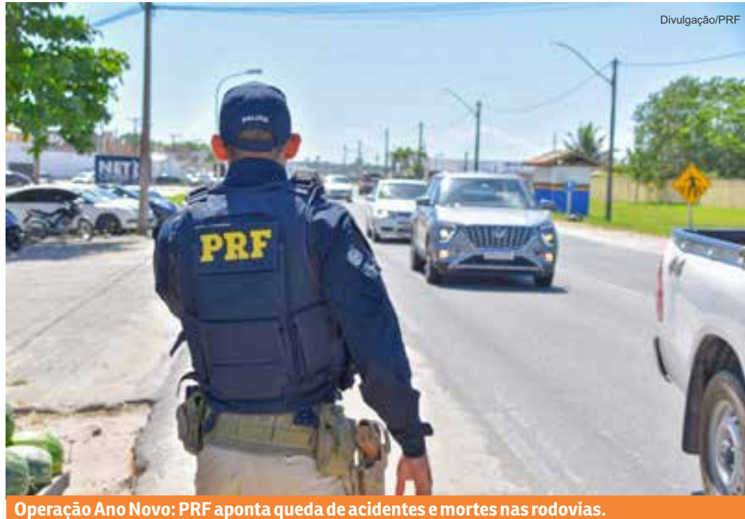
Operação Ano Novo: PRF aponta queda de acidentes e mortes nas rodovias.

A operação teve como foco combater a embriaguez ao volante nas rodovias federais. A PRF registrou 1.577 infrações relacionadas à intoxicação por álcool, sendo 212 por constatação de que os condutores consumiram bebidas alcoólicas antes de dirigir e 1.365 por recusa a se fazer o teste do etí-