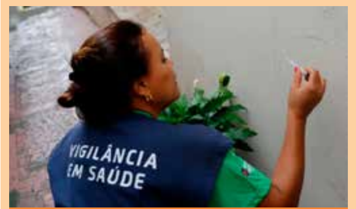
Dados são nacionais e referem-se ao período até 28 de dezembro.