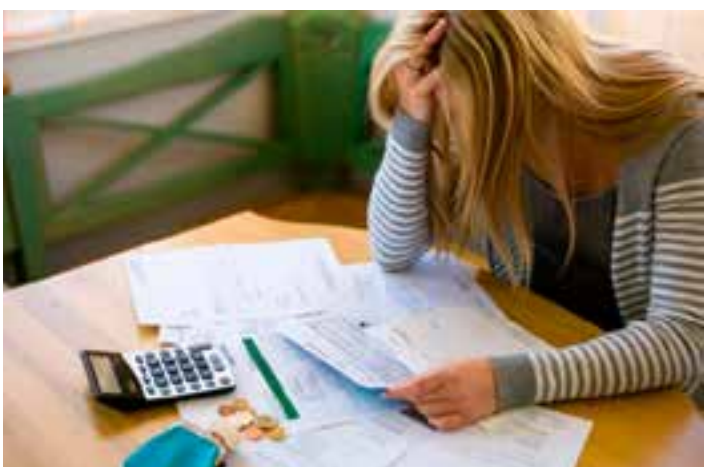
Dados são referentes a outubro e registram a segunda maior marca de 2024, perdendo apenas para o mês de abril.