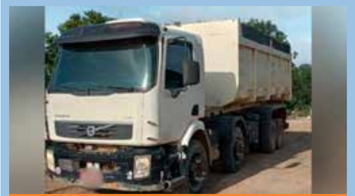
Bandidos armados ameaçaram e agrediram as vítimas, durante o assalto na zona rural do município no Noroeste do Estado.