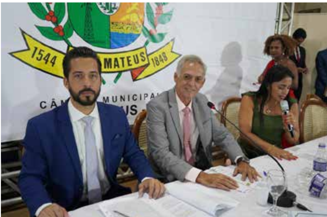
O evento, realizado no Sesc do bairro Ideal, foi permeado pela mensagem de “união”, destacada em todos os discursos, desde a abertura pelo arcebispo Dom Paulo Bosi.

Procurada, a Polícia Civil informou que o caso seguirá sob investigação da Delegacia Especializada de Homicídios e Proteção à Pessoa (DHPP) de São Mateus, e que até o momento, nenhum suspeito foi detido. A corporação acrescentou que “informações podem ser compartilhadas de forma sigilosa por meio do Disque-denúncia (181), que é uma linha de contato gratuita, disponível em todos os municípios do Estado. As informações passadas pela comunidade podem ser cruciais para o avanço das investigações”.