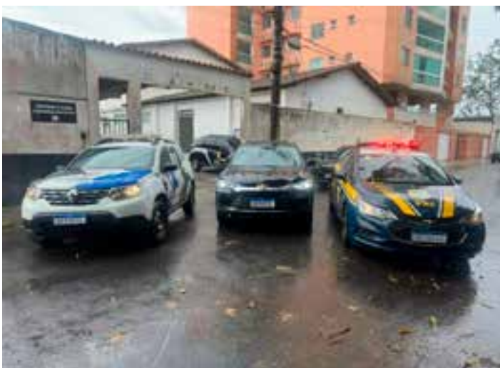
Segundo a Polícia Civil, o casal usou os cartões bancários da vítima para fazer compras e depois a matou a facadas em Marataízes.

Os detidos foram encaminhados à Delegacia de Plantão Regional de Alegre para os procedimentos legais e, posteriormente, transferidos ao sistema prisional, onde permanecerão à disposição da Justiça enquanto as investigações prosseguem.