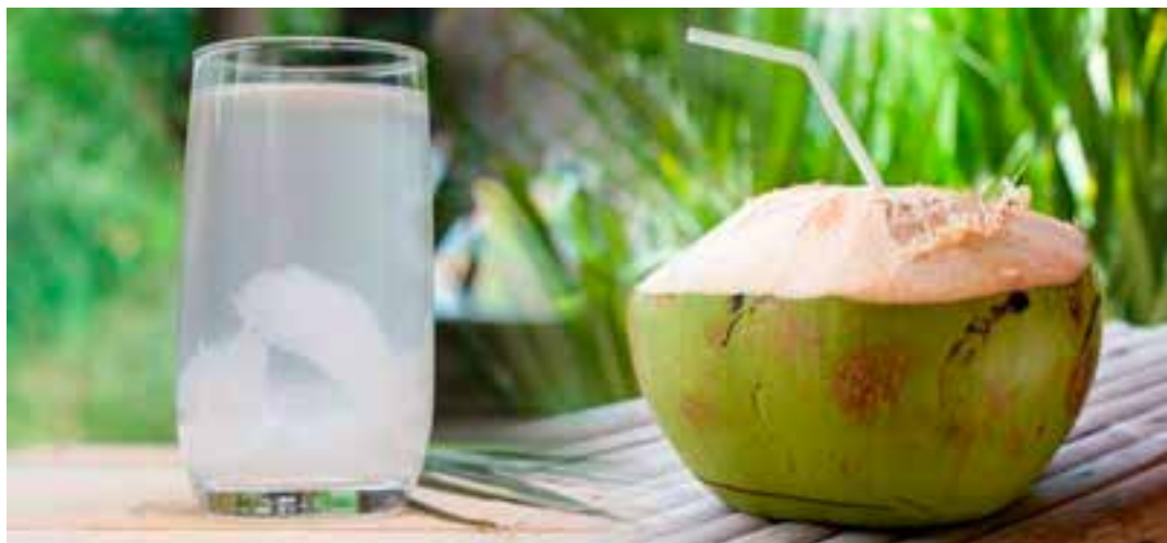
Conheça os benefícios da água de coco para a saúde e saiba como incluí-la no seu dia a dia para hidratação e equilíbrio nutricional.

– Vitaminas do Complexo B e Vitamina C: importantes para o combate ao estresse oxidativo e para a manuten-