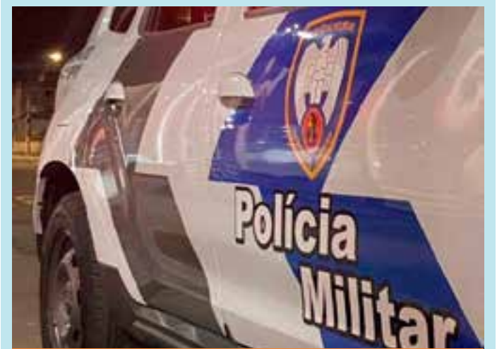
Vítima não foi identificada, e caso será investigado pela Delegacia Especializada de Homicídios e Proteção à Pessoa (DHPP) do município.

Programa Nossa Bolsa 2025 Edital Fapes 18/2024 – Nossa Bolsa 2025: clique aqui e acesse o edital Inscrições daté 17/01, por meio do site: online.nossabolsa.es.gov.br/candidato Dúvidas? E-mail: programa-nossabolsa@fapes.es.gov.br ou no WhatsApp (27) 99824-6168 (respostas apenas em dias úteis no período de 09 às 18 horas)