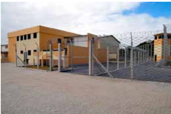
As vagas fazem parte do programa Moderniza-ES que visa a construção de novos presídios no Espírito Santo. Veja como se inscrever

Os interessados pelas vagas ofertadas podem buscar mais informações pelo e-mail: licitacao2.moderniza@sejus.es.gov.br . O contrato dos consultores tem o período de 12 meses, podendo ser prorrogado.