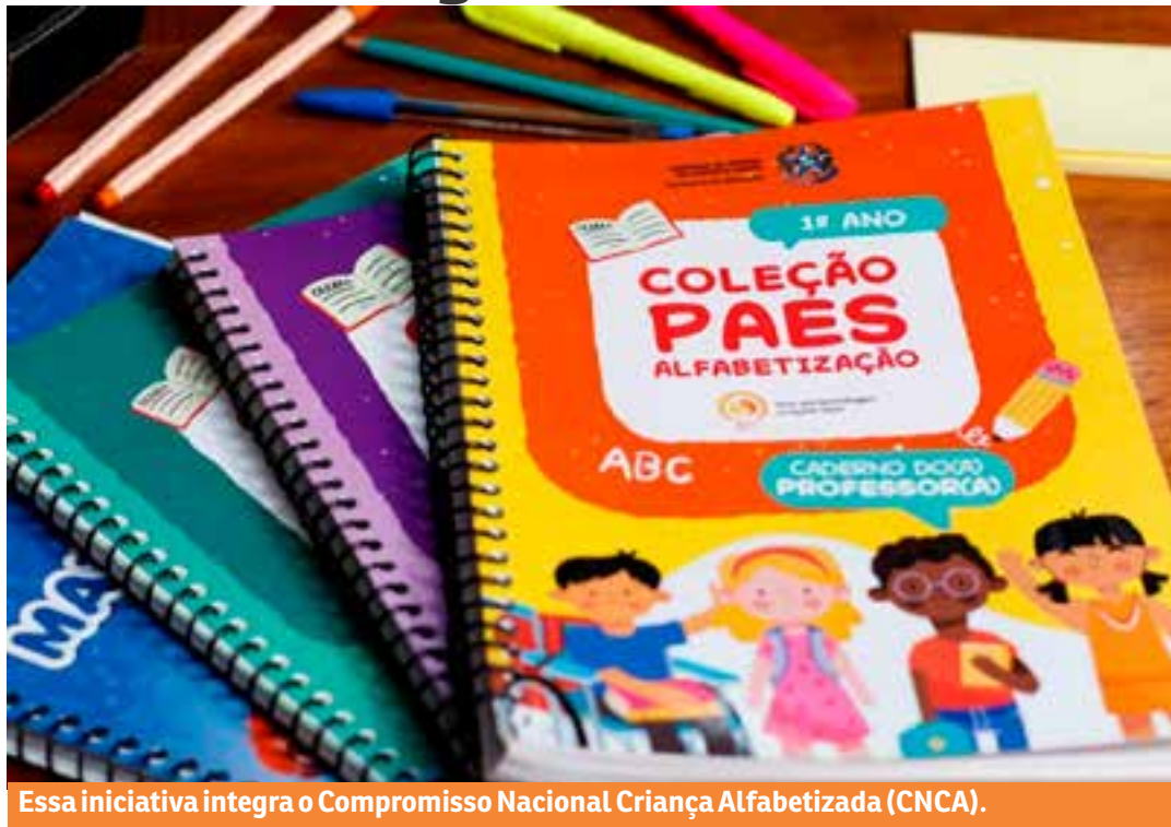
Essa iniciativa integra o Compromisso Nacional Criança Alfabetizada (CNCA).

O selo, que foi dividido nas categorias bronze, prata e ouro, é um reconhecimento simbólico concedido às gestões municipais e estaduais. A cerimônia de entrega do emblema acontecerá em