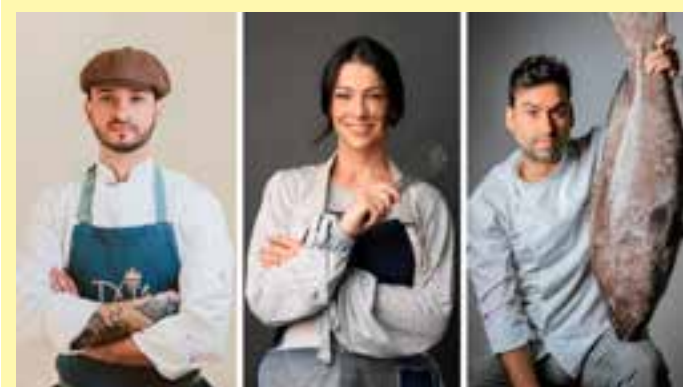
Festival Gastronômico & Cultural de São Mateus chega à segunda edição com apresentações culturais, área kids e balonismo. Entrada é gratuita.