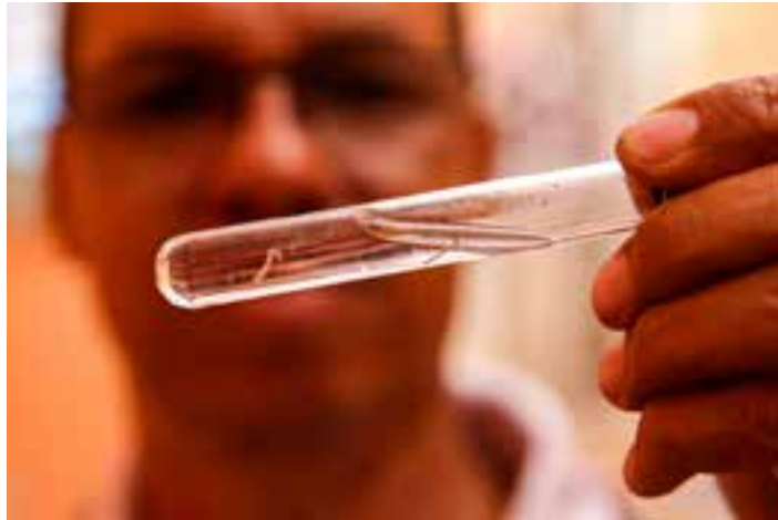
Segundo dados do Painel de Monitoramento da Dengue, da Secretaria Estadual de Saúde, 41 mortes pela doença foram confirmadas este ano no Espírito Santo.

Informações divulgadas pelo Ministério da Saúde