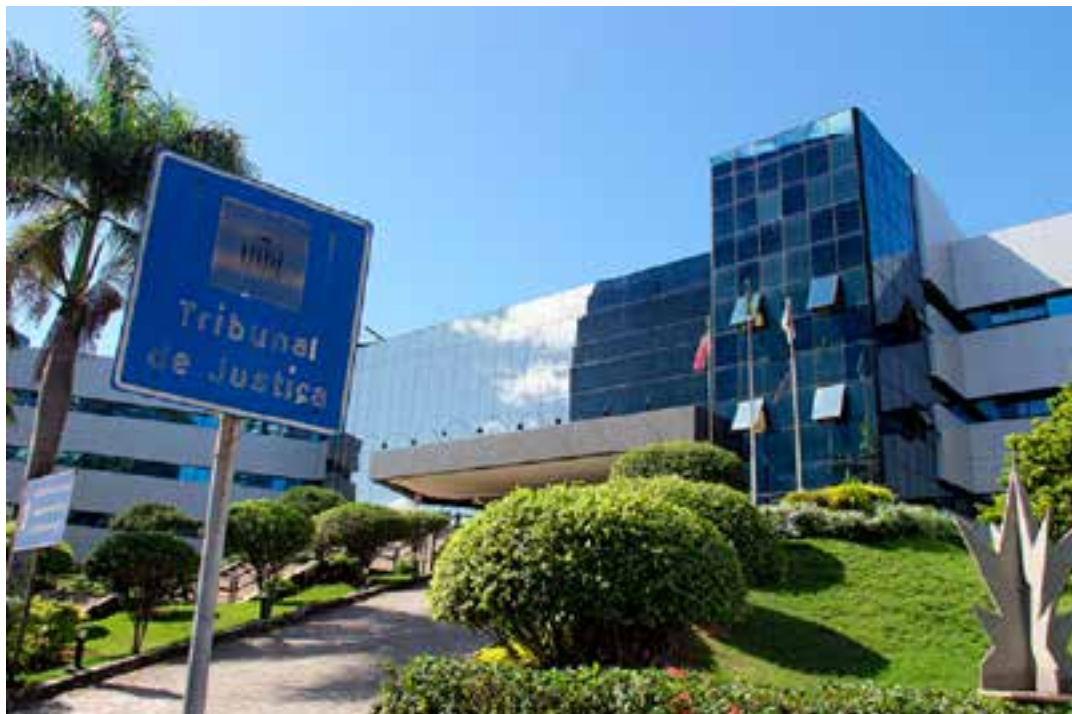
TJES aprovou resolução que garante quinquênio a quem ingressou na magistratura até 2006.

No caso do Espírito Santo, apesar de o texto da resolução informar que ela foi aprovada na Sessão Administrativa Ordinária do último dia 28 de novembro, o assunto não foi incluído na pauta do dia disponibilizada no site do próprio