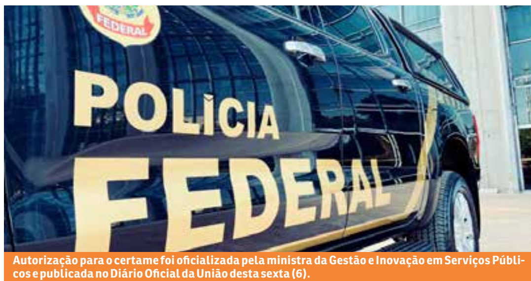
Autorização para o certame foi oficializada pela ministra da Gestão e Inovação em Serviços Públicos e publicada no Diário Oficial da União desta sexta (6).

Nutricionista: 1 vaga Estatístico: 4 vagas Administrador: 6 vagas Técnico em comunicação social: 3 vagas Técnico em assuntos educacionais: 10 vagas