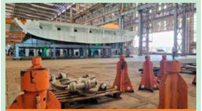
Há vagas para analista de recursos humanos, marinho de máquinas, encanador industrial, entre outras oportunidades.

Educação (MEC) divulgou a taxa de alfabetização dos estados brasileiros. O Espírito Santo figurou entre os três estados com as maiores taxas de alfabetização. O resultado confirmou que 68% dos alunos da rede pública do Espírito Santo estavam plenamente alfabetizados até o 2º ano do Ensino Fundamental, indicador acima da média nacional que foi de 56%. Esses dados e o Selo Ouro reforçam que as ações planejadas e realizadas estão promovendo, de forma eficaz, a alfabetização das crianças capixabas.