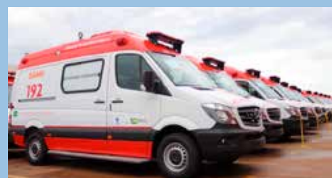
Segundo os profissionais, os vencimentos estavam em atraso há dois meses; atividades foram paralisadas desde o plantão de terça-feira (26) e continuam sem previsão de retorno.

Até o fechamento desta reportagem, o TJES não respondeu aos questionamentos