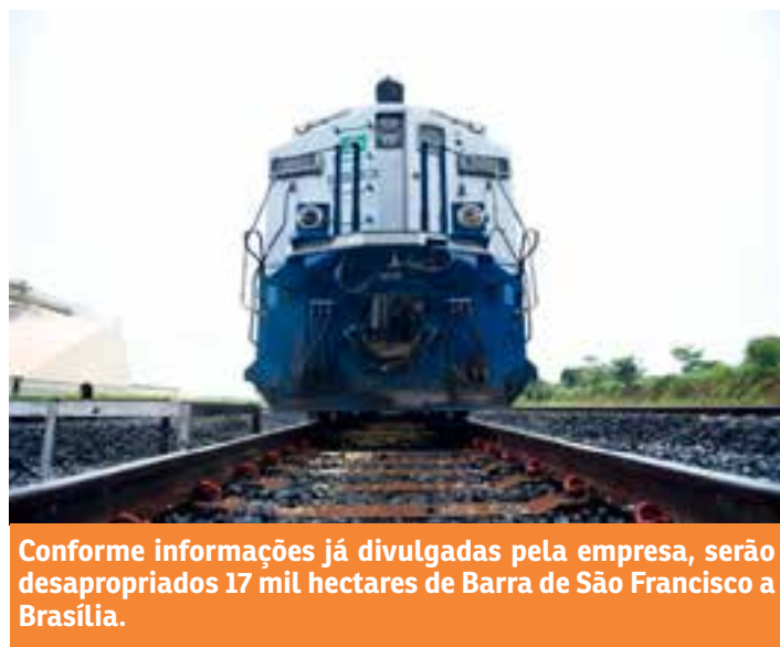
Conforme informações já divulgadas pela empresa, serão desapropriados 17 mil hectares de Barra de São Francisco a Brasília.

A expectativa é de que a empresa inicie em janeiro de 2025 as desapropriações. Mais três ferrovias da Petro-