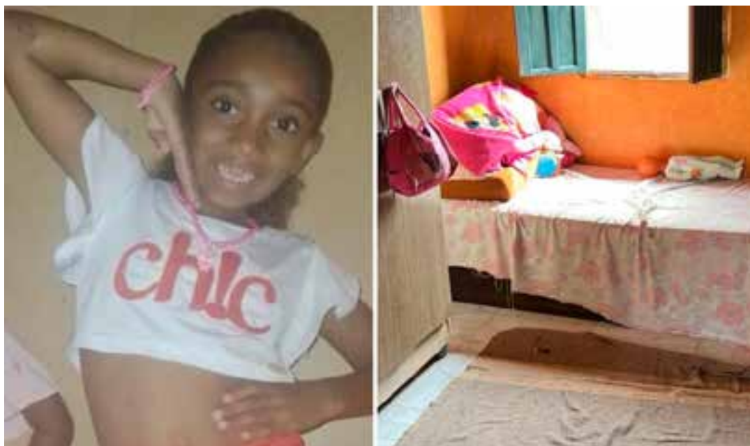
Caso aconteceu em São Mateus, no Norte do estado. Criança estava em casa quando teve contato com o animal.

A reportagem solicitou mais informações sobre o caso à Polícia Civil e também à Secretaria de Estado da Justiça, mas ainda não obteve retorno.