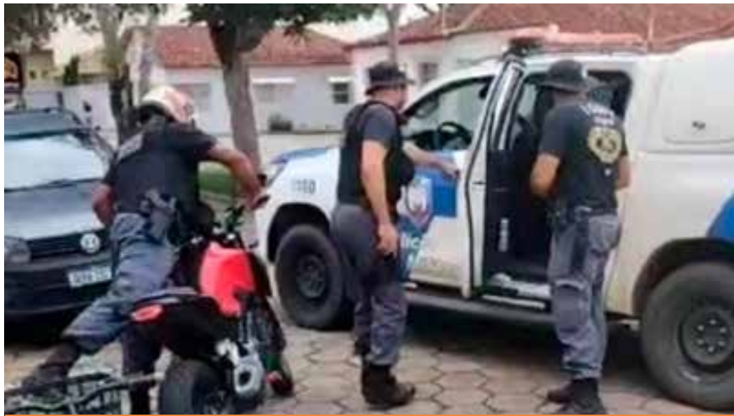
O mandado de prisão preventiva foi expedido e a prisão realizada no Centro da cidade.

Diferentemente da versão apresentada pela PM sobre o local da prisão, o Hospital Ma-