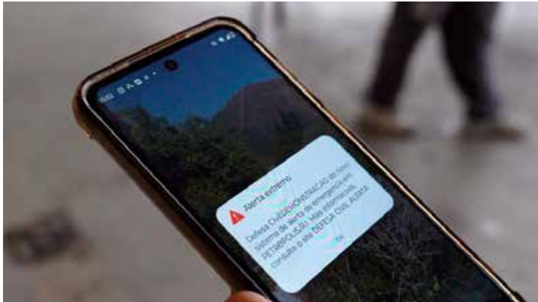
Os alertas são enviados por meio da tecnologia cell broadcast, um método de envio de mensagens de forma simultânea, para vários usuários de telefones móveis em uma área definida.

A mensagem chegará para todos os aparelhos de telefonia móvel conectados às