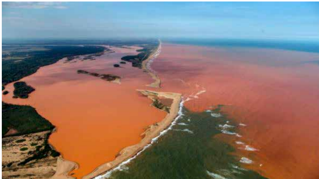
Volume de chuva pode passar de 80 milímetros em algumas áreas do Estado, como na Grande Vitória e no litoral norte.

“A Semana Estadual de Ciência, Tecnologia e Inovação é uma oportunidade para apresentar diversas ini-