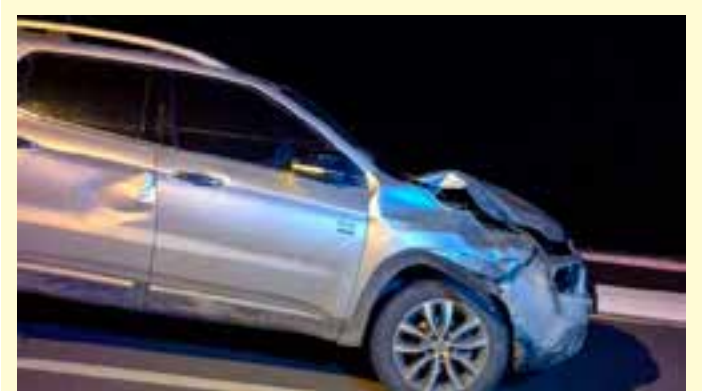
Vítima foi socorrida pelo Samu/192 e levada ao Hospital Roberto Silveiras.

O corpo foi encaminhado para a Seção Regional de Medicina Legal (SML), da Polícia Científica, em Linhares, para ser necropsiado e, posteriormente, liberado para os familiares.