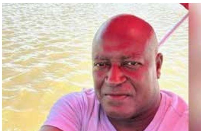
Em fase de licenciamento ambiental, projeto da Petrocity conta, no total, com quatro trechos de estradas de ferro para movimentar cargas gerais e grãos.