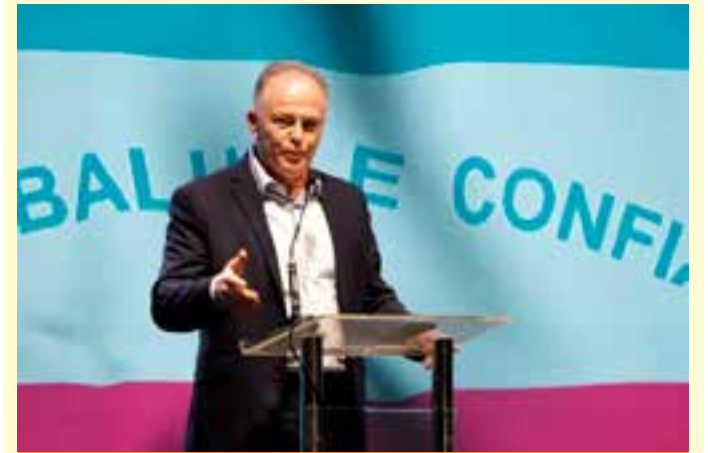
Projeto prevê pagamento de R$ 1 mil para servidores estaduais e R$ 3.800 para servidores da Secretaria de Educação (Sedu).

Antes disso, em novembro, o salário dos servidores foi pago nesta sexta-feira (29), quando também será depositado o 13º salário aos profissionais que fazem aniversário neste mês, com exceção dos celetistas e dos que trabalham em regime de Designação Temporária (DT), pois recebem em dezembro, como divulga a Secretaria de Gestão e Recursos Humanos (Seger).