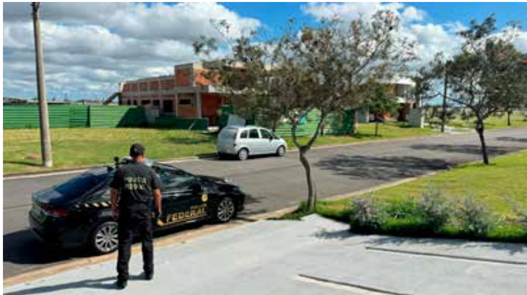
De acordo com a Federal, a investigação é sobre um possível desvio de recursos públicos.