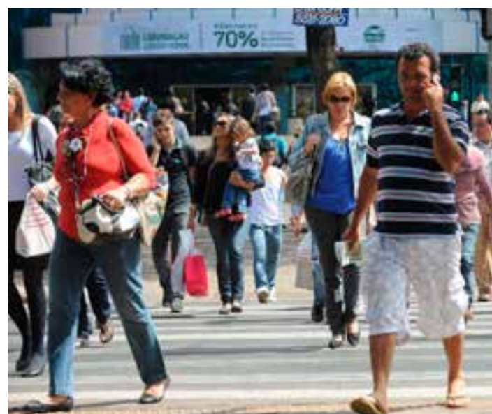
No ano anterior, esperança de vida era de 75,5 anos.

A expectativa de vida é usada para o cálculo do chamado fator previdenciário para o cálculo dos valores relativos às aposentadorias dos trabalhadores que estão sob o Regime Geral de Previdência Social.