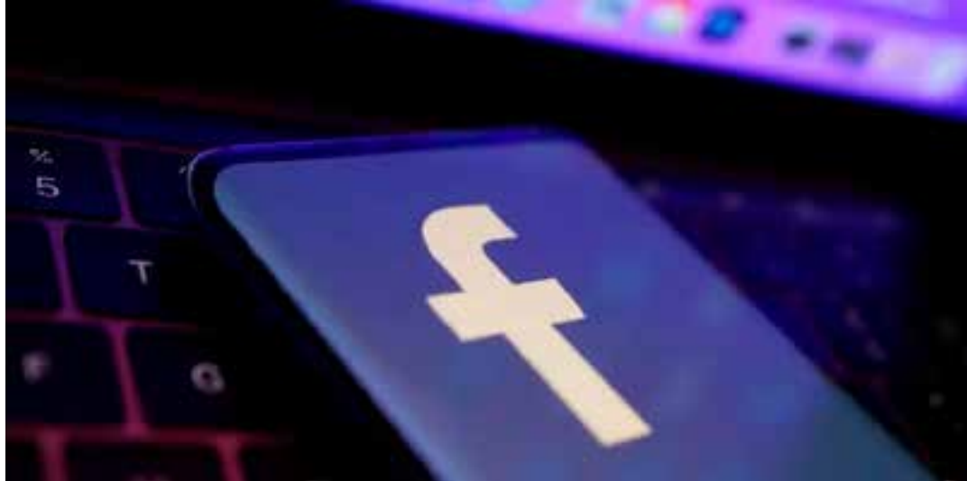
Principal discussão é a constitucionalidade do Marco Civil da Internet.

A principal questão discutida no julgamento é a constitucionalidade do Artigo 19 do Marco Civil da Internet (Lei 12.965/2014), norma que estabeleceu os direitos e deveres para o uso da in-