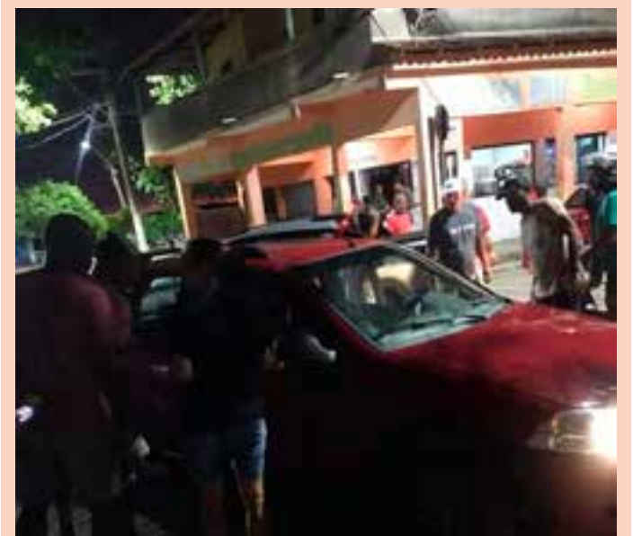
O crime aconteceu na Avenida Pai João, umas das vias movimentadas da cidade.