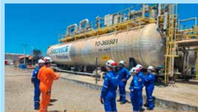
Empresa vive momento decisivo e precisa de dinheiro para manter suas operações, inclusive no Estado, mas é positiva a perspectiva no mercado.