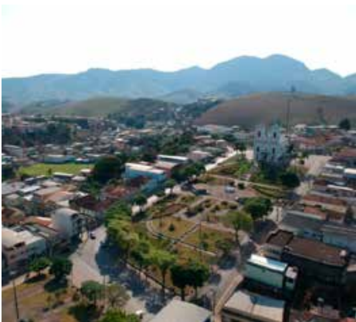
Contra a mulher havia um mandado de prisão preventiva, que foi cumprido no Rio de Janeiro.

Segundo a polícia, a mãe demonstrava evidentes sinais de embriaguez, como perturbação na fala, odor etílico e falta de equilíbrio. A criança se recuperou e está sob a guarda da avó.