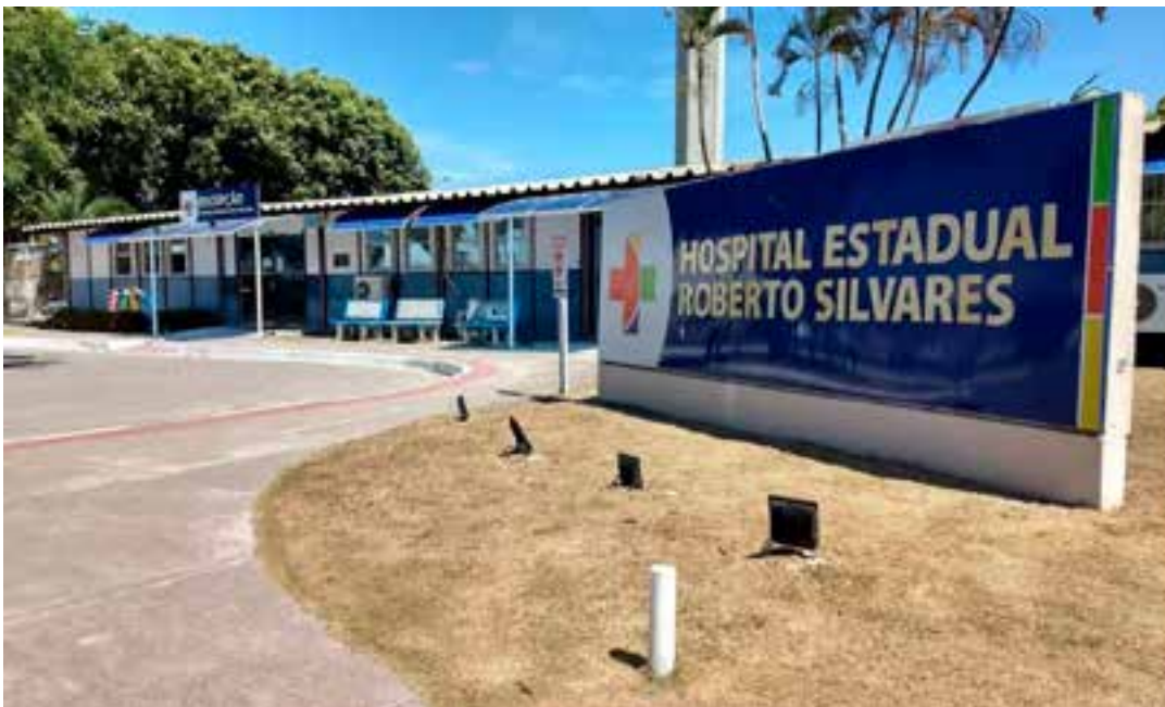
Paciente pegou a arma de um vigilante do local.

A ocorrência foi entregue na 18ª Regional. Em nota, a Polícia Civil informou que ainda estava ouvindo depoimentos e somente após a finalização seria possível repassar outros detalhes.