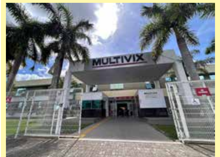
As inscrições estão abertas até 4 de novembro, e a prova será realizada no dia 15 do mesmo mês

A Mostratec está aberta ao público nos dias 22, 23 e 24 de outubro, das 13h30 às 16h30, com entrada franca. A premiação ocorrerá no dia 25 de outubro, às 20h, no Teatro FEEVALE, e a transmissão será feita ao vivo pelo canal oficial da Mostratec no YouTube.