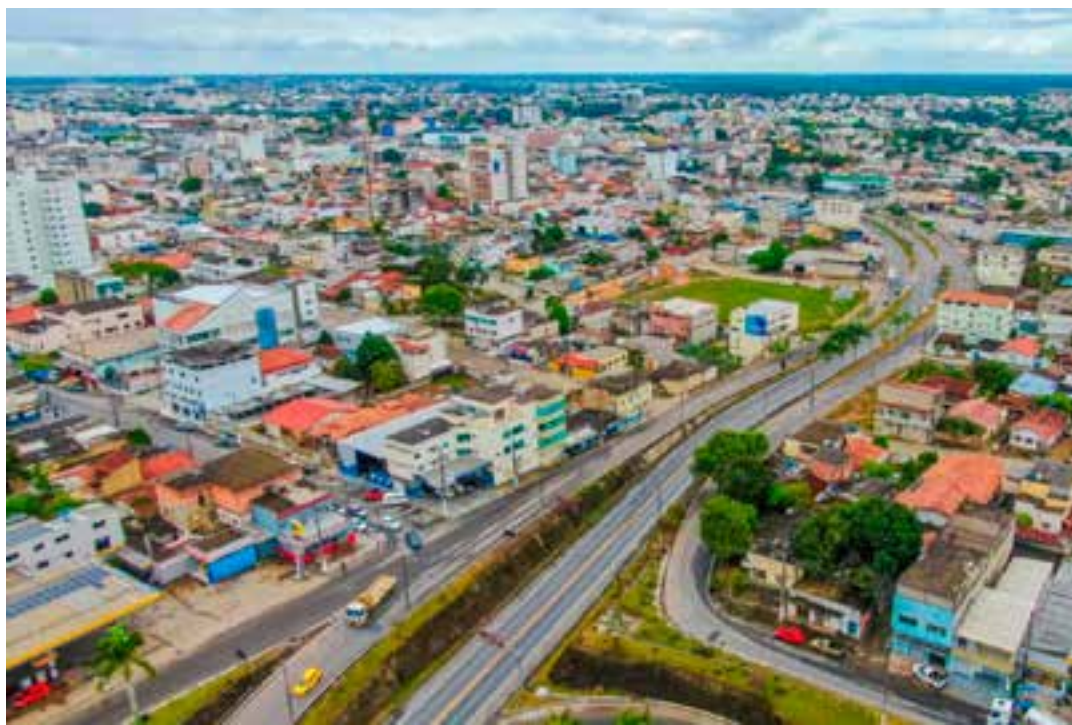
Ele afirma que sofreu golpes de pauladas, socos e pontapés, e disse que os suspeitos ainda tentaram enforcá-lo com uma corda.

A confusão aconteceu em uma fazenda da família, que está em processo judicial. A vítima acionou a Polícia Militar após conseguir escapar das agressões. O homem relatou aos militares que os irmãos chegaram a danificar a moto dele e disse que só conseguiu escapar do local com a ajuda de outras pessoas que estavam próximas. Ele foi encontrado caminhando às margens de uma estrada, apresentando lesões no corpo, mas recusou