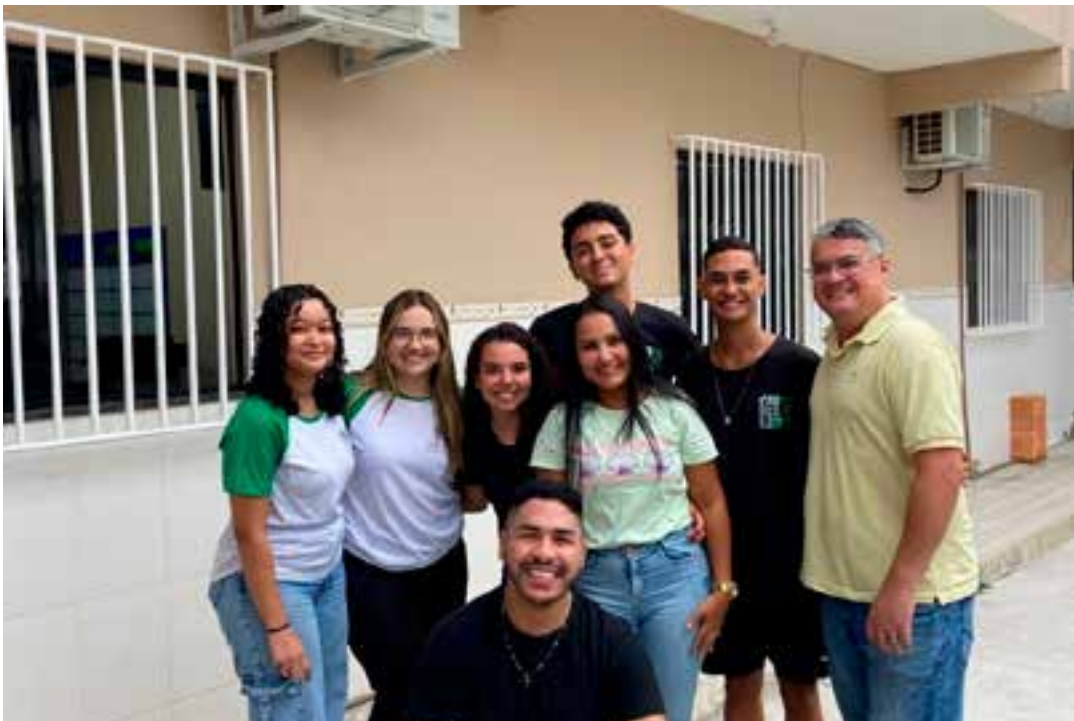
A iniciativa, que propõe o cultivo de hortaliças em um substrato desenvolvido à base desse material, alcançou o 1º lugar na Feira de Ciências, Tecnologias e Humanidades do Vale do Cricaré (FECRI).

O professor reforçou ainda a importância da iniciativa: “A pedagogia de projetos nos ambientes escolares permite ao estudante uma visão macro da problemática e uma gama de variáveis que podem ser estudadas nesse contexto. Portanto, o projeto demonstrou que, com práticas sustentáveis e a promoção do letramento científico, os alunos podem fazer a diferença na comunidade e em suas trajetórias acadêmicas e profissionais”.