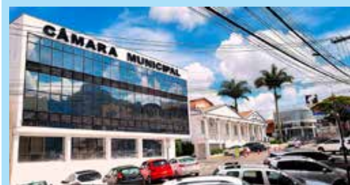
Presidente da Câmara comemora aplicação de provas e futuro legado para o Poder Legislativo Municipal.

Os municípios aderentes receberão recurso para apoio ao desenvolvimento de iniciativas e projetos de competência municipal e de medidas em substituição às ações dos Programas da Fundação Renova, além R$ 1,43 bilhão para investimento em políticas municipais na gestão de meio ambiente, na geração de emprego e renda, na gestão de fomento à agropecuária, na gestão de cultura e turismo, no sistema viário, infraestrutura, mobilidade e urbanização, em ações para fortalecimento do serviço público, ações de educação, ações de saúde e ações de saneamento.