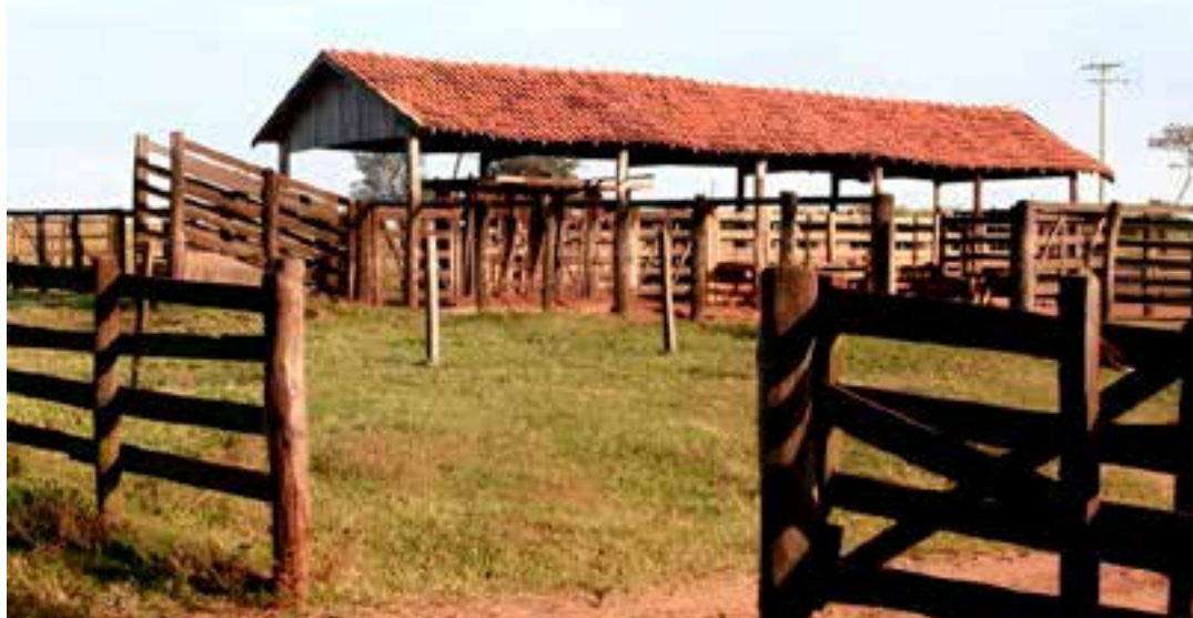
Funcionário disse que na hora em que ele estava ordenhando uma vaca, percebeu que um boi prensou a vítima contra uma superfície, e deu cabeçadas nela.

“O procedimento foi encaminhado para a Delegacia de Polícia de Domingos Martins, que aguarda o resultado dos exames. Assim que os laudos forem anexados, o inquérito será finalizado e encaminhado ao Poder Judiciário”, informou a Polícia Civil.