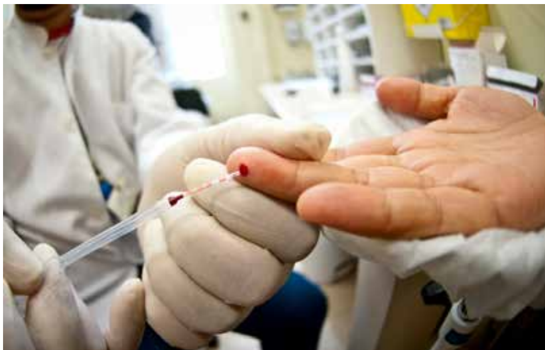
ES teve a segunda maior taxa de incidência em 2023 e 7,2 mil casos até agosto deste ano.

O Estado também registrou um aumento de 24,4% na incidência de sífilis congênita, destacando-se como