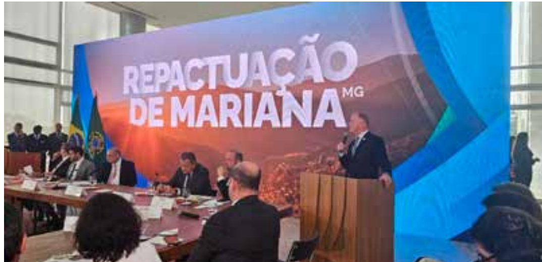
O governador do Espírito Santo, Renato Casagrande, conversou com o ministro da Casa Civil, Rui Costa, sobre o tema. Vale, BHP e Samarco vão pagar quase R$ 160 bi.

No Espírito Santo, R$ 450 milhões serão aplicados no Plano de Reestruturação da Gestão da Pesca e Aquicultura; R$ 1 bilhão em ações de resposta a enchentes, desastres