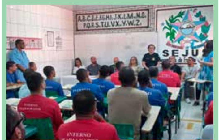
O curso tem carga horária de 180 horas e tem como objetivo desenvolver as capacidades técnicas, sociais, metodológicas e organizativas necessárias para a qualificação profissional na área.

– Nova Venécia – ES 137 entre Santo Antônio do Quinze e Patrimônio da Penha. Extensão: 14km