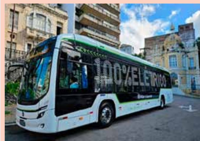
Inaugurada em dezembro de 2014, a Marcopolo é a primeira indústria automobilística a se estabelecer no Espírito Santo. Ônibus irão para Angola.