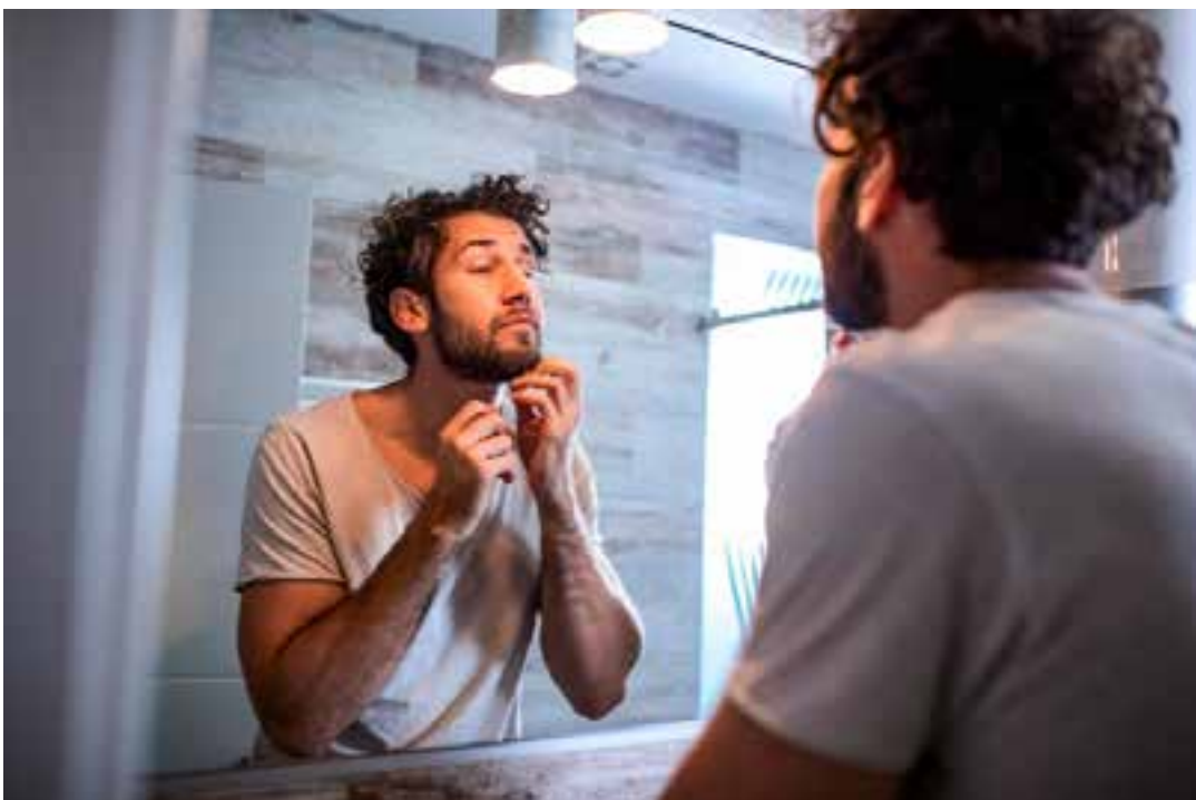
Apesar disso, os homens se sentem mais elegantes e “masculinos” após aparar ou fazer a barba por completo.

“Assim como as mulheres usam maquiagem para realçar suas características, os homens podem usar pelos faciais para influenciar sua atratividade e percepções de personalidade. Entender esses insights pode ajudar os homens a otimizar seu desempenho em relacionamentos”, afirmou Andrews ao Express.