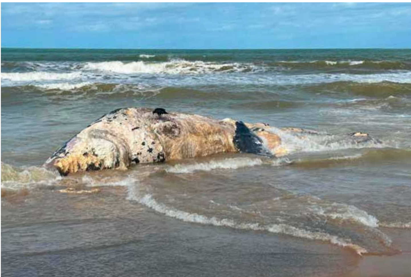
Segundo a veterinária, não foi possível identificar se a jubarte era macho ou fêmea, visto que o animal apresentava mordidas de tubarão, além do estado de decomposição.

De acordo com o Projeto Baleia Jubarte, até o momento, foram registrados 50 encalhes da espécie no litoral brasileiro, sendo 11 no Espírito Santo. No ano mesmo período do ano passado, foram registradas 65 ocorrências de encalhes.