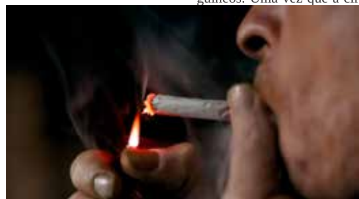
Cirurgião plástico explica como o pré-operatório pode ser um estímulo para largar o vício em cigarro. Estudo mostra redução da dependência.

O levantamento concluiu que a grande maioria dos pacientes aderiu à recomendação médica. Dentro desse grupo, em média 5 anos após a cirurgia, 40% dos pacientes que eram fumantes diários, não fumavam mais todos os dias, e 20% dos pacientes pararam de fumar completamente.