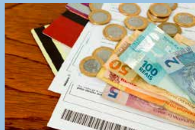
Em maio, o prazo para adesão já havia sido prorrogado e venceria neste sábado (31).

– Banco do Brasil: aplicativo; contato pelo WhatsApp no número (61) 4004 0001; e ligações para a Central de Atendimento do BB pelo número 0800 729 0001.