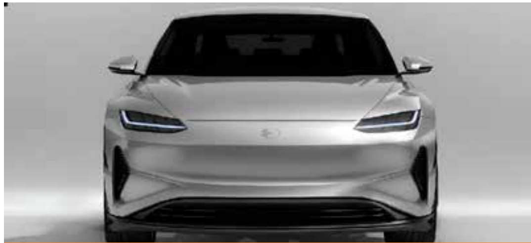
A fábrica vai gerar 1.500 empregos diretos e 3 mil indiretos.

De acordo com informações divulgadas pelo Grupo Petrocity, o traçado da malha ferroviária de mais de 2,1 mil quilômetros (com quatro fer-