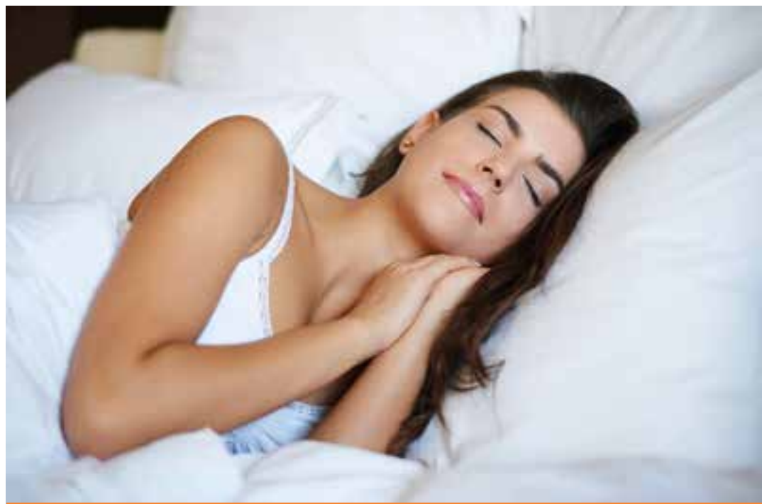
Estudo com mais de 90 mil pessoas mostra que o “sono compensatório” aos finais de semana tem efeito positivo para a saúde do coração.

O grupo de pesquisa de Song analisou dados de 90.903 indivíduos inscritos no projeto UK Biobank – um banco de dados do Reino Unido para pesquisas de saúde – para avaliar a relação entre sono compensado