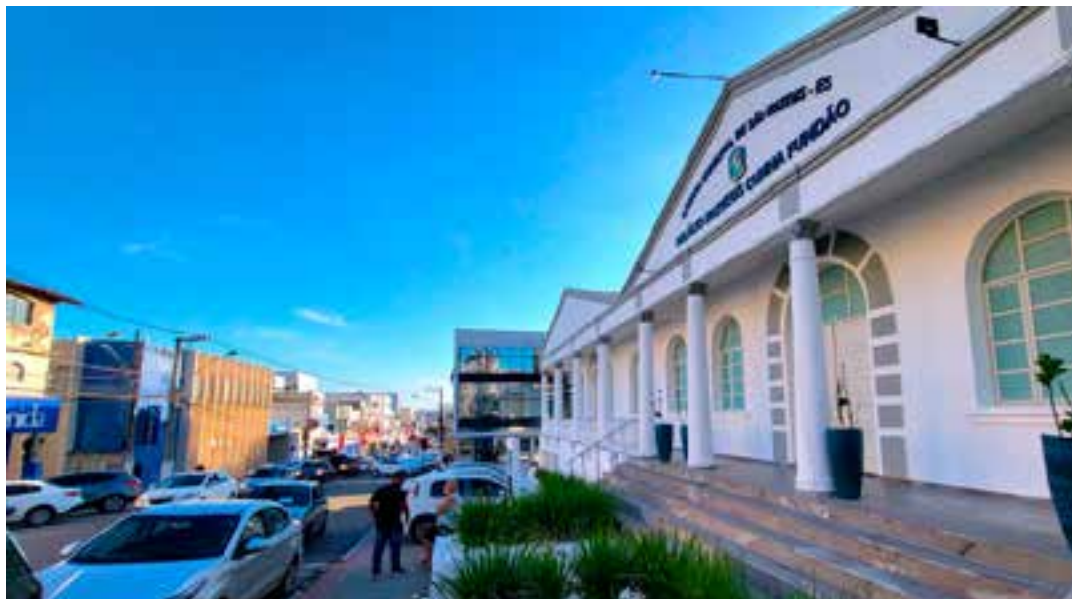
Salários variam de R$ 1.400 a R$ 3.605,12, além de auxílio-alimentação de R$ 500. Os novos servidores vão atuar em jornada de 20 a 30 horas semanais de trabalho.

O candidato hipossuficiente inscrito no Cadastro Único para Programas Sociais do Governo Federal – CadÚnico, membros de família de baixa renda, po-