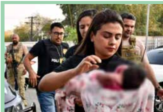
Após entregar a filha, de apenas 20 dias, a mãe se arrependeu e tentou reaver a criança, mas foi ameaçada.

Com a declaração de emergência global, o Ministério da Saúde anunciou que negocia a compra de 25 mil doses da Jynneos junto à Organização Pan-Americana da Saúde (Opas). Desde 2023, quando a Anvisa aprovou o uso provisório do imunizante, o Brasil já recebeu cerca de 47 mil doses do imunizante e aplicou 29 mil.