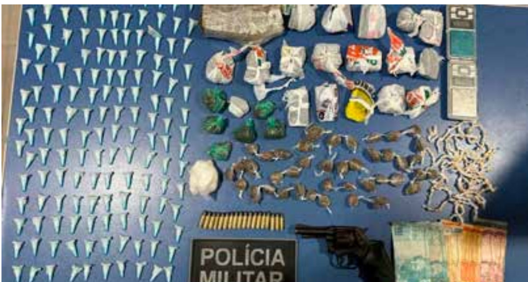
Jovem de 21 anos disse que ela, o marido e o ex-companheiro moram no mesmo imóvel; drogas foram apreendidas na residência e os três suspeitos foram autuados.

Os três foram encaminhados para a Delegacia Regional de São Mateus. Em nota, a Polícia Civil informou que os três suspeitos foram autuados por tráfico de drogas. Além disso, o homem que estava armado recebeu autuação por porte ilegal de arma de fogo de uso permitido. O outro também foi autuado por posse irregular de munição. “Todos foram encaminhados ao sistema prisional”, finalizou a corporação.