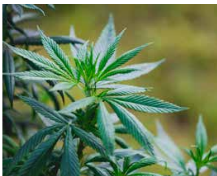
Os ministros da Sexta Turma da Corte decidiram, por unanimidade, extinguir a punibilidade do homem.

Agora, entretanto, há uma distinção entre usuário e traficante. A nova norma também prevê penas alternativas aos consumidores, como prestação de serviços à comunidade, advertência sobre os efeitos das drogas e comparecimento obrigatório a curso educativo.