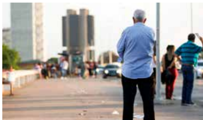
Os dados estão na pesquisa Projeções das Populações, do Instituto Brasileiro de Geografia e Estatística (IBGE), divulgada na manhã desta quinta-feira (22).

Em São Paulo, a virada demora mais um tempo e só deve acontecer em 2037, segundo o IBGE. Os últimos Estados a terem crescimento negativo serão Santa Catari-