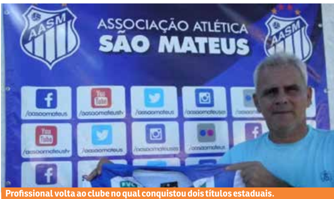
Profissional volta ao clube no qual conquistou dois títulos estaduais.

O São Mateus estreia na Série B no dia 07 de setembro, quando enfrenta o Vila-velhense, no estádio Kleber Andrade, em Cariacica.