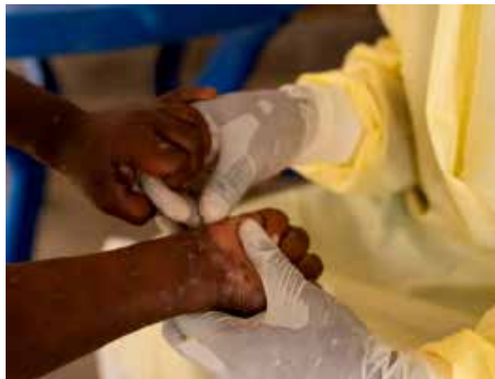
Após dias frios por conta de uma onda de ar polar no litoral capixaba, as temperaturas devem voltar a aumentar no Espírito Santo na próxima semana.

“No momento, a pesquisa está na fase de estudo para o