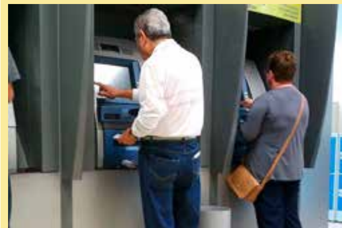
Nesta semana houve a 9ª rodada de negociações entre a categoria e a Fenaban. Conversas seguem ao longo da semana.