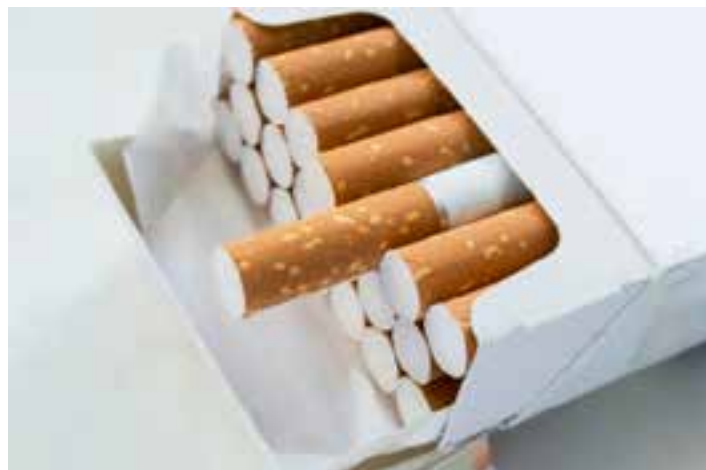
A proposta agora segue para etapa de consulta pública durante os próximos 45 dias.

Por outro lado, as advertências nas laterais das cartelas são menos percebidas pelos consumidores, o que levou a agência a elaborar uma proposta que melhorasse a legibilidade dessa parte