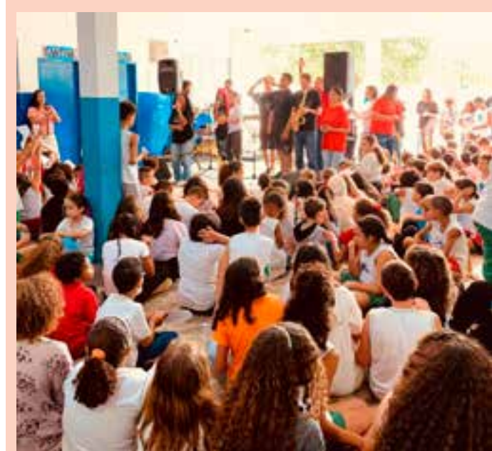
Junto ao concerto, também foi apresentado um espetáculo de dança com alunos cadeirantes da Escola Wallace Castello Dutra.