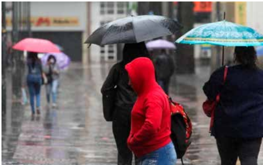
Segundo informações do Incaper, a passagem de uma frente fria muda as condições de tempo no Estado.

Em Vitória, a queda brusca da temperatura ocorre na segunda-feira (26). A previsão para o domingo (25) é de 20°C a 28 °C e