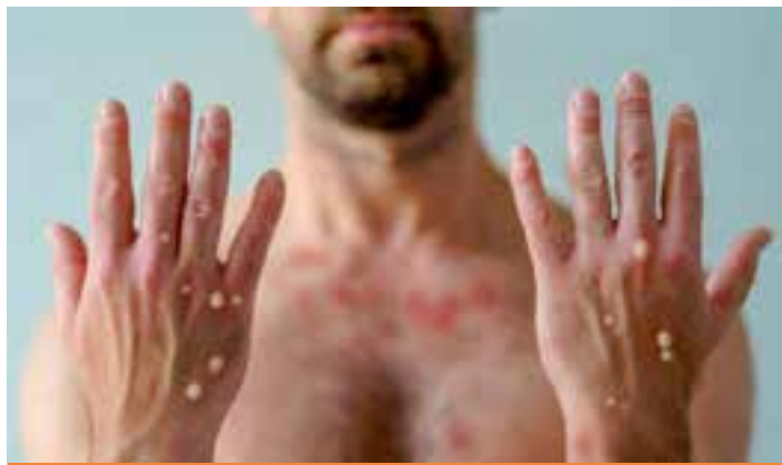
Além das características erupções na pele, dor de cabeça e gânglios inchados, a população deve ficar alerta para sintomas nos olhos.

Embora os sintomas da mpox sejam semelhantes aos da varíola, a doença é geralmente menos grave. Entretanto, este novo clado circulante na região da África, acende um alerta devido a apresentação de sintomas