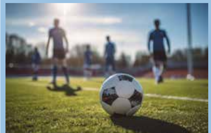
Torneio é realizado pela Suzano e vai reunir equipes de escolas de comunidades rurais do Extremo Norte do Espírito Santo.