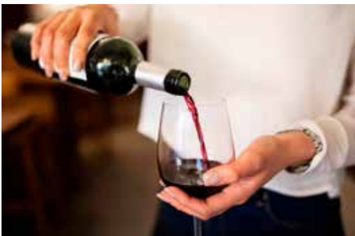
Pesquisa aponta que consumir bebidas alcoólicas faz mal para pessoas com mais de 60 anos, independentemente da quantidade ingerida.

Desde 2023, a Organização Mundial da Saúde (OMS) passou a considerar que não existe quantidade de álcool segura. A OMS alerta que o consumo aumenta o risco de vários tipos de câncer, incluindo câncer de mama, fígado, cabeça e pescoço, esôfago e colorretal.