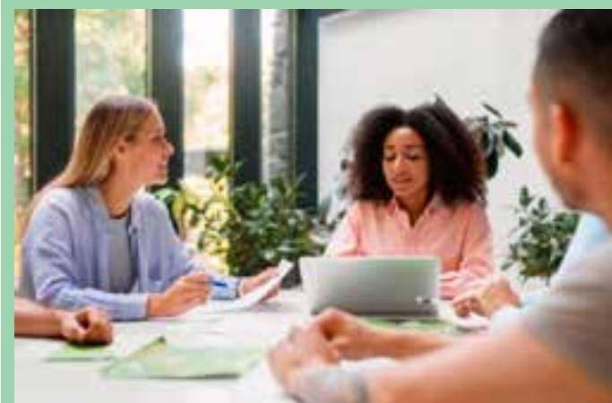
A duração máxima do apoio é de 30 meses e as empresas devem se comprometer a aportar contrapartida de, no mínimo, 20% do valor do projeto.

Vale destacar que empresas de micro, pequeno e médio porte podem participar da chamada, basta ter um produto, serviço ou algo inovador, além de mostrar o mérito e a relevância desse serviço.