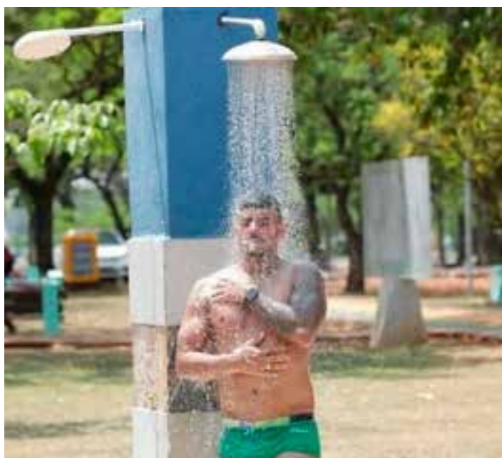
A temperatura poderá subir até 5°C no período de 2 a 3 dias, podendo provocar leve risco à saúde da população.

As cidades do Sul/Sudoeste de Minas, Itapetininga, Centro Norte de Mato Grosso do Sul, Zona da Mata, Leste Rondoniense, Centro Ocidental Paranaense, Ribeirão Preto, Araçatuba, Sudeste Mato-grossense, Noroeste Paranaense, Macro Metropolitana Paulista, Marília, Norte Central Paranaense, Sudoeste de Mato Grosso do Sul, Araraquara, Sudoeste Paranaense, Oeste Paranaense, Pantanais Sul Mato-grossense tá mbém fazer