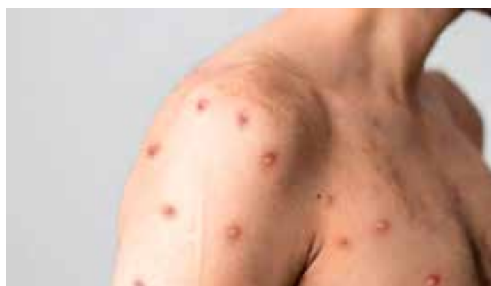
Membros da Organização Mundial da Saúde (OMS) se reúnem nesta quarta-feira para discutir o risco potencial da mpx.

A mpx é uma doença causada pelo vírus monkeypox, que pertence ao mesmo grupo de vírus da varíola. Ela é transmitida pelo contato próximo e, na última onda, o contágio foi fortemente associado a relações sexu-