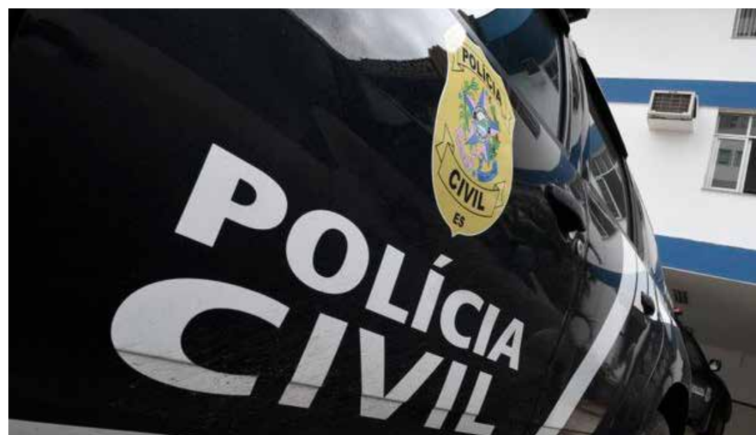
Polícia foi acionada para atender ocorrência de disparo de arma de fogo, na noite de sexta (16); quando chegaram ao local, a vítima estava morta em uma calçada.

O Corpo de Bombeiros também esclareceu que o Centro de Atividades Técnicas (CAT), responsável pelas vistorias e emissões de alvarás da Corporação e só envia e-mail sobre os processos em andamento.