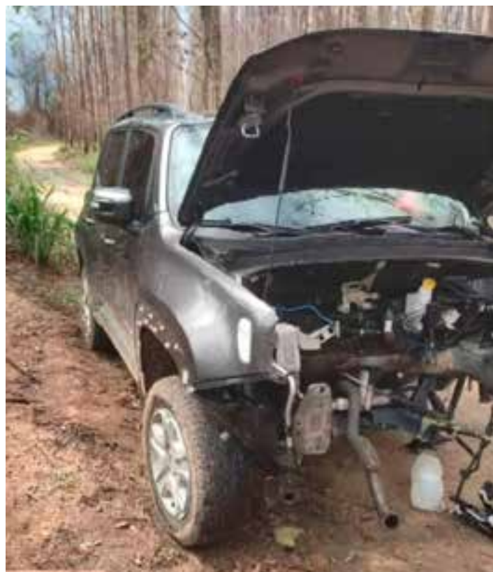
Líder do esquema, um homem de 27 anos, foi preso pela polícia nesta quinta-feira (15); quadrilha também queimava os veículos para destruir provas.

As peças originais do carro eram roubadas e, depois disso, o veículo recebia um número de identificação de outros veículos adquiridos em leilão judici-