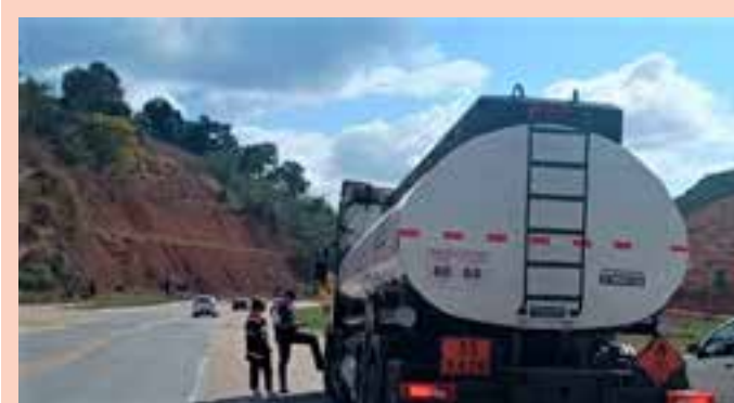
As irregularidades encontradas resultaram na aplicação de quatro autos de infração, no valor total de R$ 24,5 mil, entre multas aplicadas e impostos devidos.

“Ele [o suspeito] colocou fogo no veículo para que a gente não pudesse identificar e descobrir a fraude. Inclusive, durante a destruição do carro, ele acabou se queimando e ficou internado por uma semana em um hospital da Serra”, finalizou o delegado.