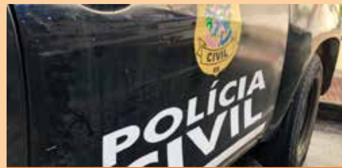
Ele realizou os procedimentos com a intenção de satisfazer a lascívia dele”, afirmou a delegada Geórgia.

As investigações revelaram que este não é o primeiro inquirido em que o enfermeiro está envolvido. Ele já trabalhou em outras cidades da região, como Barra de São Francisco, Vila Valério, São Gabriel da Palha e Águia Branca.