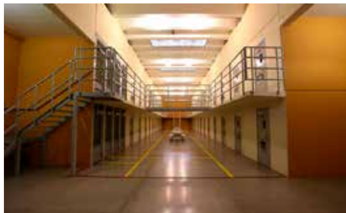
Funcionário da Sejus teria passado o celular para um detento acusado de liderar tráfico em Cariacica e integrar o PCV. Aparelho seria usado para planejar fuga.

Ele teria entregado para um detento, que também foi denunciado. Segundo o MPES, a entrega do aparelho ocorreu durante o reco-