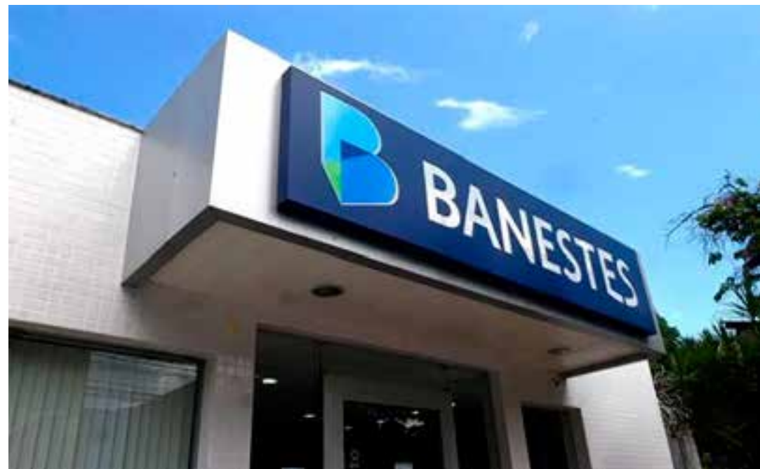
Nove agências do Banestes vão oferecer atendimento especial para consumidores com serviços e operações de empréstimos com pagamentos atrasados.