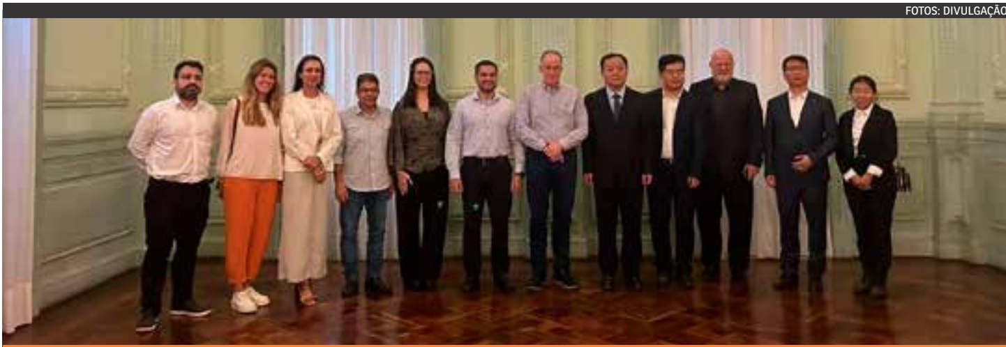
Os executivos da RuiYuan encerraram, nesta terça-feira (23), uma visita ao Estado. Eles saíram daqui animados e querem anúncio com Lula, Xi Jinping e Casagrande.