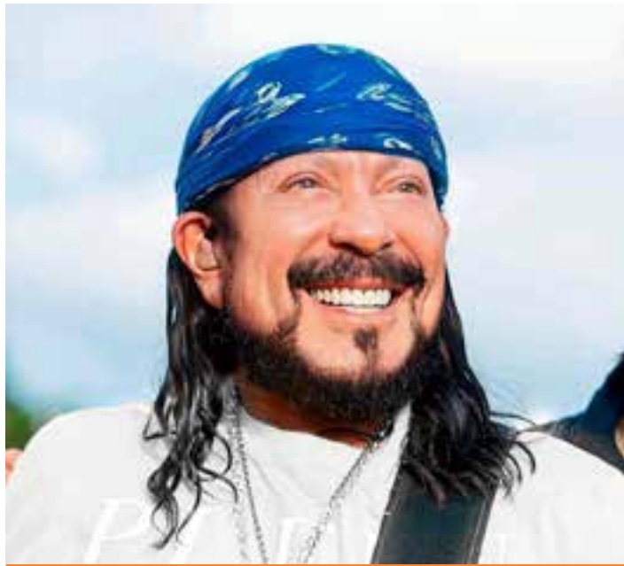
A Expolinhares será realizada entre os dias 21 e 25 de agosto no Parque de Exposição do município, no bairro Interlagos.

Outra novidade para o aniversário da cidade é o retorno do desfile cívico escolar para a Avenida Governador Carlos Lindenberg, no Centro, que esse ano terá como tema – Linha-