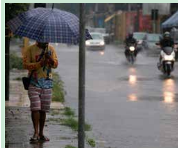
A previsão é para as cidades do Sul do Estado, a partir da próxima semana, de acordo com a empresa Climatempo.

Quem acompanha de perto as negociações afirma que o martelo ainda não está batido, mas as coisas estão bem encaminhadas. Vamos aguardar novembro.