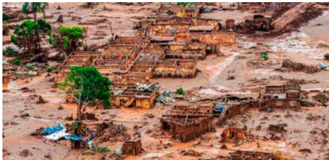
O acordo de reparação dos danos ambientais e socioeconômicos provocados pelo rompimento da barragem do Fundão, em Mariana, deve ser celebrado em breve.

"Os prazos de pagamento, isso é uma questão muito importante para nós. Porque o acordo não foi feito porque as empresas, em 2022, jogaram os pagamentos muito para frente. E nós precisamos resolver o problema hoje da sociedade. As pessoas estão passando fome, estão sem emprego, estão sem trabalho, não podem pescar, não vivem mais como eram antes. Elas precisam de um retorno. Nós estamos chegando a nove anos que essa questão não foi resolvida,