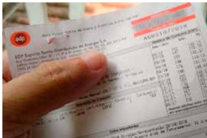
No mês passado, a Aneel tinha estabelecido bandeira amarela, com acréscimo de R$ 1,88 a cada 100 kW/h consumidos, por causa da previsão de chuva abaixo da média e a expectativa de aumento do consumo de energia.

As bandeiras tarifárias funcionam da seguinte maneira: as cores verde, amarela ou vermelha (nos patamares 1 e 2) indicam se a energia custará mais ou menos em função das condições de geração, sendo a bandeira vermelha a que tem um custo maior, e a verde, sem custo extra.