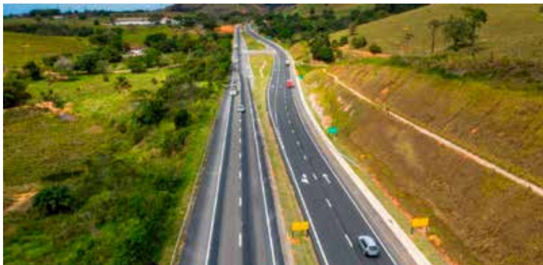
Segundo a decisão, a concessionária está proibida, pelo prazo de cinco anos, de receber incentivos, subsídios, subvenções, doações ou empréstimos de órgãos ou entidades públicas e de instituições financeiras públicas ou controladas pelo poder público.

Além disso, de acordo com o processo, “as falsas informações prestadas possibilitaram o início da cobrança do pedágio no primeiro ano de concessão, antes de preenchidos todos os requisitos necessários, e dificultaram a redução da tarifa em razão do descumprimento do Plano de Exploração da Rodovia (PER)”.