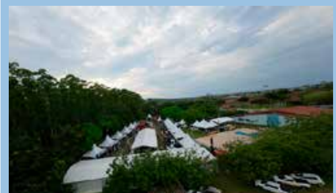
A prisão foi realizada após a polícia tomar conhecimento de que o investigado havia descumprido a medida protetiva e teria ameaçado matar a ex-mulher.

Onde: Gira Sol Country Club – ES-313 – Pinheiros/ES Horários de funcionamento: Dia 29 (quinta-feira): 16h às 21h30min Dia 30 (sexta-feira): 10h às 21h30min Dia 31 (sábado): 09h às 15h30min