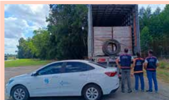
Segundo a PRF, os agentes deram ordem de parada a um caminhão Volvo/VM 330 para a fiscalização, o que revelou a situação irregular.

O ponto de partida desse processo foi um inquérito civil público em que o MPF apurou, nas escolas municipais com alunos quilombolas, problemas elétricos, nas condições e quantidades de sanitários, na falta de espaço para atividades comuns e a falta ou precariedade de saneamento básico. Ainda na apuração, o Município de São Mateus respondeu ao MPF que iniciaria reformas e construiria nova unidade de uma escola. Apelação Cível nº 5000590-90.2018.4.02.5003