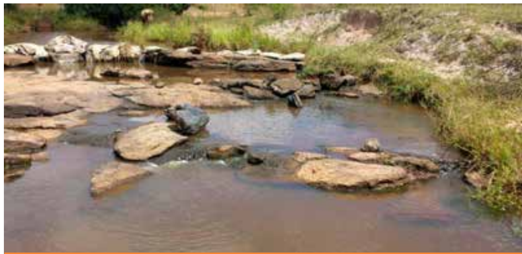
Segundo o governo, o Estado de Atenção foi declarado devido à falta de chuvas e a estiagem dos últimos meses, que contribuiu para baixar as vazões nos principais rios e demais cursos d'água do estado.

O decreto traz recomendações para o uso racional da água, direcionadas tanto à população em geral quanto a setores específicos, como agricultura e indústria. Entre