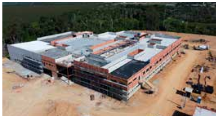
MPC-ES aponta prejuízo potencial devido a irregularidades na construção do Complexo de Saúde em São Mateus. Entenda as falhas no projeto e as medidas propostas.

total reduzida, aproximadamente 88% (6.587,45m 2 ) ocorreram em ambientes de circulações, recepções e salas de espera; “ambientes esses cujo custo de construção é muito inferior às demais áreas do hospital”.