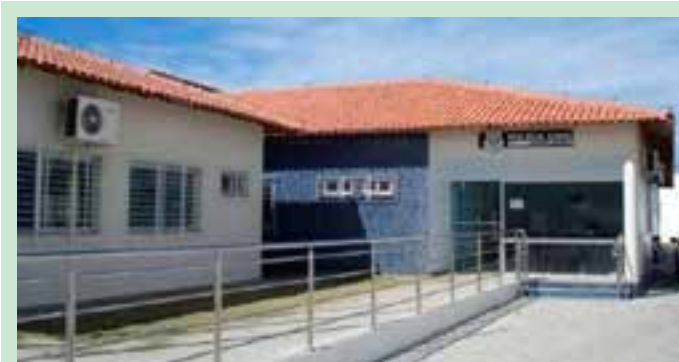
Os presos foram encaminhados ao sistema prisional, onde permanecerão à disposição da Justiça.

Ainda segundo a PRF, diante das informações obtidas, os agentes constataram a ocorrência de transporte de mercadoria nacional sem a documentação fiscal, “configurando um crime tributário”. A mercadoria foi retida e a Secretaria da Fazenda do Espírito Santo (Sefaz-ES) foi acionada para adotar os procedimentos cabíveis.