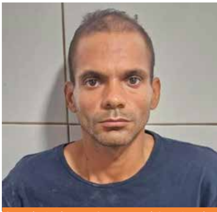
O suspeito do crime, que não teve o nome informado, seria o próprio filho da vítima.

pria mãe, Lindaura Pacatuba, de 71 anos, com golpes de madeira na região da cabeça, no bairro Interlagos, em Linhares, no Norte do Espírito Santo, na tarde de quinta-feira (11), Francisco de Assis Nogueira do Carmo, de 38 anos, foi preso pela Polícia Militar cerca de três horas após o crime. Ele foi encontrado em um beco no bairro Shell, sentado no meio-fio de uma rua. As informações são de A Gazeta.