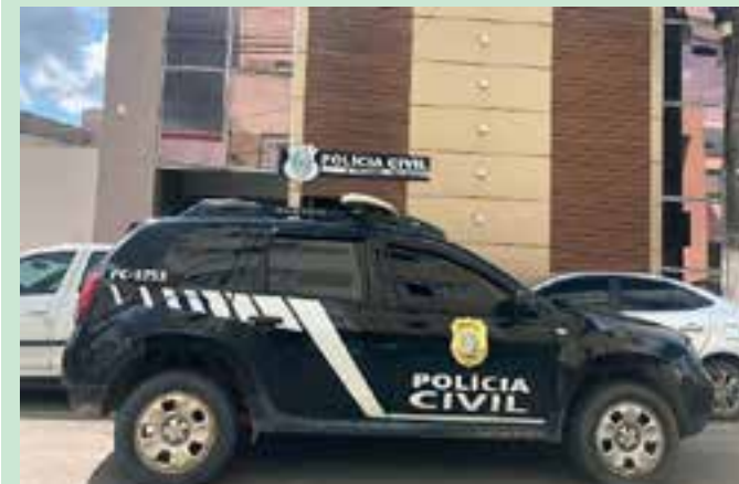
A prisão foi realizada após a polícia tomar conhecimento de que o investigado havia descumprido a medida protetiva e teria ameaçado matar a ex-mulher.

Foram realizadas diligências para apurar a situação, momento em que foi constatado que o rapaz teria contra ele um mandado de prisão preventiva em aberto. Dessa forma, os policiais se dirigiram ao endereço e avistaram o suspeito no portão da residência, sendo ele então cientificado do mandado de prisão preventiva em seu desfavor. Ele foi e conduzido à Delegacia Regional de São Mateus para os procedimentos de praxe.