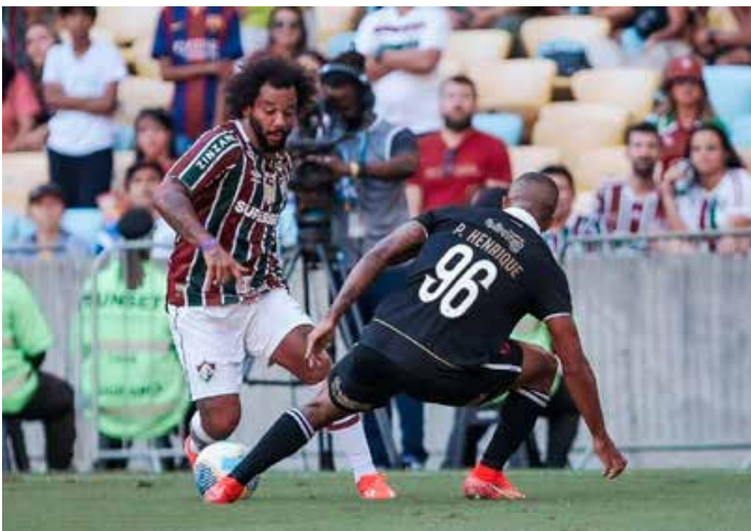
O confronto, válido pela 22ª rodada do campeonato brasileiro, está para ser confirmado em Cariacica, e tem previsão de acontecer no dia 11 de agosto.

Por meio de nota a Sport informou que foi sondada sobre a possibilidade da realização do jogo entre Vasco e Fluminense, previsto para o dia 11 de agosto, no Estádio Kleber Andrade, pelo Campeonato Brasileiro. Entretanto, não houve ainda nenhuma solicitação oficial para a reserva da data e pagamento do aluguel do estádio.