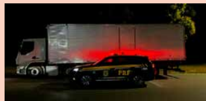
Segundo a PRF, os agentes deram ordem de parada a um caminhão Volvo/VM 330 para a fiscalização, o que revelou a situação irregular.