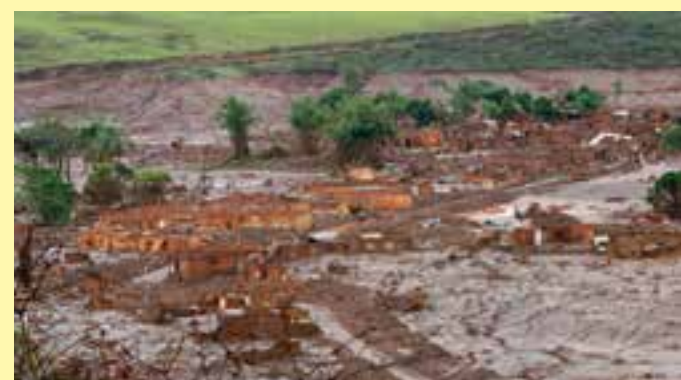
A mineradora brasileira não responderá mais perante o tribunal estrangeiro, cabendo apenas à BHP Billiton realizar a defesa na ação de reparação.

O MPC-ES relembra que foi a partir dos chamados “eventogramas” que o Tribunal de Contas iniciou apuração sobre irregularidades em pagamentos antecipados do Instituto de Obras Públicas do Estado do Espírito Santo (Iopes) – fundido ao DER-ES em 2019 – ao Consórcio Andrade Valladares-Topus.