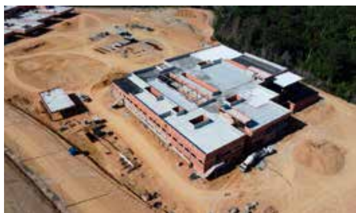
O projeto proposto anunciava 270 leitos, o que já era um número expressivo para as regiões Norte e Extremo Norte do Espírito Santo, em se tratando de saúde.

O Complexo de Saúde do Norte, que está sendo erguido às margens da BR-101, em São Mateus, vai contar com um novo Hospital Roberto Arnizault Silveiras (HRAS), a sede da Superintendência Regional de Saúde, o Centro Regional de Especialidades, a Farmácia Cidadã e o Hemocentro Regional (Hemoes).