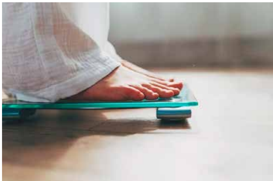
Pesquisadores do Japão encontraram proteína que garante os efeitos do exercício, incluindo uso de oxigênio, perda de gordura e queda de peso.

Eles descobriram que, sem as proteínas, o organismo dos animais é basicamente cego para atividades de curto prazo e não se adapta ao estímulo oferecido. Ou seja, esses indivíduos consomem menos oxigênio e