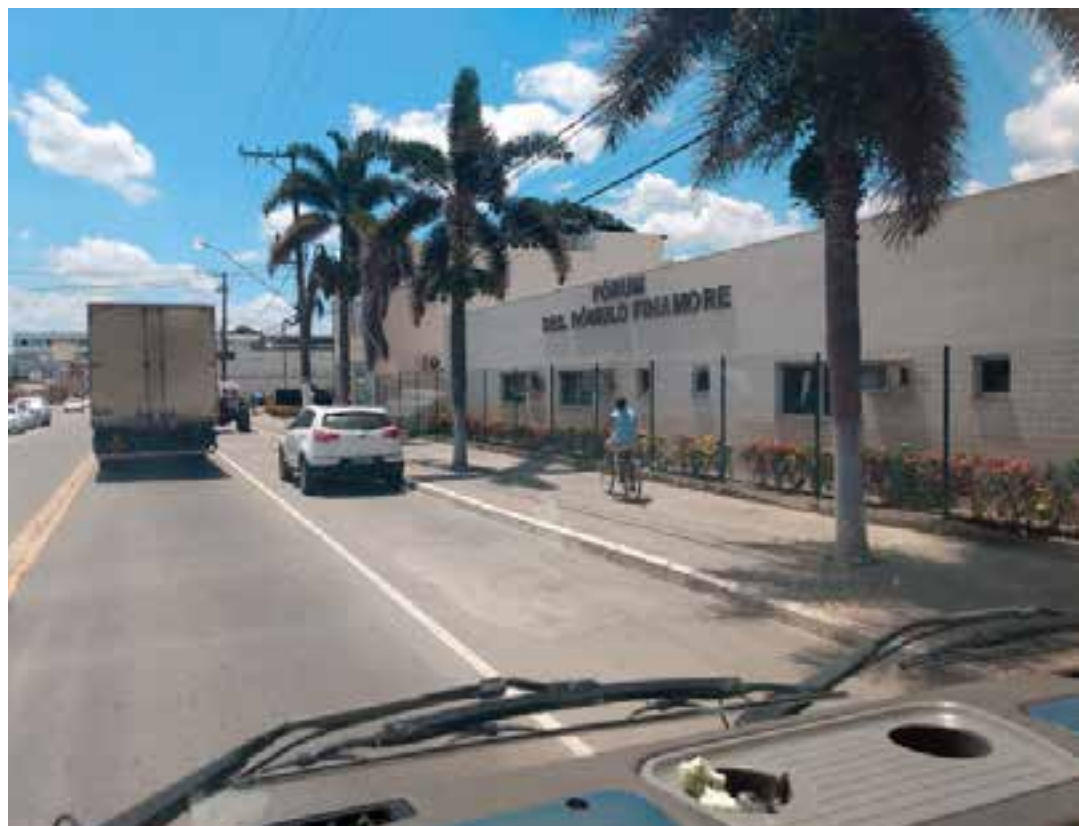
Nova Venécia é 1º lugar no estado em alfabetização.

Os presos foram encaminhados ao sistema prisional, onde permanecerão à disposição da Justiça. As investigações continuam para elucidar os fatos e identificar outros possíveis envolvidos.