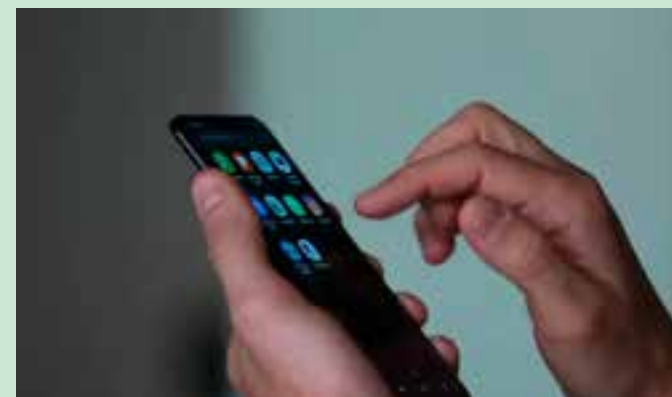
Segundo a Polícia Civil, duas mulheres exigiram o pagamento de valores para não divulgarem o conteúdo das conversas, mas pastor denunciou o caso.

As duas foram autuadas em flagrante por extorsão e encaminhadas ao Centro de Triagem de Viana (CTV), onde permanecem à disposição da Justiça.