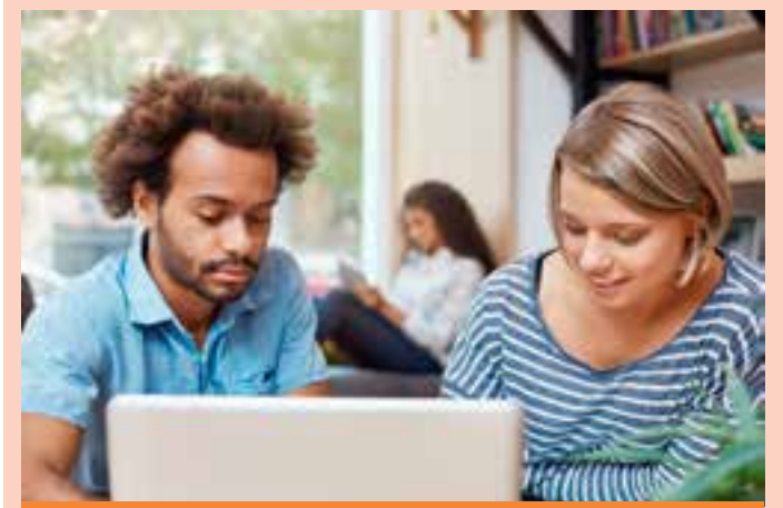
Os cursos são realizados pelo Governo do Estado, por meio da Secretaria da Ciência, Tecnologia, Inovação e Educação Profissional (Secti).