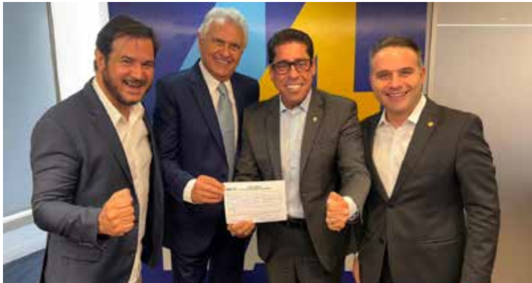
Sua ficha foi abonada pelo Governador de Goiás, Ronaldo Caiado; pelo presidente nacional do União, Antônio de Rueda; e pelo presidente do União em Santa Catarina, deputado federal Fábio Schiochet.

A assinatura da ficha aconteceu na sede do União, e foi comemorada pelos integran-