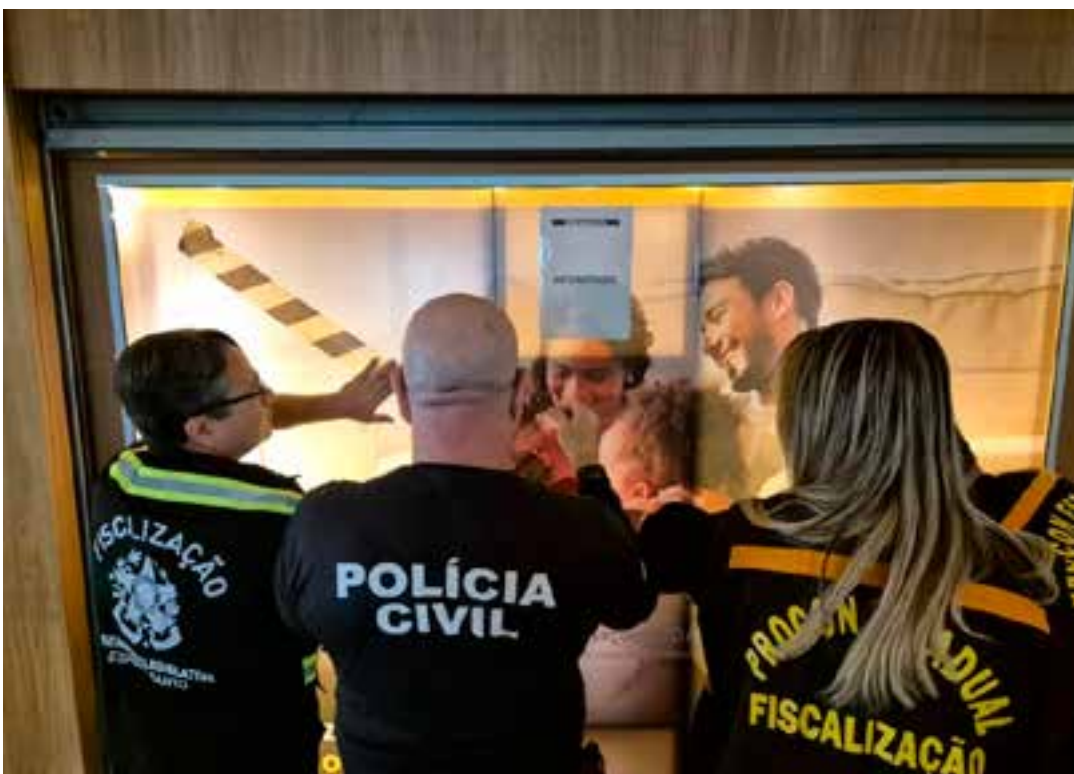
Segundo o delegado, se condenados, os envolvidos podem pegar até 15 anos de prisão.