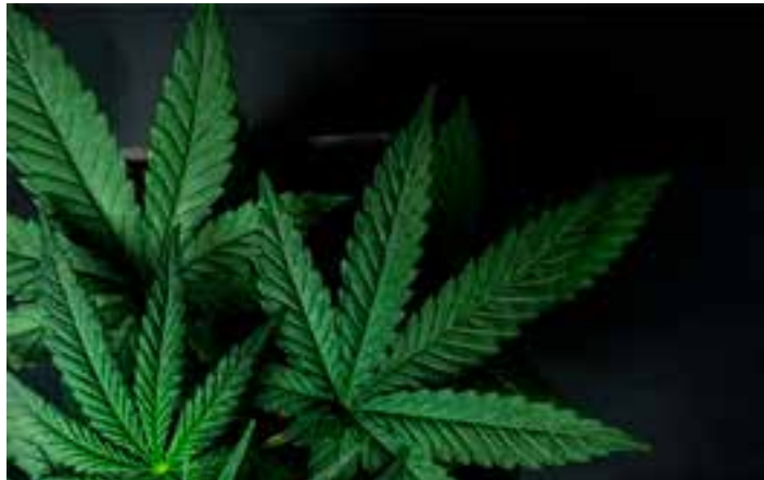
Mas o critério não é absoluto. Se uma pessoa estiver com balança de precisão, por exemplo, pode ser denunciada como traficante.

As propostas apresentadas foram de 25 a 60 gramas. Os