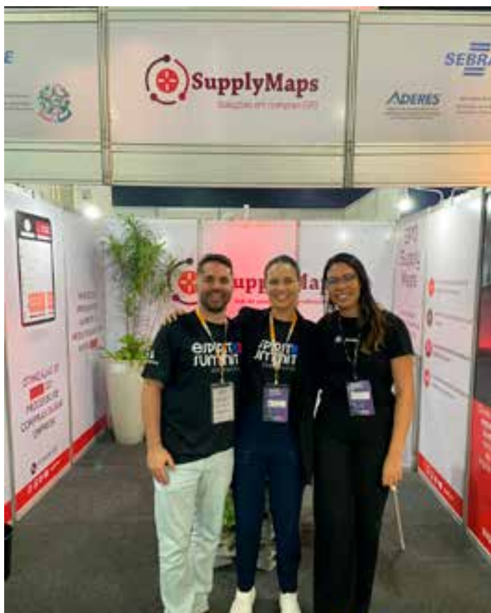
A SupplyMaps conquistou uma vaga no Top 100 do Prêmio Sebrae Startups e está na briga pelo grande prêmio.

Serão selecionadas três de cada uma das dez categorias: Agro e Negócios do Campo; Neoindustrialização e Produtividade Industrial; Meio Ambiente, Energia e Tecnologias Verdes; Inovação Fi-