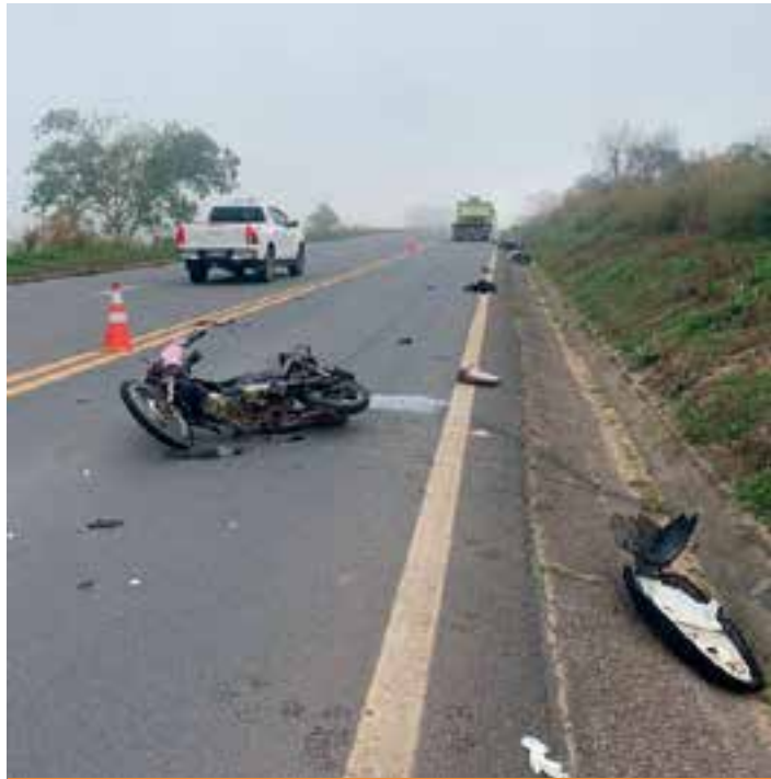
O motorista da carreta relatou que estava saindo de São Mateus com destino a Aracruz e não viu o momento da colisão entre as motos.

O motorista da carreta relatou que estava saindo de São Mateus com destino a Aracruz e não viu o momento da colisão entre as motos. Ele percebeu algo errado ao