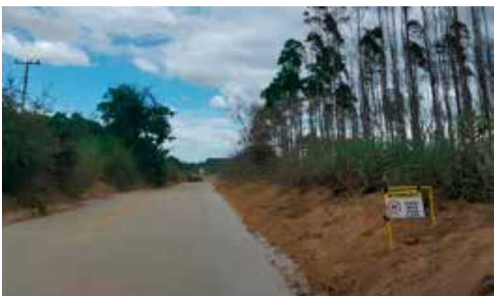
Companhia mantém diálogo permanente com as comunidades onde há bases florestais.

“A melhoria das estradas, realizada pela Suzano, tem beneficiado toda a comunidade, principalmente o tráfego do transporte escolar, dos veículos da Flona Rio Preto e as visitas ao parque. É muito importante essa parceria entre a empresa e a comunidade para que haja um ambiente de diálogo e colaboração mútua”.