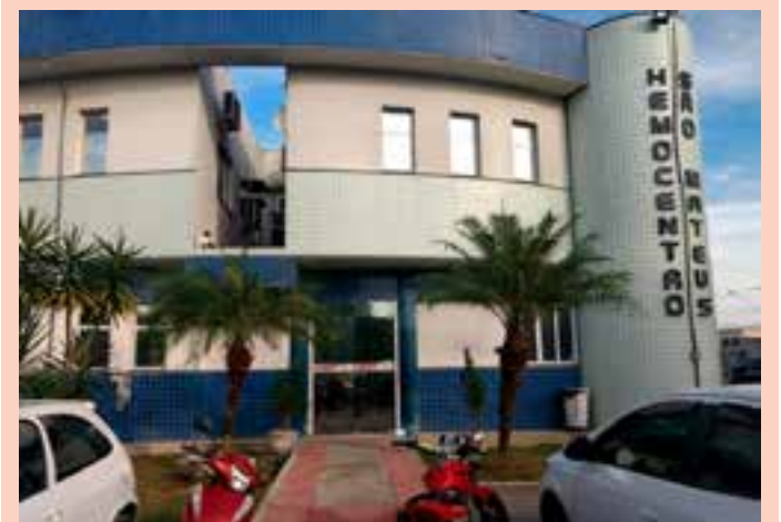
Os atendimentos serão feitos em um sábado por mês, totalizando seis datas até o final do ano.

No momento da ação, nenhum suspeito foi localizado. As investigações prosseguem para identificação dos autores.