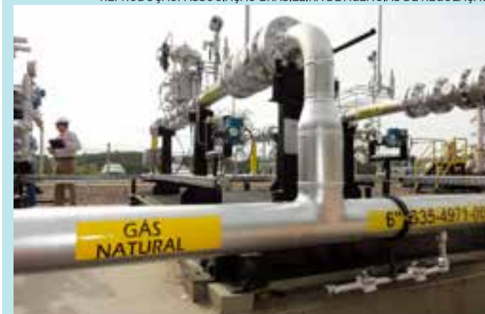
Com esse novo contrato, o Espírito Santo conta, agora, com quatro supridores de gás natural.