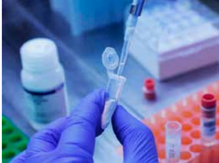
Com a incorporação da vacina da Moderna ao Programa Nacional de Imunização (PNI), há a orientação das doses de reforço acontecerem anualmente ou semestralmente, a depender do grupo prioritário.

A identificação da KP.2 no Espírito Santo foi possível graças ao trabalho de vigilância genômica realizado pelo Laboratório Central de Saúde Pública do Espírito Santo (Lacen/ES). A amostra foi coletada de um paciente residente em Vitória, no dia 14 de maio de 2024, e a confirmação da variante ocorreu após a rotina de sequenciamento do SARS-CoV-2.