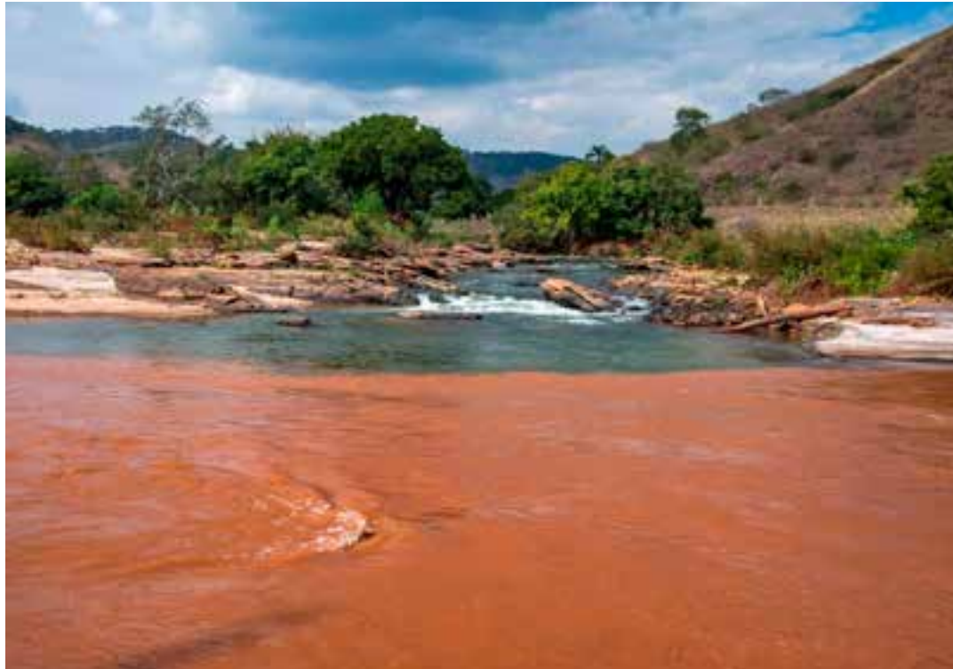
Vale, BHP e Samarco tentam fechar um acordo com Espírito Santo, Minas Gerais e governo federal como forma de reparação pelo rompimento da barragem de Fundão.

A Vale, BHP e Samarco, estão em uma mediação conduzida pelo Tribunal Regio-