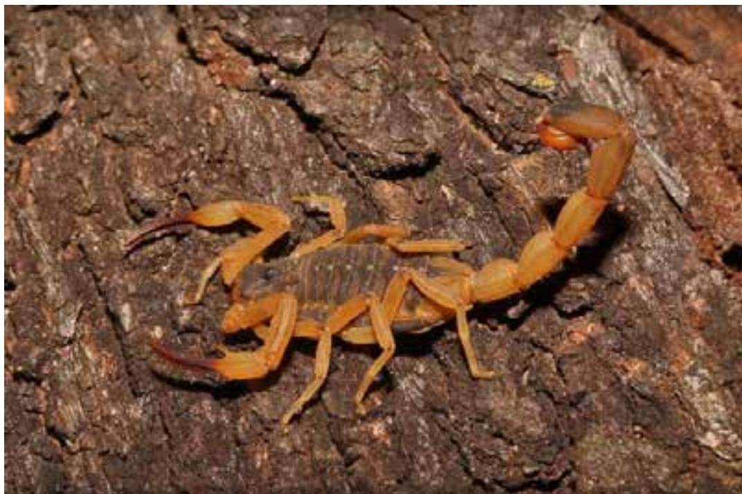
A preocupação é redobrada, principalmente neste período da colheita de café no município.

No Espírito Santo, a Secretaria de Estado da Saúde (Sesa), já soma 1.816 casos de picadas de escorpiões este ano. Também são contabilizados 449 acidentes com serpentes, 268 com aranhas, 242 com abelhas e 50 com lagartas. Em casos de acidentes o paciente deve procurar imediatamente a Unidade Mista de Inter-