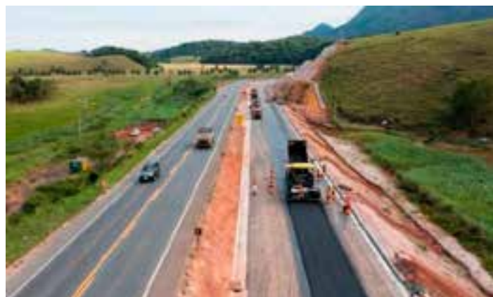
O governador Renato Casagrande está em negociação para uma definição sobre a obra.

Apesar de todos os caminhos indicarem um possível