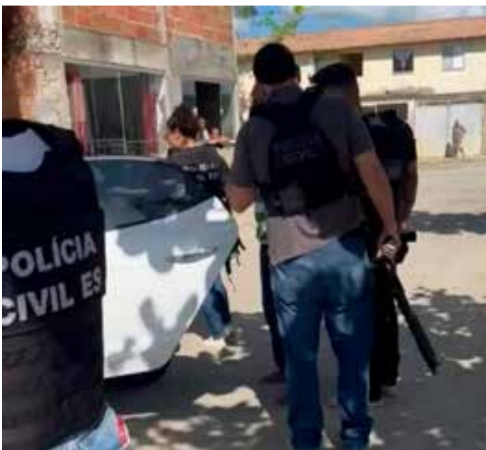
Um homem de 44 anos, foragido do sistema prisional, voltou a ser preso em São Mateus após a ex-esposa dele denunciar ter sido agredida por ele durante a madrugada.

SÃO MATEUS – A prisão foi efetuada por uma equipe da Delegacia Especializada de Atendimento à Mulher (Deam) do município no Condomínio Village das Flores, no Bairro Litorâneo. A vítima da agressão fez a denúncia, e a polícia acabou descobrindo que ele tinha registros criminais por roubo, homicídio e ameaça, além de ter fugido da prisão. O nome dele não foi divulgado.