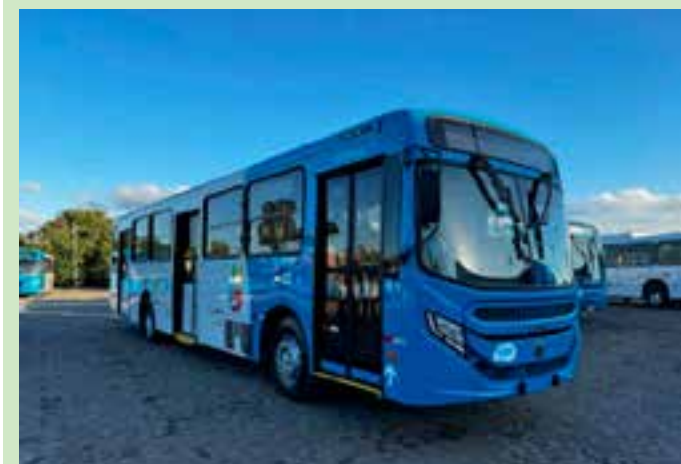
Todos esses veículos são dotados de ar condicionado, acessibilidade e wi-fi a bordo.

A renovação da frota também inclui a adoção da tecnologia do motor Euro 6, que estabelece padrões rigorosos de controle de poluição, contribuindo para a redução das emissões de poluentes. Essa iniciativa faz parte de um conjunto de medidas de modernização do sistema metropolitano de transporte, iniciado em 2019, que inclui obras viárias, renovação da frota, implementação do bilhete único, o aplicativo Ônibus GV para consultas em tempo real, a retomada do Aquaviário e a reforma de terminais entre outras medidas.