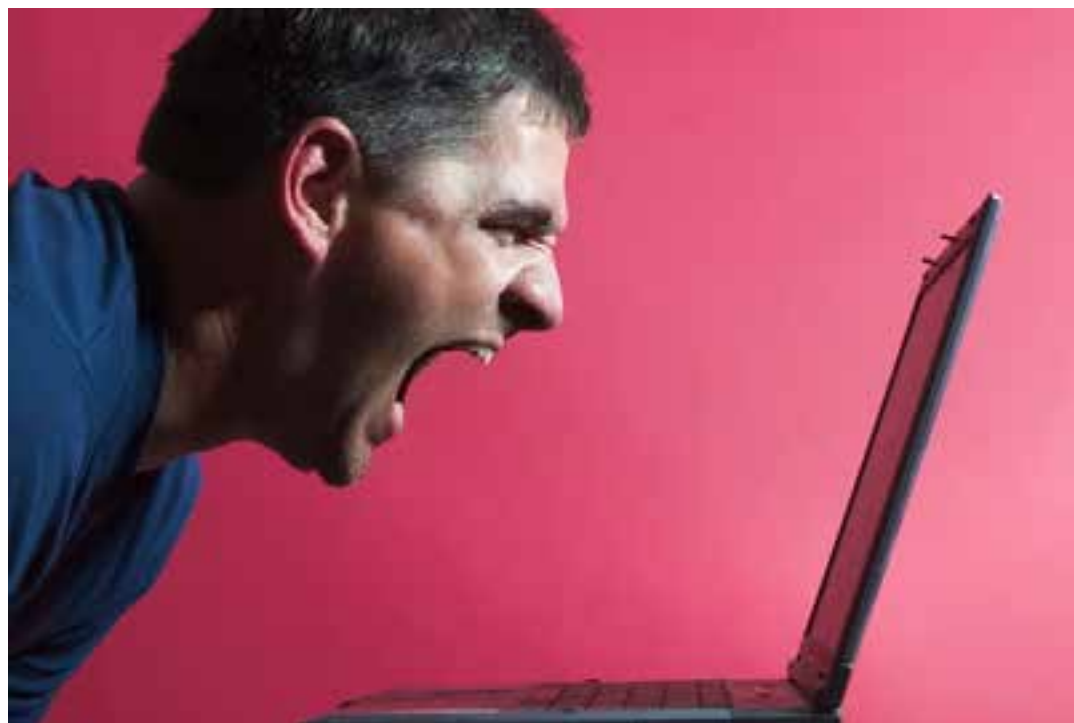
Suplemento foi capaz de diminuir episódios de raiva em 28%. Pesquisadores sugerem que resultado é fruto da nutrição do cérebro.

De acordo com a investigação publicada em maio na revista Aggression and Violent Behavior , os ácidos graxos disponíveis nas cápsulas feitas a partir de óleo de peixe parecem ser capazes de reduzir inflamações cerebrais e melhorar o fluxo de sangue no organismo.