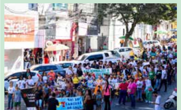
A ação faz parte do Projeto MPT na Escola.

A avenida refletiu o compromisso de todos os envolvidos em combater o trabalho infantil e promover a conscientização sobre os direitos das crianças e adolescentes.