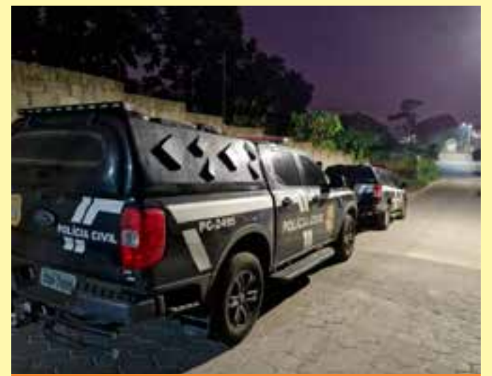
Os nomes dos envolvidos e do bairro onde ocorreu o crime não estão sendo divulgados para preservar a vítima.

Idosos a partir de 60 anos, imunocomprometidos a partir de 5 anos, gestantes e puérperas devem receber duas doses de reforço ao longo do ano, com um intervalo mínimo de seis meses entre elas. Os demais grupos prioritários devem receber uma dose de reforço anualmente. Além disso, pessoas acima de 5 anos de idade da população geral que não receberam nenhuma dose da vacina covid-19 poderão receber uma dose da vacina covid-19 XBB.