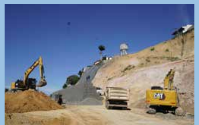
Depois de nivelada, a estrutura vai receber outra camada de aterro, que servirá de base para sustentar o segundo nível do muro.

A obra da Ladeira do Besouro é de fundamental importância tanto para a segurança dos moradores quanto para resgatar a vocação turística daquele local, que oferece uma das vistas mais privilegiadas do Espírito Santo: a do Vale do Cricaré.