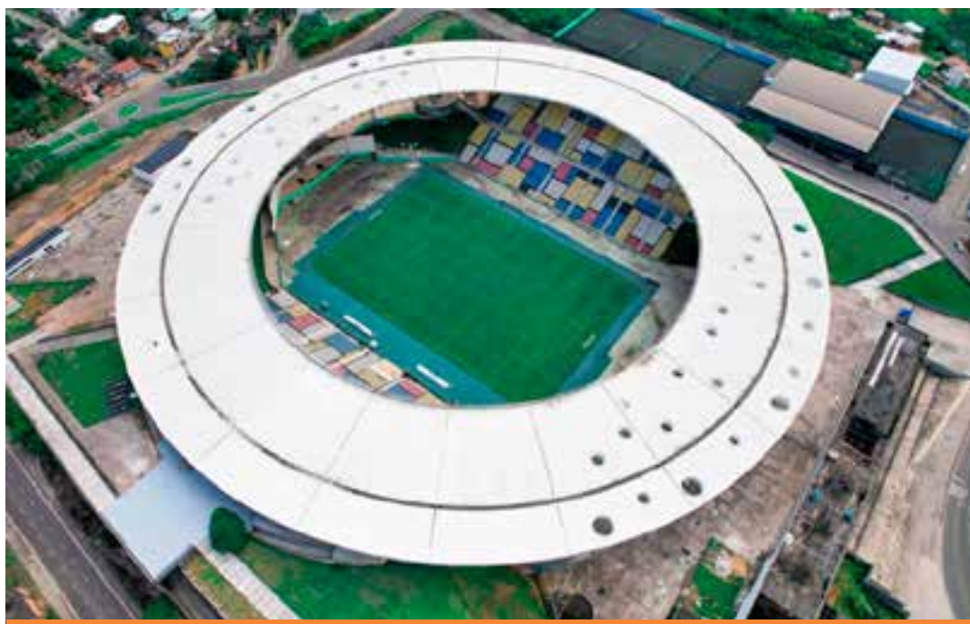
Neste ano, o Klebão já recebeu jogos envolvendo outras equipes da Série A do Campeonato Brasileiro, como Vasco, Fluminense e Atlético Mineiro.

O Botafogo atuou no estádio pela última vez no dia 15 de março do ano passado, quando goleou o Brasileiro por 7 a 1, pela Copa do Brasil. Já o Grêmio disputou apenas uma partida de sua história no Kleber Andrade: foi no dia 24 de outubro de 1995, no empate por 0 a 0 diante do Fluminense, em confronto do Campeonato Brasileiro.