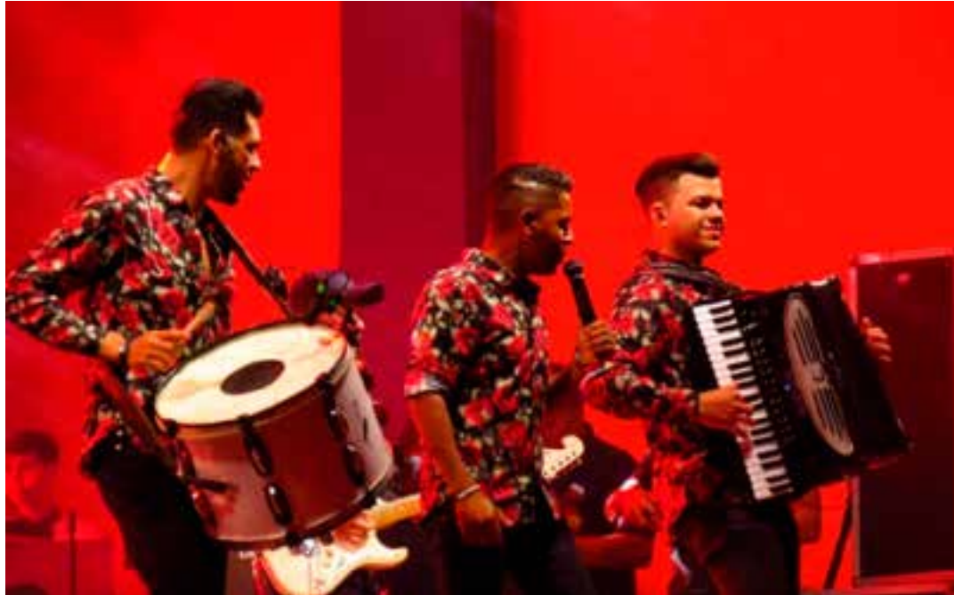
Os 3 do Nordeste se apresentam na 22ª edição do Fenfit, que acontece entre 20 e 27 de julho de 2024 em Itaúnas