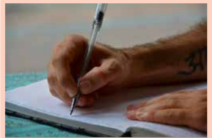
Ifes abre inscrições para Professor Substituto em Elétrica no Campus São Mateus. Remuneração de R$ 4.580,57.

O homem, que não teve a identidade divulgada, foi conduzido à Delegacia Regional de São Mateus, onde foi dado cumprimento ao mandado de prisão. Após os procedimentos de praxe, o detido foi encaminhado ao sistema prisional.