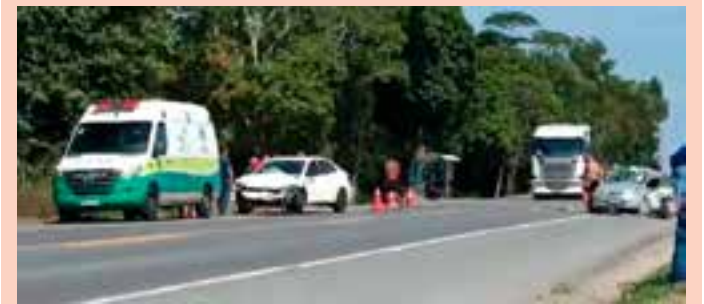
De acordo com informações iniciais da Polícia Rodoviária Federal (PRF), o motorista de um Chevrolet Corsa morreu no local.