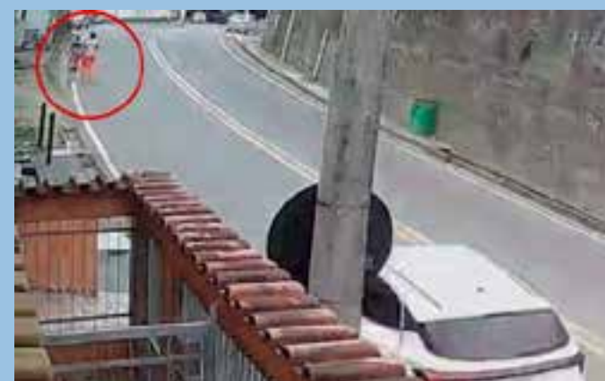
A colisão foi registrada na tarde desta quinta-feira (30). O condutor fugiu após o acidente, mas foi localizado pela Polícia Militar.

O motorista foi encaminhado para a Delegacia Regional de Fundão e vítima socorrida pelo Samu.