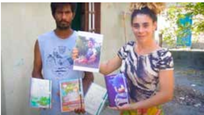
Projeto foi contemplado com Edital da Suzano destinado a fomentar pequenos negócios