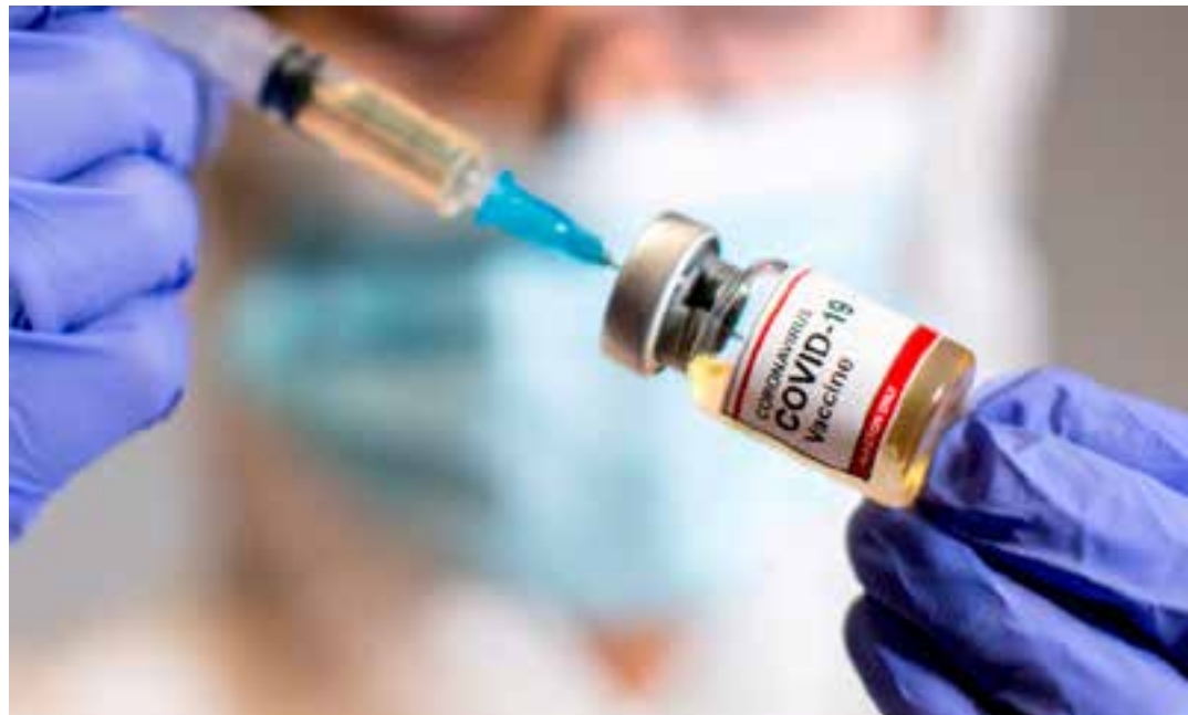
No Brasil, a vacina atualizada, que protege contra as sublinhagens Ômicron XBB e cepas atualmente circulantes do vírus SARS-CoV-2, incluindo JN.1.

Desde o início do ano, a vacina contra a Covid-19 passou a fazer parte do Programa Nacional de Imunizações, do Ministério da Saúde (PNI). A medida foi tomada com base em evidências científicas mundiais e dados epidemiológicos de casos e óbitos pela doença no país. Agora, a nova vacina atualizada acaba de chegar e está disponível nos postos de saú-