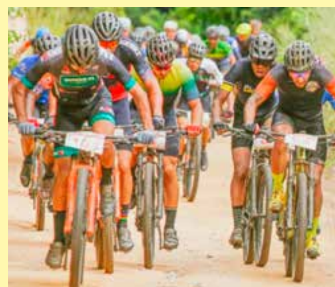
Jaguaré se prepara para sediar a 3ª Etapa da Copa Norte Capixaba de Mountain Bike (MTB). O evento promete movimentar atletas e simpatizantes do ciclismo neste domingo, dia 02 de junho.

A série especial mostra personagens da vida real, com histórias inspiradoras, que cruzaram com a Suzano e fizeram acontecer. Pessoas que batalham sempre por uma sociedade mais justa, que criam oportunidades em vez de obstáculos e nunca desistem diante das dificuldades. Todos os vídeos da série estão disponíveis no canal da Suzano no youtube.