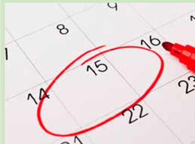
Dos seis feriados restantes no ano, metade vai cair no fim de semana. O próximo feriado será só em 15 de novembro.