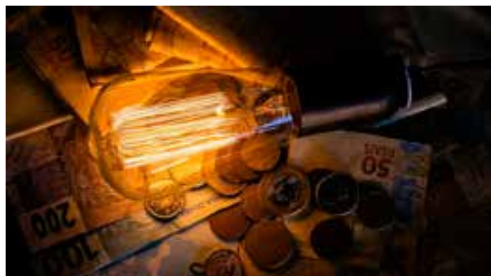
De acordo com a agência, as condições favoráveis de geração de energia mantêm-se há 26 meses, desde abril de 2022.

rias foi criado em 2015 para indicar aos consumidores os custos da geração de energia. Ele reflete o valor variável da produção, considerando a disponibilidade de recursos hídricos, o avanço das fontes renováveis, bem como a necessidade de acionamento de fontes mais caras, caso das termelétricas.