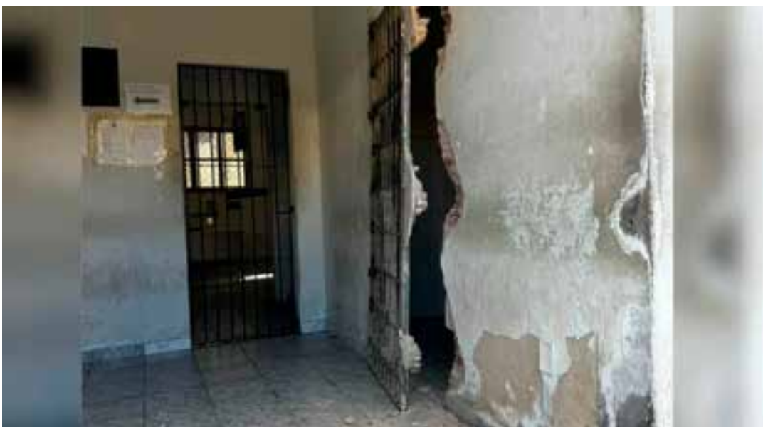
Uma imagem mostra a grade aberta e parte da parede destruída.

A perícia patrimonial da Polícia Científica foi acionada para investigar a fuga bem como a Corregedoria da PC vai apurar o caso. A Polícia Militar também foi procurada pela reportagem. O texto será atualizado, se houver retorno.