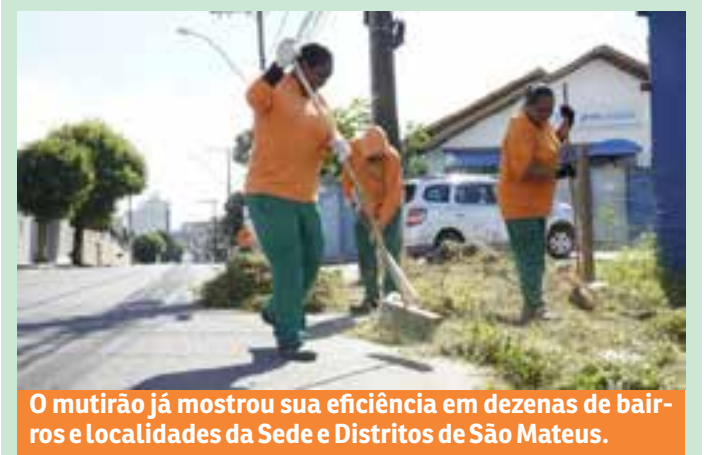
O mutirão já mostrou sua eficiência em dezenas de bairros e localidades da Sede e Distritos de São Mateus.

O mutirão já mostrou sua eficiência em dezenas de bairros e localidades da Sede e Distritos de São Mateus, realizando além da varrição e capina, poda de árvores, jardinagem, tapaburacos, caiação de meio-fio, retirada de entulho.