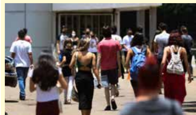
A inscrição é feita através da Página do Participante do Enem; o pagamento da taxa deve ser efetuado até 12 de junho.

“O Espírito Santo não só se recuperou do período pandêmico, como, em termos relativos, subiu muito. O papel do Governo do Estado, de coordenar o regime de colaboração, é muito visível. O Estado lidera, com os municípios, esse esforço e acredito que a gente está sendo bem-sucedido. Este resultado só veio evidenciar esse aspecto”, afirma o secretário de Estado da Educação, Vitor de Angelo.