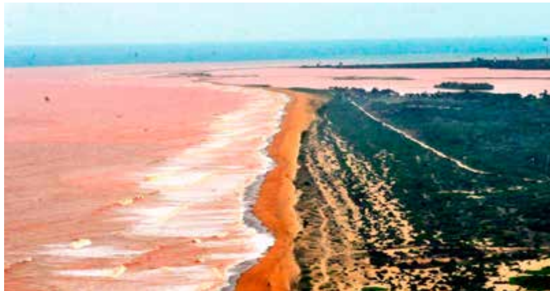
Atingidos de São Mateus, Linhares, Aracruz, Serra e Conceição da Barra devem ser ressarcidos por danos do desastre ambiental em Mariana (MG).

Seguindo das instituições de Justiça que atuam no caso Samarco, a Justiça Federal aponta que a quitação do Novel abrange os danos originais do rompimento até outubro de 2021, limite temporal fixado para os lucros cessantes. No entanto, caso a retomada das condições econômicas não seja comprovada pelo CIF, é possível o pagamento pelo lucro cessante.