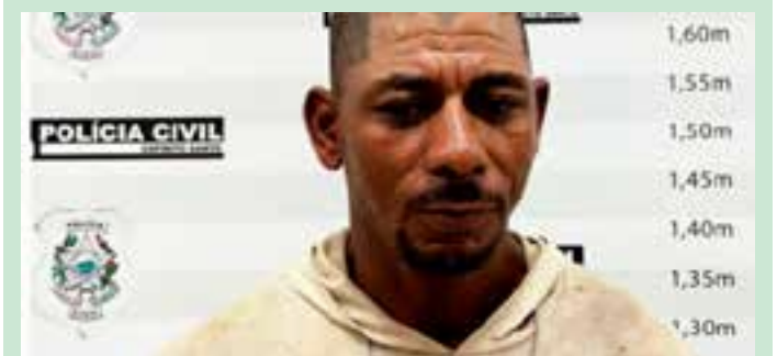
Ele foi detido e levado para a Delegacia de Polícia de Jaguaré.

Ele foi detido e levado para a Delegacia de Polícia de Jaguaré. Após os procedimentos de praxe, ele foi encaminhado ao Sistema Prisional, permanecendo à disposição da Justiça.