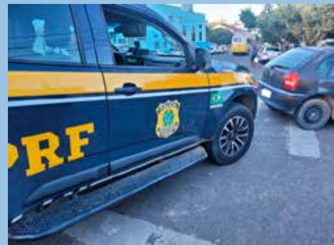
A Polícia Rodoviária Federal recuperou mais um veículo clonado em São Mateus/ES.

Diante dos fatos apresentados, o homem foi conduzido ao Departamento de Polícia Judiciária (DPJ) de São Mateus.