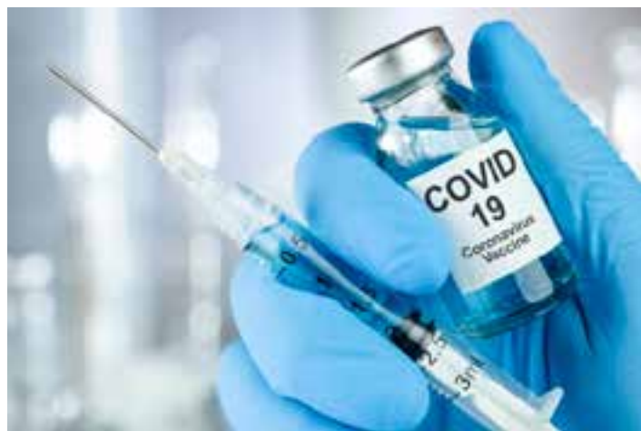
Os dados são da Pesquisa Nacional por Amostra de Domicílios (PNAD) Contínua: covid-19 (2023) divulgados nesta sexta pelo Instituto Brasileiro de Geografia e Estatística (IBGE).

Entre as pessoas de 5 a 17 anos de idade vacinadas contra a covid-19, 84,3% tinham tomado pelo menos duas doses do imunizante até o primeiro trimestre de 2023, sendo o esquema vacinal primário completo o mais comum: 50,5% com duas doses. Os que tomaram a dose complementar com pelo menos um reforço 33,8% das pessoas dessa faixa etária. Das crian-