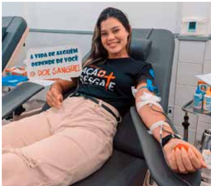
Ao todo, 60 pessoas estiveram na sede de São Mateus para fazer a doação, que resultou em 54 bolsas coletadas. Seis pessoas estavam inaptas.