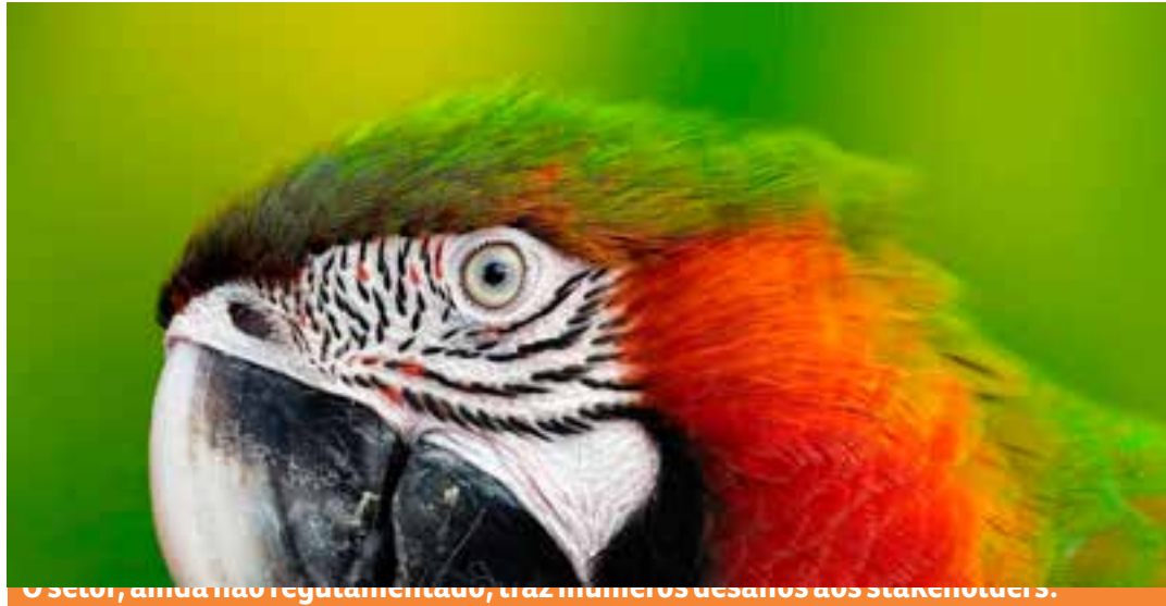
O setor, ainda não regulamentado, traz inúmeros desafios aos stakeholders.

Nos últimos anos, há uma crescente participação de população indígena e ribeirinha em temas relacionados à comercialização de créditos de carbono. Além disso, eles vêm desenvolvendo uma prática rentável, sustentável e responsável na manutenção das florestas que vivem: conquistar os créditos de carbono não pela