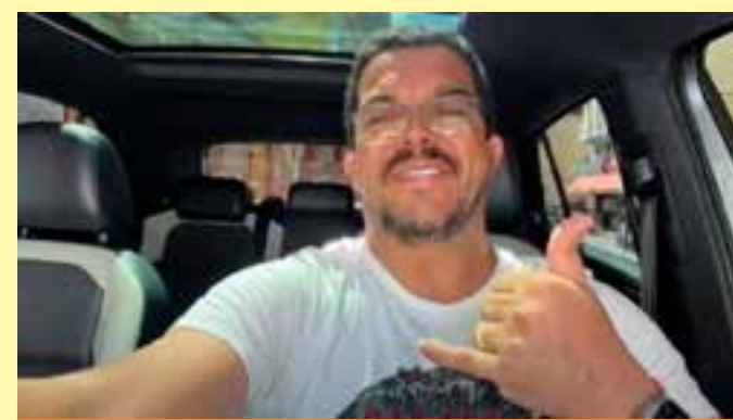
De acordo com a Polícia Militar, o proprietário do ônibus informou que o veículo estava estacionado quando o perdeu o freio e desceu desgovernado em marcha ré.

Após cinco rodadas de negociação, o governo afirmou que essas eram suas propostas finais.