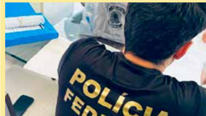
A investigação teve início no ano passado, quando bilhetes com pedidos de propina foram encontrados pela Polícia Federal.

“Durante as investigações vão aparecendo outras pessoas, outros nomes. A servidora também tinha contatos com outras empresas e a investigação vai continuar para ver se essa outra empresa também fazia o pagamento de propina”, afirmou.