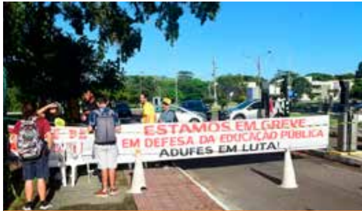
O Ministério da Gestão disse ter apresentado no último dia 15 sua proposta final aos docentes.

“Repudiamos qualquer tentativa da Proifes ou qualquer outra organização que não seja o Andes e o Sinasefe [Sindicato Nacional dos Servidores Fede-