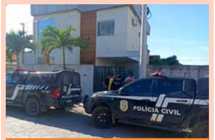
No local, os policiais foram recepcionados por duas mulheres, de 26 e 40 anos, e dois homens, de 40 e 43 anos, que se apresentaram como sócios e proprietários da empresa.

Além da captação nas sedes dos Hemocentros, prefeituras, órgãos públicos, ONGs, empresas e grupos civis podem solicitar a ida de uma equipe aos municípios de domicílio pelo projeto "Coleta Externa". Para agendar uma ação de coleta na sua cidade, é necessário ligar no telefone (27) 3636-7920. Para os municípios da região norte, o contato é (27) 99863-9764 ou (27) 3767-7954. A solicitação também pode ser feita de forma on-line, pelo e-mail hemoes.coletaexterna@saude.es.gov.br . Para mais informações acesse hemoes.es.gov.br/captacao-doadores .