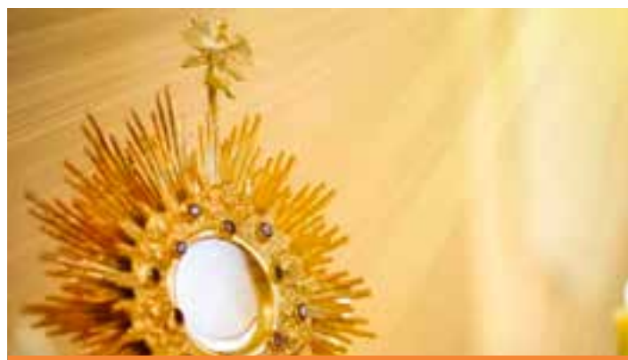
A data é sempre marcada para uma quinta-feira, 60 dias após o domingo de Páscoa.

No Brasil, Corpus Christi não é um feriado nacional. Ao contrário de datas como o Natal ou a Independência do Brasil, que são feriados em todo o território nacional, a decretação de Corpus Christi como feriado fica a cargo dos estados e municípios. Isso significa que a data pode ser feriado em algumas cidades e apenas um ponto facultativo em outras.