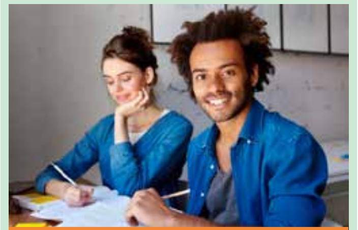
As inscrições vão até o dia 28. Para participar do processo seletivo o candidato deve acessar o site do QualificarES e ler as orientações dos respectivos editais.

"Convidamos representantes de instituições de direitos humanos, de órgãos do governo, como Incra, Defensoria Pública Estadual, Defensoria Pública da União, Ministério Público Federal e entidades parceiras, como Fase, Movimento Nacional de Direitos Humanos e Movimento Negro Unificado. Vamos tentar construir, junto com as comunidades quilombolas, um instrumento que possa dar viabilidade a algumas ações que já estão correndo na Justiça ou talvez ajuizar outras. Mas será feito em conjunto. O protagonismo é das comunidades quilombolas, devemos o respeito a elas, fazendo jus à Convenção 169 da OIT", expõe.