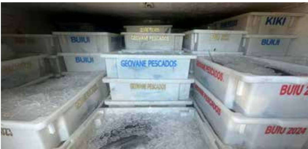
A polícia informou ainda que o material não possuía os lacres de inspeção sanitária do Serviço de Inspeção Federal (SIF), ou similar, necessários para produtos de origem animal.

Devido ao fato, de acordo com a PRF, foi constatado a princípio, a infração administrativa que prevê o transporte de mercadoria nacional sem nota fiscal. O veículo e a carga de pescados foram encaminhados ao Instituto Brasileiro do Meio Ambiente e dos Recursos Naturais Renováveis (IBAMA), para devida lavratura de auto de infração ambiental administrativo e a correta destinação da carga e do veículo apreendidos. A ocorrência foi enviada à Receita Estadual para as providências cabíveis.