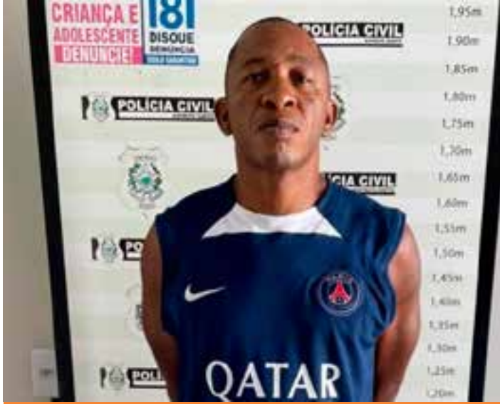
Contra ele havia mandado de prisão homicídio, roubo a banco, extorsão mediante sequestro, tráfico de drogas e associação para o tráfico.

A prisão ocorreu por meio de uma operação conjunta da Delegacia Especializada de Homicídios e Proteção à