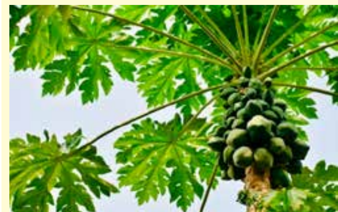
Parecer do Ministério Público de Contas apontou não cumprimento de prazos nos repasses do Fundo Municipal de Saúde junto ao INSS no ano de 2019.

No setor produtivo, entre os principais produtos da fruticultura que são economicamente mais relevantes para o Estado, destacam-se: o mamão que detém 43,6% da renda rural da fruticultura e participa com 4,82% do Valor Bruto da Produção Agropecuária (VBPA), e a banana, que detém 25,5% da renda rural da fruticultura e participa com 2,83% do VBPA, segundo dados apurados pela gerência de Análises e Dados da Secretaria da Agricultura, Abastecimento, Aquicultura e Pesca (Seag) a partir do Painel Agro/Incaper.