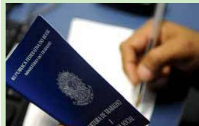
Há casos em que os representantes das categorias comunicam com poucos dias de antecedência o local e horário para formalização do cancelamento.

Sensação térmica: 33/24° Ventos: 15 km/h UV: 8 muito alto