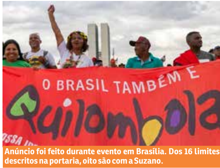
Anúncio foi feito durante evento em Brasília. Dos 16 limites descritos na portaria, oito são com a Suzano.

"Tem um longo trajeto ainda", avalia, com base na resistência histórica da empresa em recuar seus monocultivos de dentro dos territórios qui-