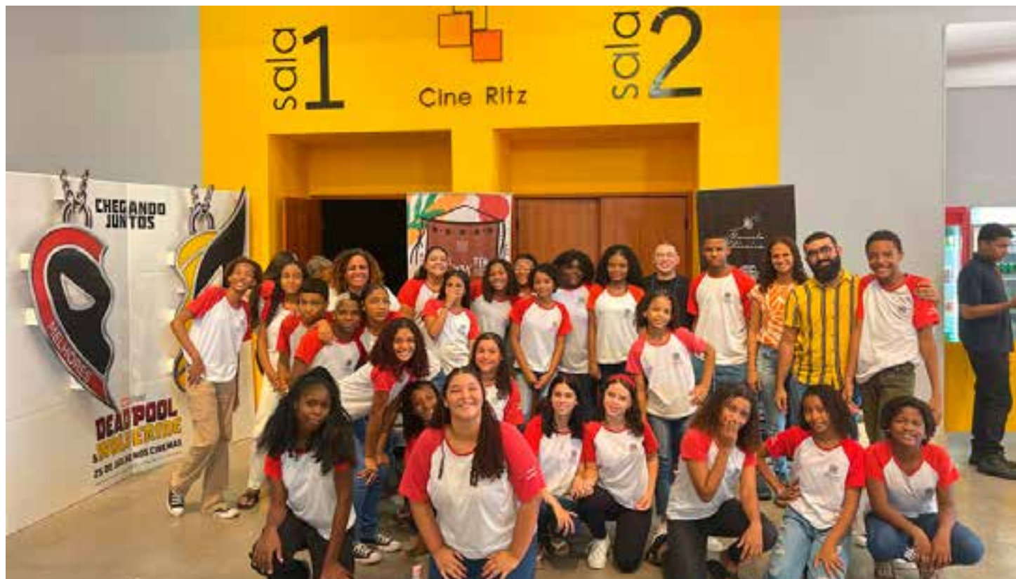
O documentário é fruto das oficinas e trabalhos realizados na Escola Estadual de Ensino Fundamental e Médio (EEEFM) Américo Silvares

Os estudantes se emocionaram com as palavras e imagens que conduziram a narrativa do documentário e que são o produto do trabalho desenvolvido por eles próprios, fortalecendo seu pertencimento e sua identidade.