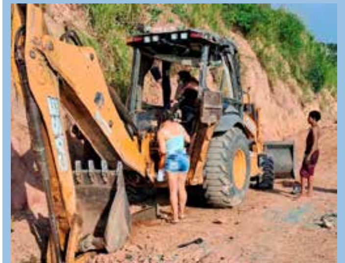
Em imagens enviadas por internautas, é possível observar que a parte frontal dos dois carros foi completamente destruída.

A Polícia Militar e o Samu foram acionados para a ocorrência, que segue em andamento.