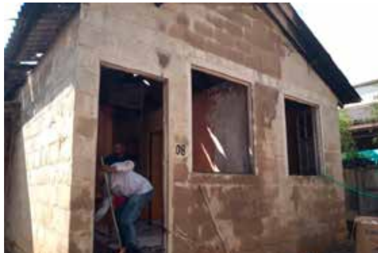
O Corpo de Bombeiros foi acionado e conseguiu conter o incêndio.