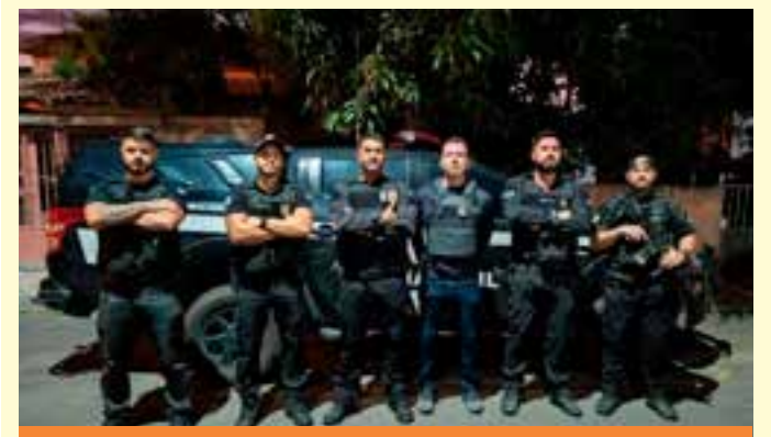
Durante a diligência, a equipe policial se dirigiu até a residência do suspeito, situada no bairro Lago dos Cisnes.

“Eles dizem que o produto que o consumidor queria já foi vendido, mas que pode pegar uma carta que compra o produto no valor que quiser. Eles vão induzindo a pessoa, que acaba assinando a entrada. Eles prometem que vão entregar o bem, depois o consumidor volta no local, eles revelam que era um consórcio, que não estava assegurado”, explicou o delegado, em julho.