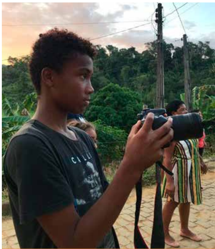
A realização é do Instituto Marlin Azul, com o apoio da Comunidade Quilombola do Linharinho.

O Cine Quilombola é um projeto de fortalecimento comunitário a partir do regis-