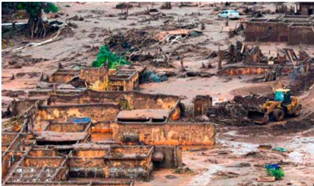
Documento enviado ao Tribunal Regional Federal da 6ª Região lista alterações significativas na proposta de repactuação.

Isso ocorreu, conforme explicou no comunicado enviado ao TRF6, porque o aumento do valor ofertado pelas empresas para financiar as medidas de reparação foi feito em conjunto com uma redução drástica nas obrigações que as mineradoras já haviam concordado em assumir durante as negociações.