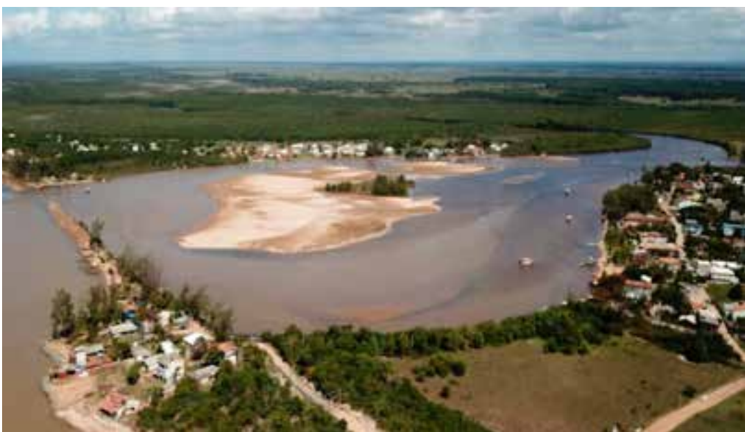
A festa é realizada pela Associação de Moradores, Pescadores e Assemelhados de Barra Nova Norte, com apoio da Prefeitura de São Mateus.

Barra Nova é um dos pontos turísticos de São Mateus, forte atrativo de pescadores amadores que contam com praia paradisíaca e uma colônia de pescadores. O lugar promete tranquilidade e belas paisagens para os turistas em geral. Distante 25 km do balneário de Guriri, Barra Nova Norte oferece diversas opções de hospedagem, de pousadas, casas para alugar e camping.