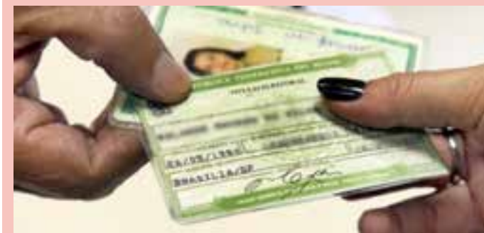
Eleitor que não estiver em dia com as obrigações eleitorais pode ter dificuldades para emitir documentos como passaporte e fazer matrículas em universidades.

Antes de se dirigir a uma unidade eleitoral, é recomendado que o eleitor consulte o Tribunal Regional Eleitoral (TRE) do estado para confirmar se é necessário agendar o atendimento presencial, pois as vagas de atendimento presencial são limitadas conforme a capacidade de cada cartório eleitoral. O interessado também poderá conferir os horários de atendimento e se há exigência de documentos adicionais.