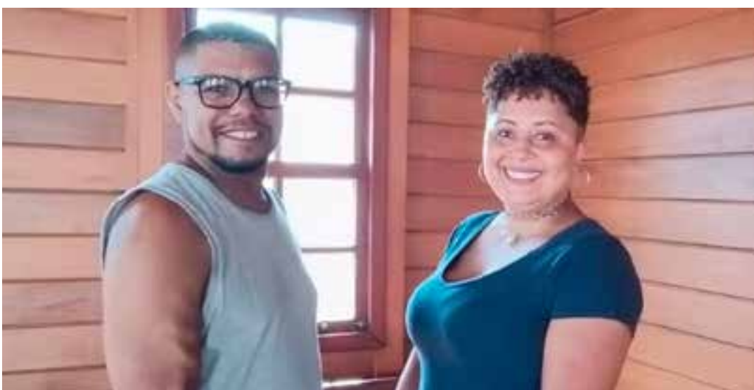
Essa foi a segunda cirurgia de transplante renal intervivo do HEVV em 2024.