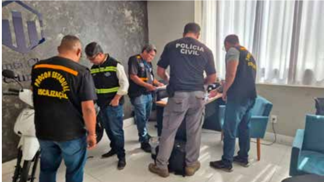
Ação realizada nesta quinta-feira (2) apreendeu uma máquina de choque, que, segundo apontam as investigações, era usada para intimidar clientes.

“Tiram essas imagens da internet, de outro anúncio, e colocam como foto de venda. Nesse anúncio, colocam especificamente que facilitam pessoas negativadas, para induzir o consumidor a achar que aquele bem existe. Coloca um preço mais baixo e a pessoa entra em contato com a empresa. Quando entram em contato,