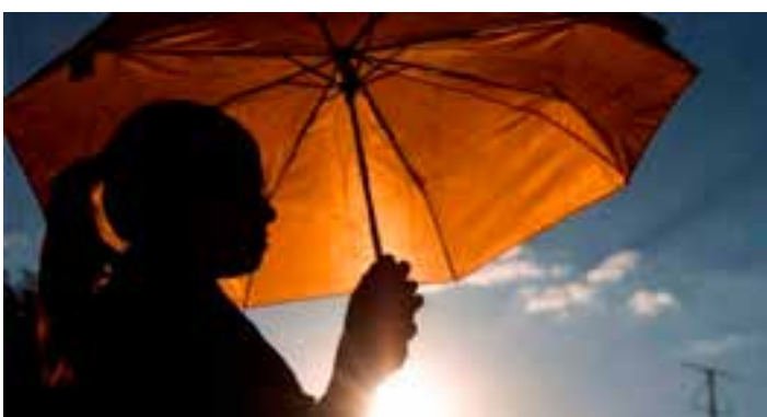
Confira a previsão para sexta-feira, sábado e domingo em todas as regiões do Espírito Santo.

Em Mantenópolis e Alto Rio Novo: mínima de 22°C e máxima de 32°C. Na Região Nordeste, sol entre poucas nuvens. Não há previsão de chuva.