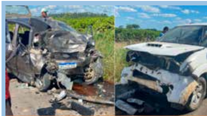
Em imagens enviadas por internautas, é possível observar que a parte frontal dos dois carros foi completamente destruída.

Criado em 1999, o Instituto Marlin Azul é uma associação sem fins lucrativos cuja finalidade é promover ações direcionadas à cultura, à arte e à educação, democratizando o acesso à produção e fruição de bens culturais. Em 25 anos de atividade, a instituição vem desenvolvendo diversos projetos sociais, culturais e audiovisuais voltados para diferentes públicos do Espírito Santo e do Brasil. Além do Cine Quilombola, a instituição desenvolve ações como o Revelando os Brasis, Projeto Animação, Curta Vitória a Minas, Griôs de Goibeiras, Memória do Barro, Cinema de Griô e o Cine Animazul. Para conhecer os projetos, acesse institutomarlinazul.org.br .