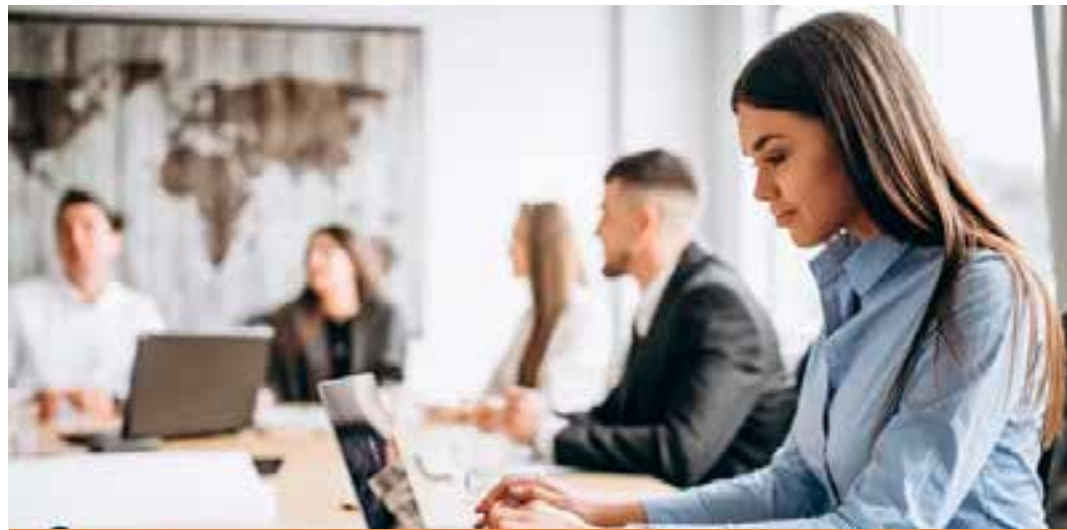
Pesquisa sobre o mercado revela também maior dificuldade para conciliar maternidade, e prevalência delas como vítimas de assédio.

As mulheres também aparecem como a parcela de gênero que mais sofre preconceito, discriminação ou assédio no ambiente de trabalho. Em 40% dos questionários delas, a resposta foi sim. Entre as respostas dos