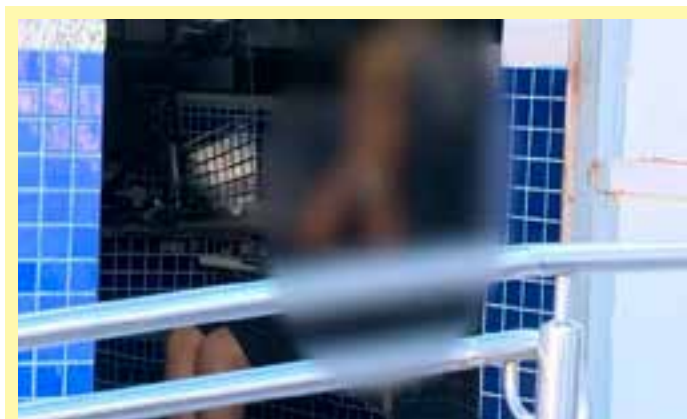
A criança foi levada ao Pronto Atendimento da Glória e precisou ficar internada para acompanhamento.

Segundo o Corpo de Bombeiros, uma equipe foi encaminhada ao local para atender a ocorrência. Os corpos das vítimas foram encaminhados para o Serviço Médico Legal (SML) de Linhares para serem necropsiados e depois liberados aos familiares.