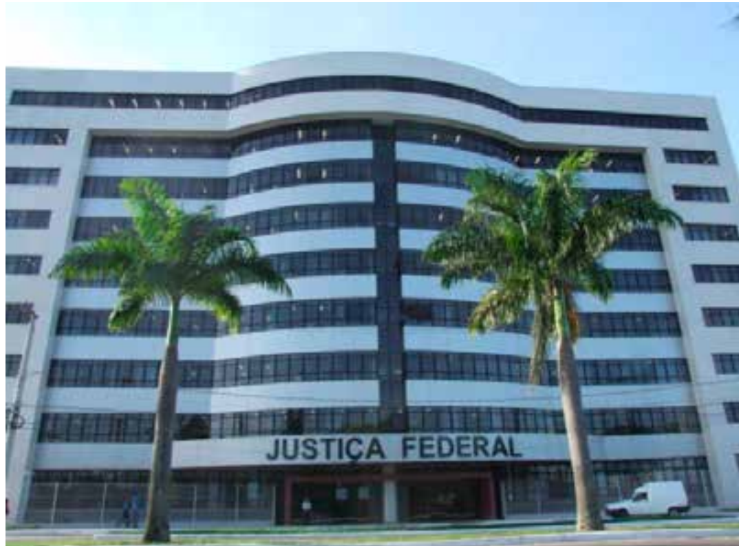
Os servidores recebem ainda auxílio-alimentação de R$ 1.393,10; inscrições podem ser feitas de 11 de abril a 10 de maio.

As provas objetiva e discursiva estão marcadas para 7 e 14 de julho. Haverá aplicação em 11 cidades: