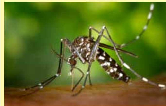
Apenas em Linhares, no Litoral Norte do Estado, foram 5 mortes pela doença.

Desde o dia 21 de fevereiro, o governo do Espírito Santo decretou estado de emergência. A medida visa a dar mais celeridade no combate à doença e a permitir um envio maior de recursos para o tratamento de pessoas infectadas. Atualmente, a cobertura vacinal no Estado é de 22,90% para primeira dose e de 0,08% para segunda. A meta é chegar em 90% em ambas as doses.