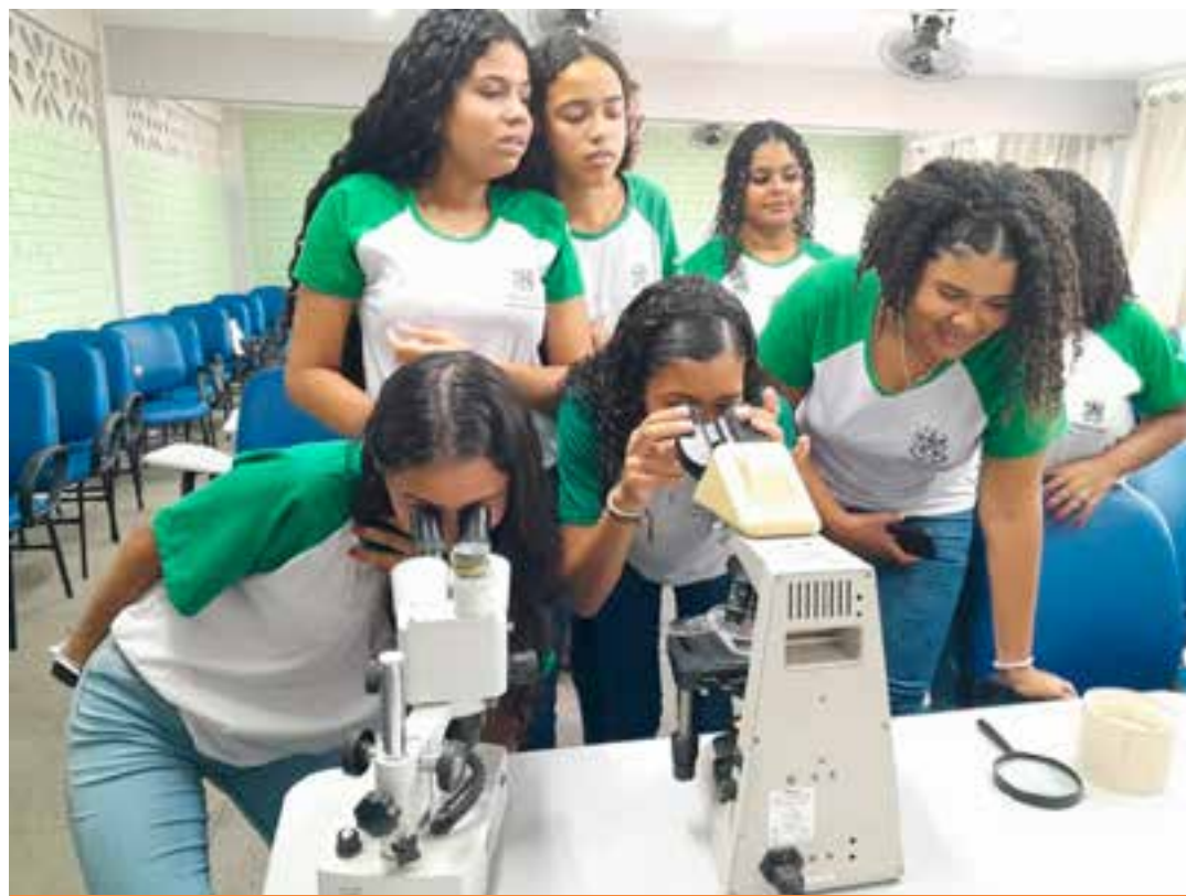
Objetivo foi alertar sobre necessidade do cuidado consigo e com os outros em relação à doença.

Os alunos também tiveram uma palestra com representantes da Vigilância em Saúde Ambiental de São Mateus. Depois de um diálogo participativo e reflexivo, deixaram uma missão: “pense, 10 minutos do seu dia, pode salvar a vida de quem você mais ama”.