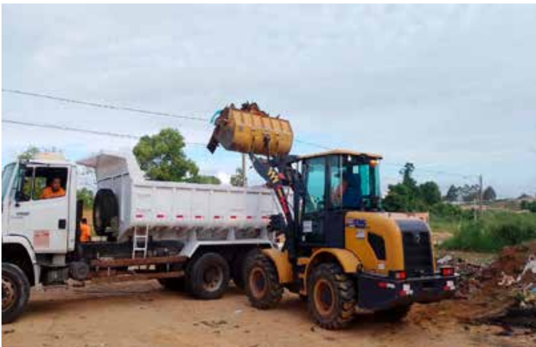
Nessa fase dos trabalhos, as equipes estão concentradas nos Bairros Alvorada e Nova São Mateus, nos acessos aos Bairros Vila Nova, Vila Verde, além do Bairro Boa Vista e SEAC.

O cronograma da Secretaria de Obras prevê que todos os bairros nas zonas urbanas, na sede e demais localidades do Município, receberão as equipes pelas próximas semanas.