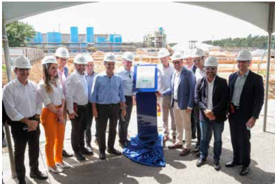
Serão contratados 300 trabalhadores para as obras, que devem ser concluídas em 2026. Outros 200 postos de trabalho, diretos e indiretos, também devem ser abertos.

Em Aracruz, serão produzidas 60 mil toneladas/ano de papel tissue, elevando para 340 mil toneladas anuais a capacidade instalada da