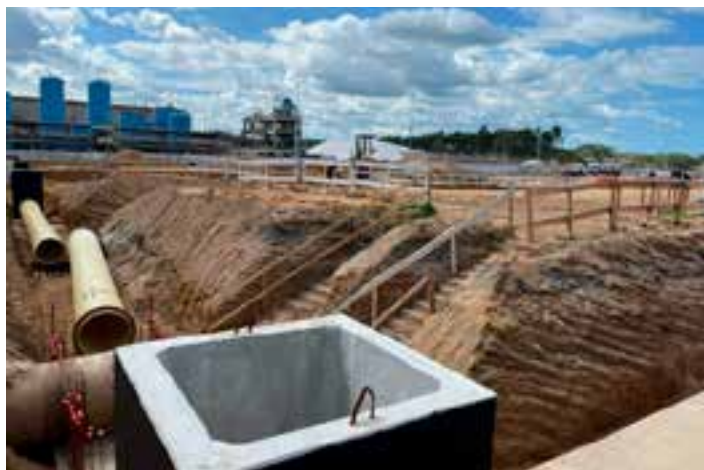
A empresa está investindo R$ 650 milhões no empreendimento que, além da produção de papel, também fará a sua conversão em papéis higiênicos, inserindo Aracruz no rol de municípios brasileiros com produção desses itens e agregando valor à cadeia produtiva.