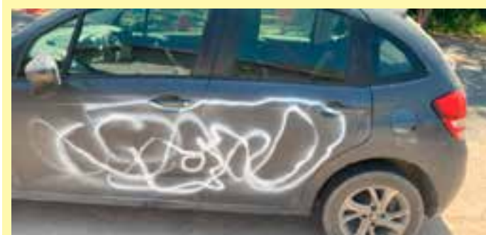
O mandante, o intermediário e o pichador serão indiciados pelos crimes de dano e perseguição, nos termos da Lei Maria da Penha.