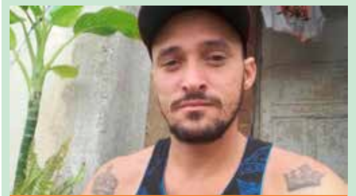
O detido foi conduzido à 18ª Delegacia Regional de São Mateus, onde foi dado cumprimento ao mandado de prisão temporária por homicídio.

O diretor ainda apresentou proposições de ações para fortalecimento do combate ao uso e circulação dos dispositivos eletrônicos de fumo no Brasil.