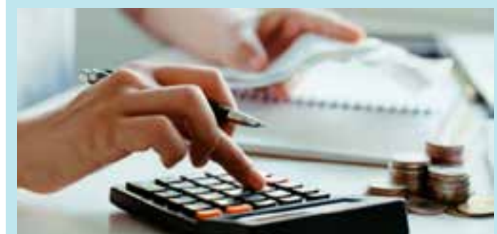
Na divisão por faixa de renda, em março, 90,6% das famílias capixabas com renda de até 10 salários mínimos tinham assumido algum tipo de compromisso financeiro.

No Brasil, o relatório da CNC mostrou que 78,1% das famílias afirmaram ter dívidas a vencer, o que significou um leve aumento de 0,2 p.p. em relação ao mês anterior. O percentual de inadimplentes em março foi de 28,1% ante 28,6% em fevereiro.