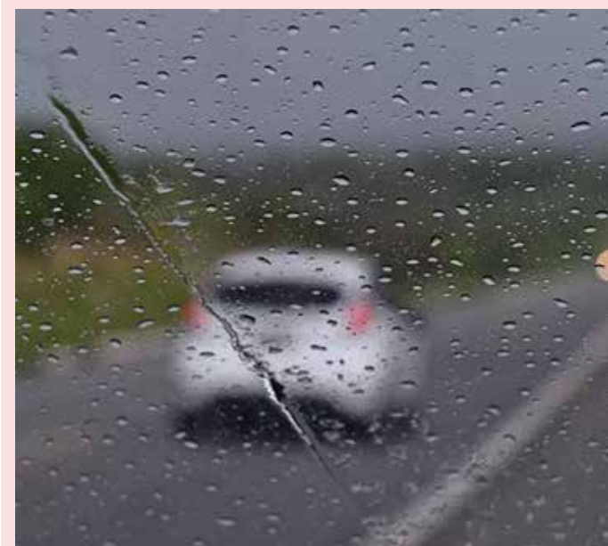
Uma frente fria no oceano vai deixar o tempo chuvoso nos próximos dias no Espírito Santo.

Domingo (21): a umidade trazida pelos ventos costeiros provoca chuva durante a madrugada e manhã entre a Grande Vitória e a Região Norte. Ao longo do dia, previsão de chuvas esparsas nas outras áreas do Extremo Norte. Poucas nuvens no restante do Estado, sem previsão de chuva. Os ventos ao longo da costa variam de fracos a moderados.