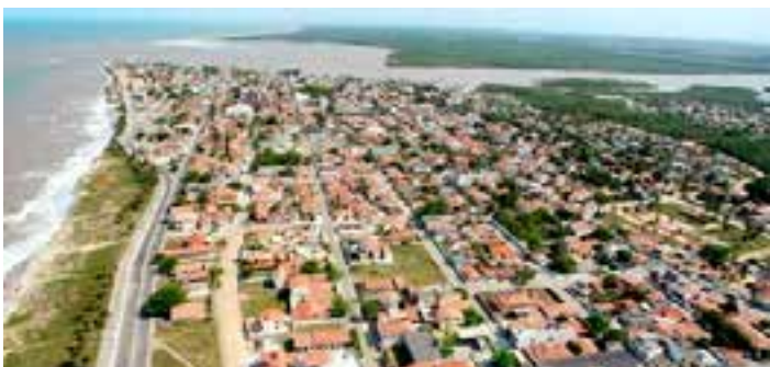
Em resumo, na Representação 1963/2024 é pontuada a existência de ilegalidades na LC 64/2022, pois foram geradas despesas não autorizadas, irregulares e lesivas ao patrimônio público.