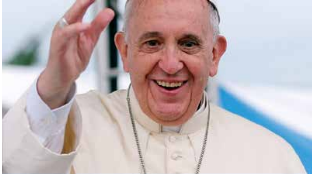
Documento assinado pelo Papa Francisco classifica a cirurgia de redesignação sexual, a ideologia de gênero, a barriga de aluguel, o aborto e a eutanásia como potenciais 'ameaças à dignidade humana'.

Ele já havia classificado a prática da barriga de aluguel como "desprezível" e a chamada ideologia de gênero — linha de pensamento que desafia a ideia de que a sexualidade humana é determinada pela biologia —