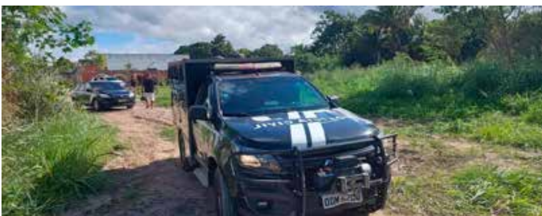
O corpo do homem de 20 anos tinha marcas de arma de fogo e foi localizado em uma área florestal que pertence a uma empresa privada de celulose.

A Polícia Civil informou que o caso seguirá sob investigação da Delegacia Especializada de Homicídios e Proteção à Pessoa (DHPP) de São Mateus, e que até o momento, nenhum suspeito foi detido. Informações podem ser compartilhadas de forma sigilosa por meio do Disque-denúncia (181). Essas informações podem ser cruciais para o avanço das investigações.