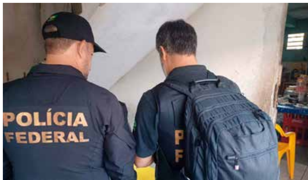
Segundo a PF, a operação tem como objetivo o combate a crimes praticados na internet.

Conforme a instituição, os crimes citados estão previstos nos artigos 241-A e 241-B da Lei nº 8.069/1990 (Estatuto da Criança e do Adolescente), com penas que somadas podem alcançar 10 (dez) anos de reclusão.