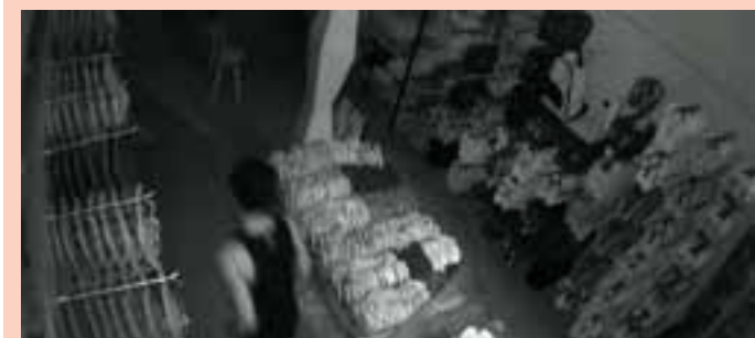
Nas imagens, é possível notar que o homem percebe que está sendo filmado, mas isso não o impede de cometer o crime.