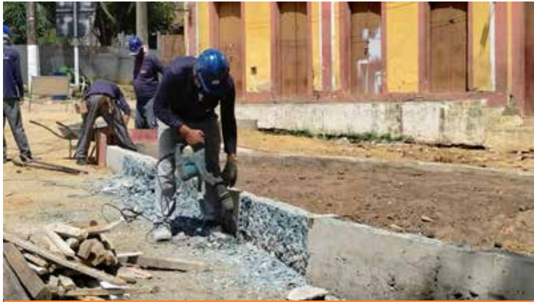
A parceria é com o Governo do Estado do Espírito Santo.

No todo, o projeto de revitalização inclui pavimentação de várias ruas no Sítio e no entorno, drenagem, desenhos das calçadas e travessias de pedestres, melhorias nas escadarias, melhorias na iluminação e definição de