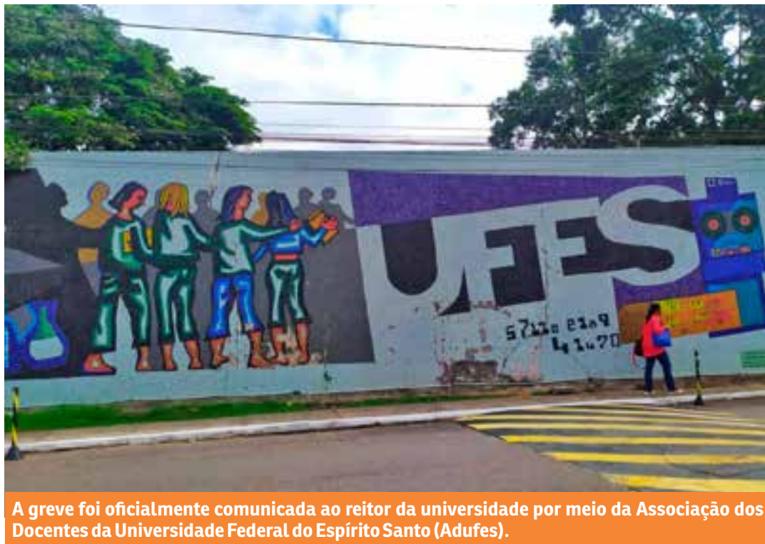
A greve foi oficialmente comunicada ao reitor da universidade por meio da Associação dos Docentes da Universidade Federal do Espírito Santo (Adufes).

As reclamações dos docentes passam pela falta de investimento nas universidades, além da falta de planos de carreira para professores e profissionais de