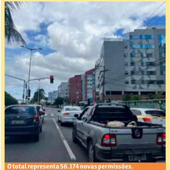
O total representa 56.174 novas permissões.

“Precisamos fazer reflexões e estudos integrados com toda a sociedade e os nossos legisladores. A educação no trânsito começa desde cedo, nas escolas. Mas é necessário criar mecanismos para que o direito de ir e vir seja preservado, havendo paz nas vias”, finalizou.