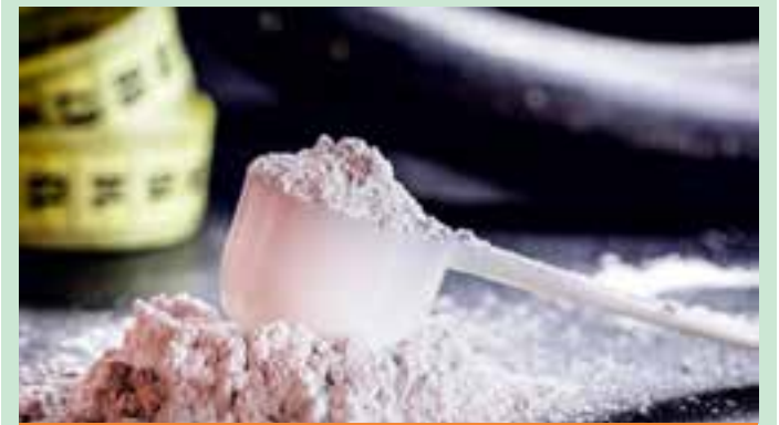
A creatina é usada por praticantes de atividades físicas e está se popularizando fora das academias devido aos seus benefícios à saúde.

O Cepe continua sua jornada no campeonato sem a participação de Nicolý. Três dias após a veiculação da matéria de A Gazeta, o torneio A Gazetinha publicou em suas redes sociais que ainda neste ano haverá uma versão feminina da competição.