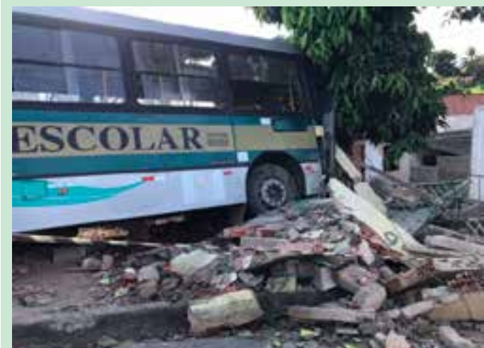
Um ônibus escolar desgovernado desceu uma ladeira e atingiu três imóveis no bairro Bonsucesso II, em São Mateus, no Norte do Espírito Santo.

A motivação do crime ainda é investigada.