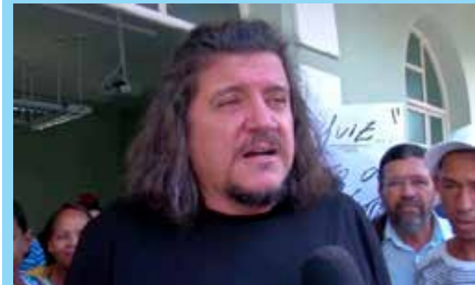
Prefeito de São Mateus chegou a ser preso em 2021, após PF desmantelar uma organização criminosa.

A decisão ministerial foi tomada com base em novas acusações protocoladas pelo Ministério Público Federal (MPF). No aditamento à denúncia, o MPF reportou mais crimes de corrupção (passiva e ativa), fraude em licitação e falsidade ideológica, além da associação criminosa.