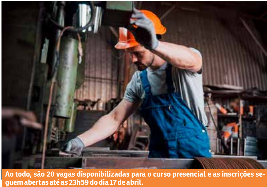
Ao todo, são 20 vagas disponibilizadas para o curso presencial e as inscrições seguem abertas até as 23h59 do dia 17 de abril.

so seletivo, o candidato deverá ter idade mínima de 16 anos, completados na data de lançamento do edital, ter documento de identificação e ter