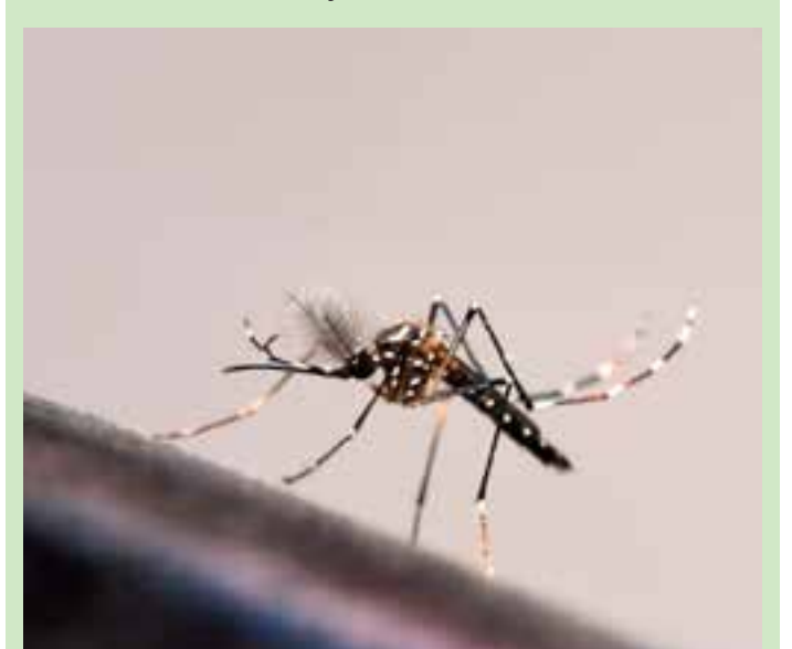
Grande Vitória concentra o maior número de casos e Linhares, na Região Norte, é a cidade capixaba com mais óbitos confirmados.