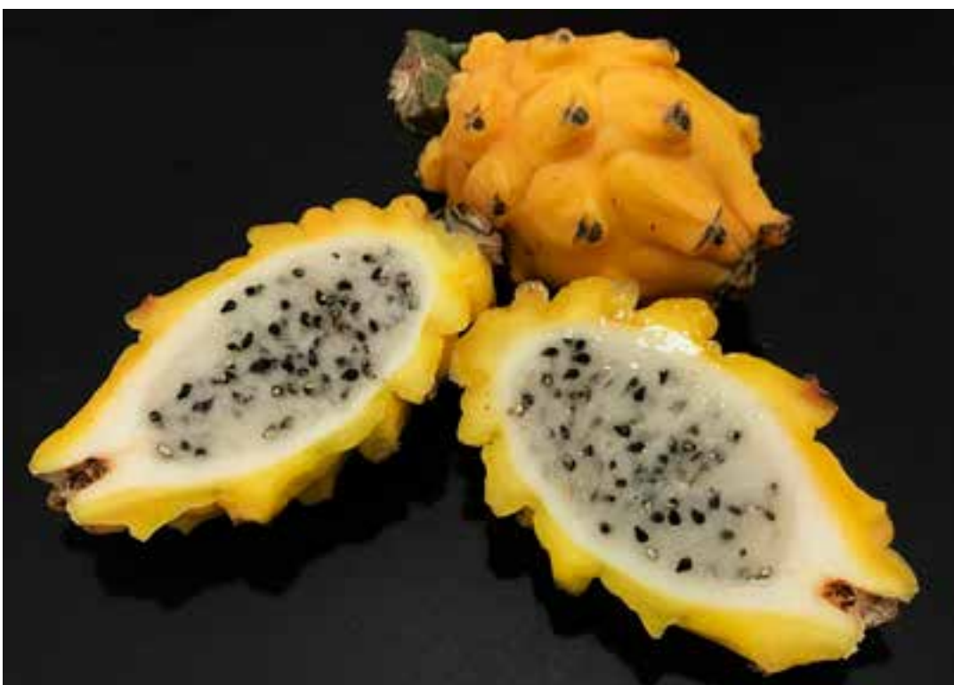
Muitas pessoas consideram essa fruta insossa ou sem graça. Mas a de pitaya conhecida por seu sabor doce e delicioso é daqui do Brasil!

A pitaya, além de ser uma fruta saborosa, é rica em nutrientes, como vitaminas B, C, E, fósforo, minerais e ferro. Ela também é conhecida por sua concentração de fibras, que auxiliam na digestão e na saúde intestinal. As informações são do G1.