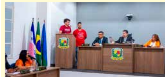
A CPI foi aprovada por unanimidade na sessão ordinária realizada no dia 25 de março.

Representantes da concessionária chegaram inclusive a participar de reuniões no Parlamento na atual legislatura. Embora convidado e posteriormente convocado pela Câmara, o gestor da secretaria responsável pela fiscalização da concessão não compareceu para dar explicações ao Poder Legislativo.