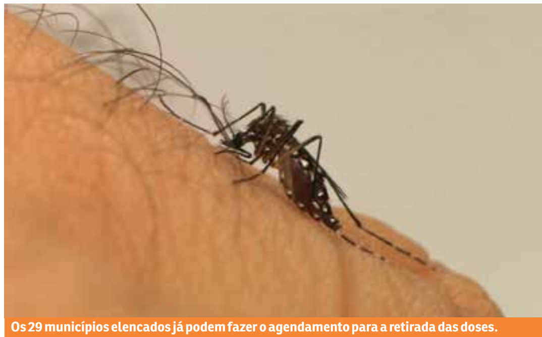
Os 29 municípios elencados já podem fazer o agendamento para a retirada das doses.

No último dia 28 de março, o Ministério da Saúde divulgou, por meio da Nota Técnica Nº 37/2024, a inclusão desses municípios à campanha, diante da estratégia de distribuição de novas doses que serão encaminhadas aos estados em data ainda não definida. Por meio de uma estratégia estadual, visando a uma maior celeridade para a cobertura vacinal da população-alvo e à otimização das doses remanescentes, a Sesa autorizou o remanejamento de