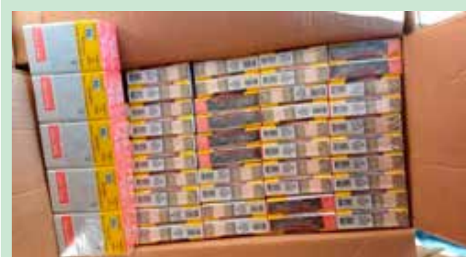
A apreensão aconteceu na manhã desta sexta-feira (05). A carga seria transportada até o município de Mucurici, na região Noroeste do Estado.

Até esta quinta-feira (04), 28.476 doses já haviam sido aplicadas na população-alvo, representando uma cobertura de 19,54% (referente à população dos 23 municípios da Região Metropolitana de Saúde). A meta vacinal é de 90%.