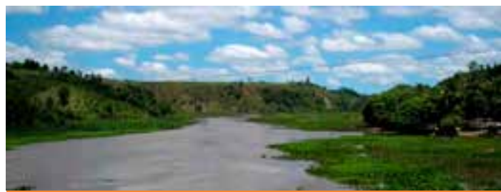
Procurada pela reportagem, a Polícia Civil informou, em nota, que o caso foi registrado como morte a esclarecer.

foi encaminhado ao Serviço Médico Legal (SML) de Linhares para ser identificado e para ser feito o exame cadavérico. Apenas após os exames será possível confirmar a causa da morte.