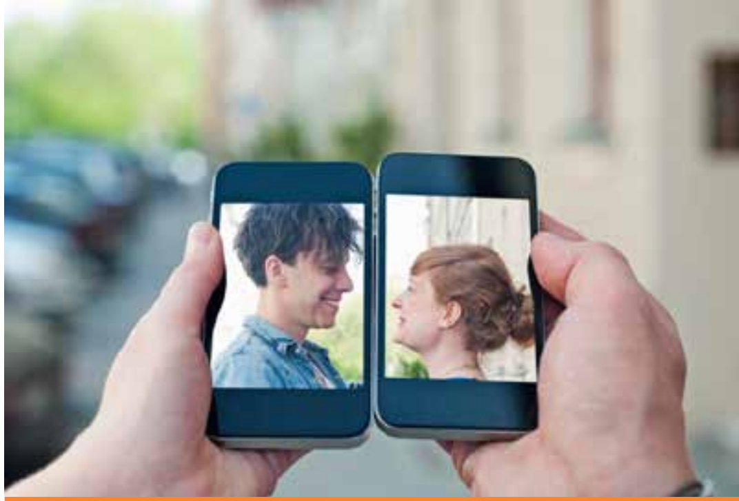
De acordo com pesquisa realizada por um aplicativo de namoro, os jovens estão procurando agilizar o processo de namoro com a tecnologia.

A principal razão para isso, segundo a expert em relacionamentos, é a economia de dinheiro em transporte e comida. “Os usuários dessa faixa etária simplesmente não ligam para isso [dates virtuais] e dizem que é eficiente e ótimo. Você pode bater um papo rápido e ver se há aquela