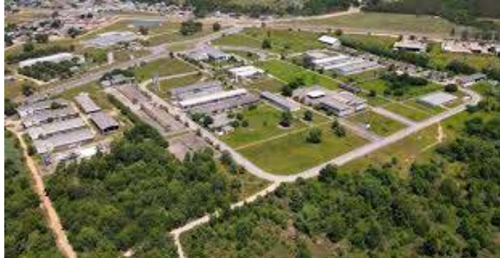
Na pauta, levantamentos com vistas ao processo de implantação de curso de Medicina no Ceunes. Segundo a Prefeitura de São Mateus, a visita representa “mais uma etapa sendo cumprida” nesse processo.

SÃO MATEUS – Membros da Comissão de Avaliação e Monitoramento das Escolas de Medicina (Camem) a serviço da Secretaria de Ensino Superior (Sesu) do Ministério da Educação (Mec) estão em São Mateus para visita técnica ao Centro Universitário Norte do Espírito Santo (Ceunes) da Universidade Federal do Espírito Santo (Ufes). Na pauta, levantamentos com vistas ao processo de implantação de curso de Medicina no Ceunes. Segundo a Prefeitura de São Mateus, a visita representa “mais uma etapa sendo cumprida” nesse processo.