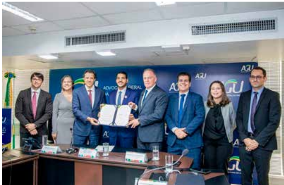
Segundo o Supremo Tribunal Federal, o Espírito Santo pagou ao governo federal valores a mais referentes à antecipação dos royalties firmada em 2003.

Na cerimônia, Casagrande afirmou que o acordo só foi possível por conta das negociações com o governo federal e que o Espírito San-