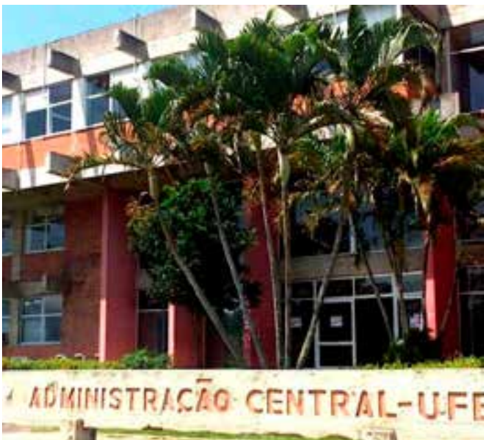
A Universidade Federal do Espírito Santo anunciou quatro seleções para atuação em diversas áreas. Saiba como participar da seleção.

Talvez, diante de um povo tão perplexo, sofrido e carente de justiça, devêssemos, enquanto autoridades, à vista deste episódio, prestar menos atenção às assessorias, reclamar menos da imprensa e, principalmente, recordar que um cargo não faz um homem, e sim o inverso.