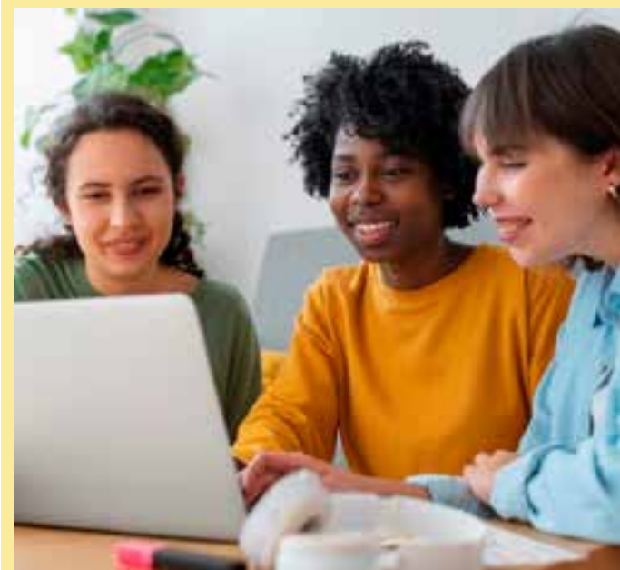
As inscrições podem ser feitas a partir desta sexta-feira (08) e seguem até as 23h59 do próximo dia 20.

Datas de inscrição: De 08/03 até 20/03 Resultado: 23/03 Informações adicionais: qualificar.es.gov.br/fale-conosco Inscrições: qualificar.es.gov.br/