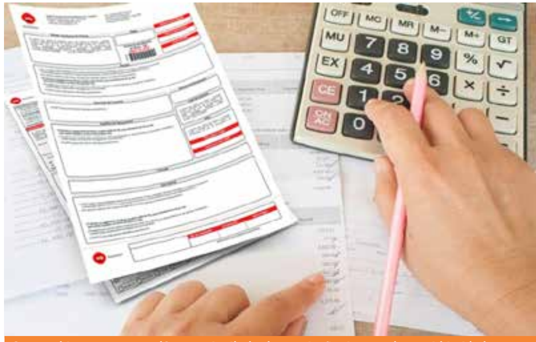
Consumidores pagam tarifa quando diminui a produção de energia nas hidrelétricas e as usinas termelétricas, mais caras, têm de ser acionadas.

"O nosso intuito é aproximar os talentos e as empresas da região, impulsionar carreiras e também fortalecer a comunidade local. A plataforma vai desde a ofer-