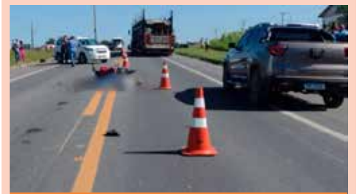
O nome e a idade da vítima não foram divulgados. A pista está parcialmente interditada em decorrência do acidente.