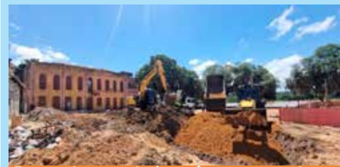
Empresa de meteorologia prevê uma nova zona de convergência e quatro frentes frias, que não serão suficientes para diminuir o calorão no território capixaba.

Numa área específica, dentro do perímetro das intervenções, foram encontrados artefatos comprovadamente datados do século XIX e materiais ainda mais antigos, que estão sendo analisados em laboratório para precisar a que período pertencem. Nesta área, que foi delimitada e protegida, estão sendo realizados estudos arqueológicos, que avançam paralelamente aos demais trabalhos, informou a Prefeitura.