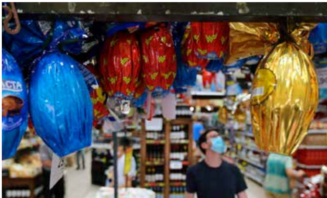
O período é um dos mais esperados do ano não apenas para as lojas, mas também para quem procura uma recolocação no mercado de trabalho.