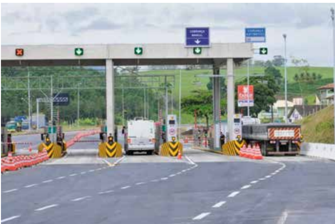
As concessionárias responsáveis pelas operações, sob gestão e fiscalização da ANTT (Agência Nacional de Transportes Terrestres), terão até 90 dias para se adequar às mudanças.

A quantidade de cabines que aceitarão as novas modalidades de pagamento em cada praça será definida pela própria ANTT. Enquanto as concessionárias se adequam, o pagamento em dinheiro permanece como opção para o usuário.