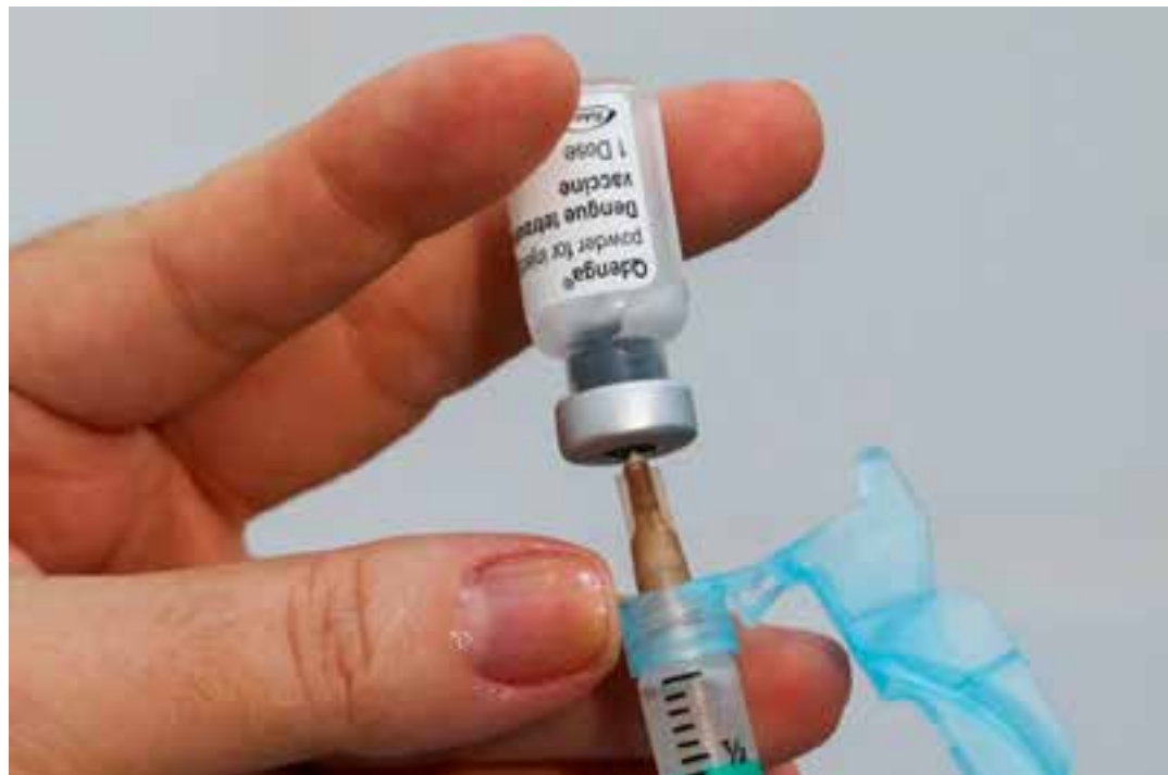
Com isso, o grupo de 10 a 14 anos, formado por 145.718 crianças, poderão ser protegidas contra a doença. O objetivo da pasta é aumentar a cobertura vacinal.

foram aplicadas 11.840 doses da vacina contra a dengue. Isso representa uma cobertura de 20,23% da população de 10 a 11 anos residentes da região Metropolitana de Saúde, de um total de 58.525 crianças. Com a ampliação, ao todo serão contempladas 145.718 crianças de 10 a 14 anos.