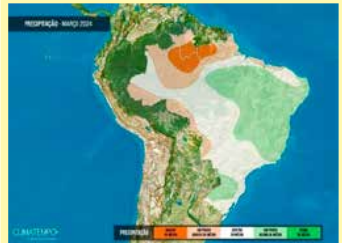
Empresa de meteorologia prevê uma nova zona de convergência e quatro frentes frias, que não serão suficientes para diminuir o calorão no território capixaba.

Isso significa que o ar frio de origem polar, que vem naturalmente com as frentes frias, não vai conseguir avançar pelo interior do Brasil para provocar queda de temperatura relevante. Para o Espírito Santo está previsto calor um pouco acima da média do mês.