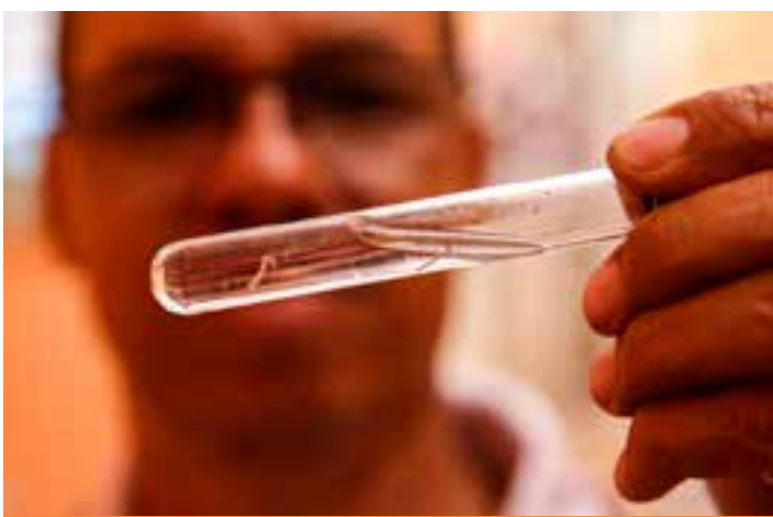
Casos mais que dobraram na semana epidemiológica 8, quando foram registrados 12.900 possíveis casos da doença. Na semana anterior, notificações não passaram de 6.230.