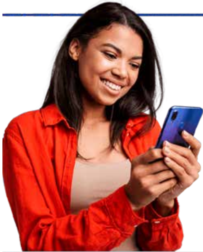
Uma iniciativa da Bússola Hub e Suzano, o Bússola Conecta promete aproximar profissionais e empresas da região.

ma democrática, atendendo todas as demandas e necessidades. Permite o cadastro de todos os perfis profissionais e proporciona oportunidades para todos: aqueles que estão ingressando no mercado de trabalho e os profissionais mais experientes. As empresas utilizam a ferramenta de forma estratégica, para identificar talentos e otimizar a busca por candidatos qualificados.