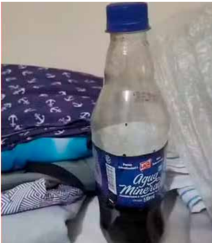
De acordo com a Polícia Civil, a suspeita, de 53 anos, fez a vítima assinar uma procuração uma semana antes do crime que a tornava beneficiária direta em caso de morte.

MAIS NOTÍCIAS MAIS INFORMAÇÃO MAIS ACESSADO NOROESTE E NORTE DO ES