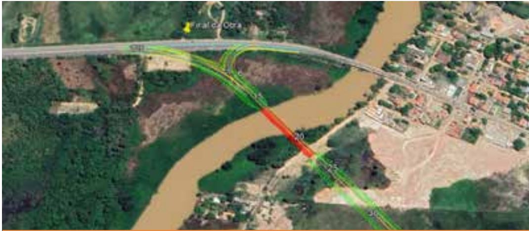
O encontro aconteceu na noite desta segunda-feira (26), em Guriri. A exposição do projeto foi feita pelo próprio Freitas e por engenheiros da empresa que vai realizar a obra.

SÃO MATEUS – O Departamento de Edificações e de Rodovias do Espírito Santo (DER-ES) reuniu moradores, comerciantes e lideranças de diversos municípios do norte capixaba para discutir o projeto de implantação da Rodovia ES-318, o Contorno de São Mateus. O encontro aconteceu na noite desta segunda-feira (26), em Guriri. A exposição do projeto foi feita pelo próprio Freitas e por engenheiros da empresa que vai realizar a obra.