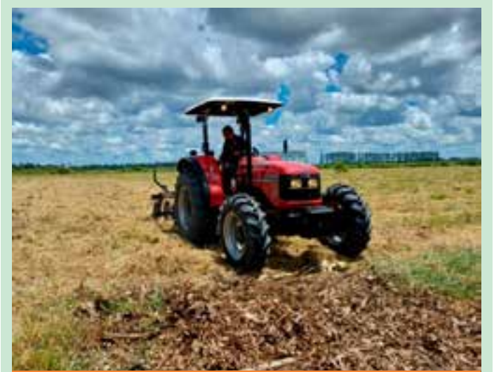
A iniciativa prevê a produção agrícola e o aproveitamento das áreas produtivas dos complexos prisionais do Estado, com a utilização de mão de obra de detentos.

Sobre a Suzano - A Suzano é a maior produtora mundial de celulose, uma das maiores produtoras de papéis da América Latina, líder no segmento de papel higiênico no Brasil e referência no desenvolvimento de soluções sustentáveis e inovadoras a partir de matéria-prima de fonte renovável. Nossos produtos e soluções estão presentes na vida de mais de 2 bilhões de pessoas, abastecem mais de 100 países e incluem celulose; papéis para imprimir e escrever; papéis para embalagens, copos e canudos; papéis sanitários e produtos absorventes; além de novos bioprodutos desenvolvidos para atender a demanda global. A inovação e a sustentabilidade orientam nosso propósito de "Renovar a vida a partir da árvore" e nosso trabalho no enfrentamento dos desafios da sociedade e do planeta. Com 100 anos de história, temos ações nas bolsas do Brasil (SUZB3) e dos Estados Unidos (SUZ). Saiba mais na página www.suzano.com.br