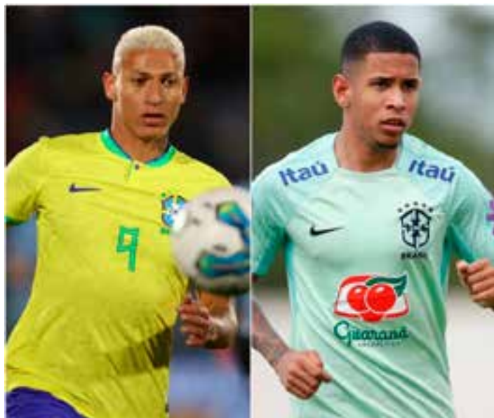
Os atacantes Richarlison, do Tottenham, e Savinho, do Girona, foram chamados por Dorival Júnior. Última vez havia sido em 2000, com Carlos Germano e Sávio.

Agora, Richarlison e Savinho tem a missão de representar o Estado nas próximas partidas com a Amarelinha. O primeiro é velho conhecido da torcida brasileira. Foi o centroavante da Seleção na Copa do Mundo do Catar, em 2022, e é figura carimbada nas convocações.