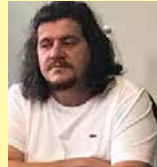
Prefeito de São Mateus vai pagar multa pelo uso do serviço de trenzinho e distribuição de picolés e pipocas em evento eleitoral.

O prefeito atuou como um dos organizadores das campanhas de reeleição de