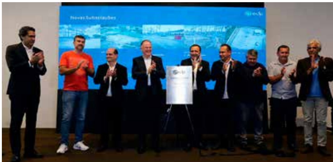
A solenidade realizada no Palácio Anchieta, em Vitória, teve a presença do CEO da EDP Brasil, João Marques da Cruz, além de prefeitos e outras autoridades.

Também foram inauguradas quatro usinas solares de geração distribuída, com capacidade instalada de 25 MWp. Com investimento de R$ 100 milhões, os empreendimentos estão localizados nos municípios de Pedro Canário, São Mateus, Boa Esperança e Sooretama, e devem