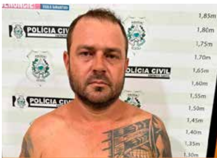
Segundo a Polícia Civil, o detido tinha envolvimento com diversos crimes e possui registros na polícia há mais de 20 anos, entre eles, tentativa de homicídio de policiais e explosão de carro-forte.

A ficha criminal do criminoso é extensa e começa em 2002. Ele tem envolvimento com diversos delitos, como furto qualificado, roubo qualificado, tráfico de drogas, organização criminosa, porte de arma de uso restrito, invasão de terra e roubo de