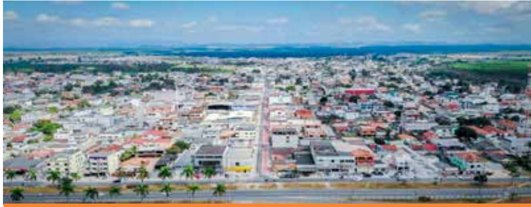
Vítima morreu no dia 19 de janeiro, mas resultado da investigação foi divulgado pela Secretaria de Estado da Saúde somente nesta semana.

Ele recebeu atendimento, com os procedimentos neces-