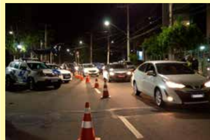
Flagrantes ocorreram durante a Operação Carnaval, realizada pelo Detran-ES e pelo Batalhão de Trânsito.

Caso o condutor apresente sinais claros de embriaguez, também vai arcar com as penalidades criminais e será conduzido à delegacia.