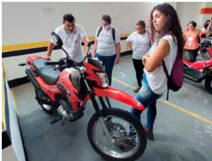
A formação é totalmente gratuita, organizada e realizada pelo Detran|ES em parceria com empresas parceiras.

O curso tem como objetivo proporcionar às mulheres o conhecimento necessário para que resolvam problemas corriqueiros em seus veículos, tais como compreender os principais indicadores do painel de instrumentos, noções básicas de verificação do motor, dos freios e fluidos, além de dicas de condução econômica e cuidados diários. Essa iniciativa também tem o intuito de incentivar a independência e sensação de segurança para quem depende de ajuda externa para resolver contratemplos nos seus veículos.