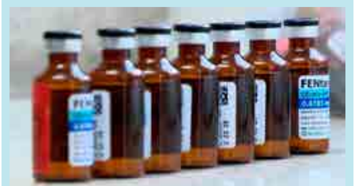
Suspeito de 29 anos trabalhava há quatro meses no Hospital da Associação Funcionários Públicos do Espírito Santo.

Ela ressaltou ainda sobre a importância de ter cursado o EJA, afirmando que não se trata apenas de concluir os estudos, mas sim o início de um caminho que proporcionará passos capazes de transformar a vida dela.