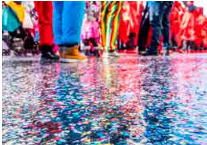
O calor típico do verão deve continuar em fevereiro, segundo o Instituto Nacional de Meteorologia (Inmet).

Calor: O mês será de calor principalmente no interior de São Paulo e no extremo leste