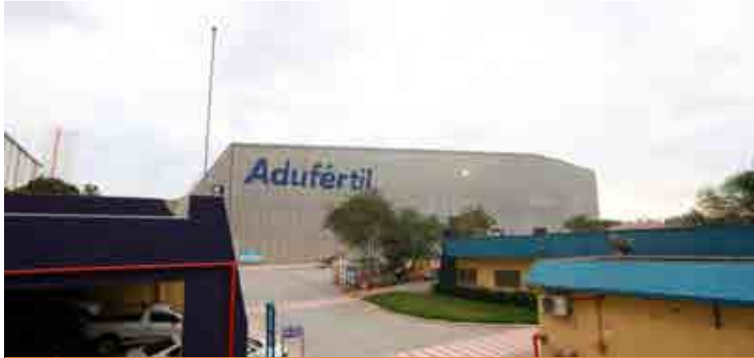
“Em conjunto com a Adufertil, o terminal passará a operar fertilizantes, uma das principais commodities do país”, destaca Portocel em comunicado.

A Adufertil vai instalar uma fábrica misturadora em uma área de aproximadamente 90 mil m2, mapeada para expan-