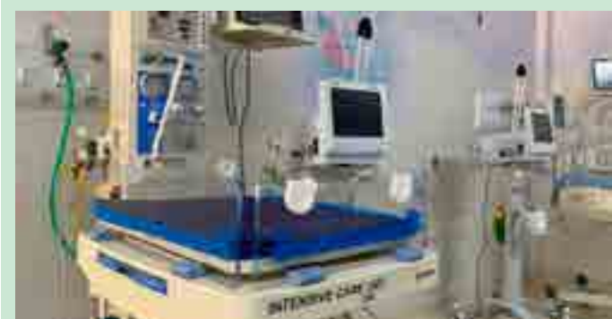
O serviço funcionará por meio de convênio do hospital com a Sesa, que contratou os leitos e investiu R$ 11.477.160 para a reforma e a ampliação da Maternidade

Com a contratualização dos leitos, o Hospital Maternidade São Mateus passou a ser a referência para dez municípios da regional Norte de Saúde, com as exceções de Jaguaré, que continuará com atendimento no Hospital Rio Doce; e Água Doce do Norte, Barra de São Francisco e Ecoporanga, que a referência continua o Hospital São José.