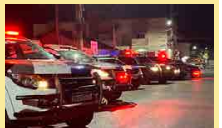
Em relação a 2023, ano com o menor número de homicídios da série histórica, o Estado começa 2024 com redução de 19,8%, com 19 mortes a menos.

“No Espírito Santo ainda temos essa cultura machista que impera, e ainda nos leva a registrar feminicídios. Estamos com todas as nossas ferramentas disponíveis para essas mulheres que sofrem com a violência doméstica e, naqueles casos que, infelizmente, não conseguimos evitar, nosso aparato policial está de prontidão para investigar e evitar a impunidade o mais célere possível”, frisou o secretário de Estado da Segurança Pública e Defesa Social.