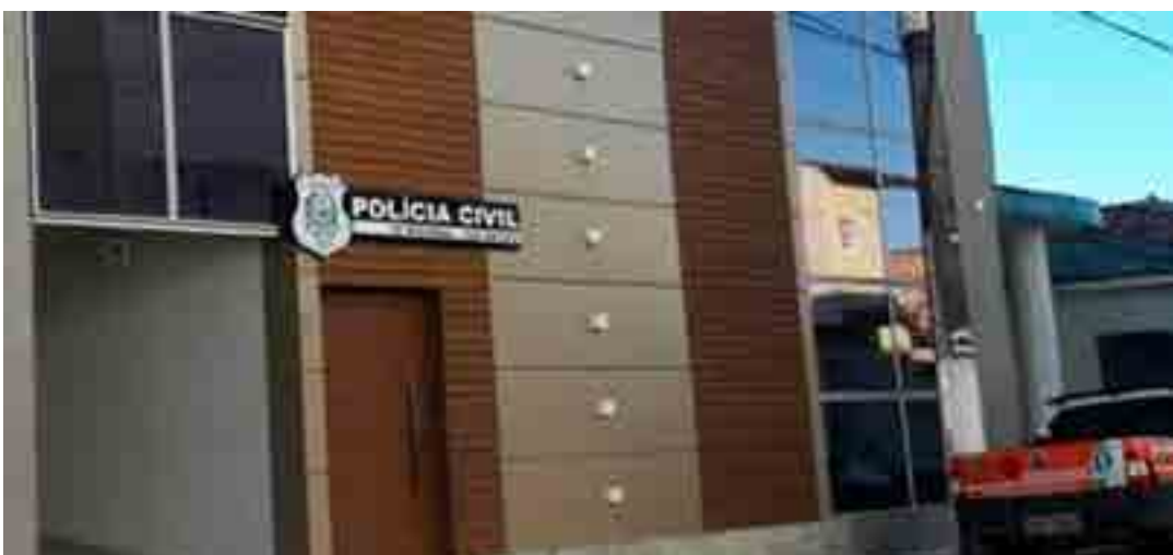
Após o interrogatório, o indivíduo foi encaminhado ao Centro de Detenção Provisória (CDP) de São Mateus.

“A população tem um papel importante nas investigações e pode contribuir com informações de forma anônima através do Disque-Denúncia 181, que também possui um site onde é possível anexar imagens e vídeos de ações criminosas, o disquedenuncia181.es.gov.br. O anonimato é garantido e todas as informações fornecidas são investigadas”, finalizou a corporação.