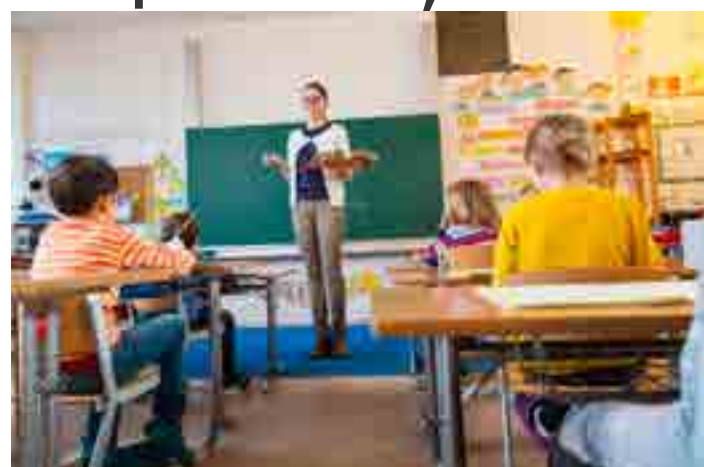
Reajuste de 3,6% é válido para professores que lecionam na rede pública de ensino, com uma jornada de, no mínimo, 40 horas por semana.

O piso salarial, que é o valor mínimo que determinada categoria profissional deve ganhar, é definido pelo governo federal, mas os salários são pagos pelas prefeituras e pelos