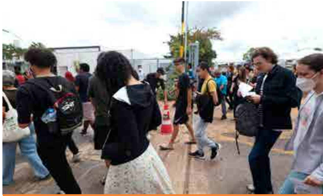
Edital com o número de vagas serão publicados em janeiro de 2023.

As inscrições para o Prouni serão abertas no dia 28 de fevereiro e vão até o dia 3 de março. Já as inscrições para o Fies te-