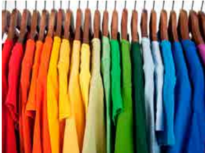
As cores são muito importantes em nosso dia a dia. Elas podem impactar diretamente o nosso humor, estado de espírito e pensamentos.

Geminianos são agitados, falantes, altamente curiosos, atenciosos e um pouco inquietos. Eles são extremamente perspicazes e nunca se perdem com as palavras. Por natureza, eles são sociáveis ??e fazem os outros se sentirem à vontade. Amarelo é brilhante alegre e ener-