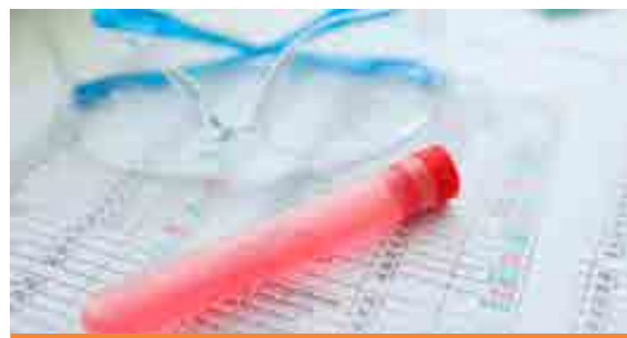
A exigência do exame foi inserida no Código de Trânsito em 2020 por meio de lei sancionada em outubro daquele ano.

Se o condutor descumprir a regra, será punido por infração gravíssima, com multa e suspensão do direito de dirigir por 3 meses.