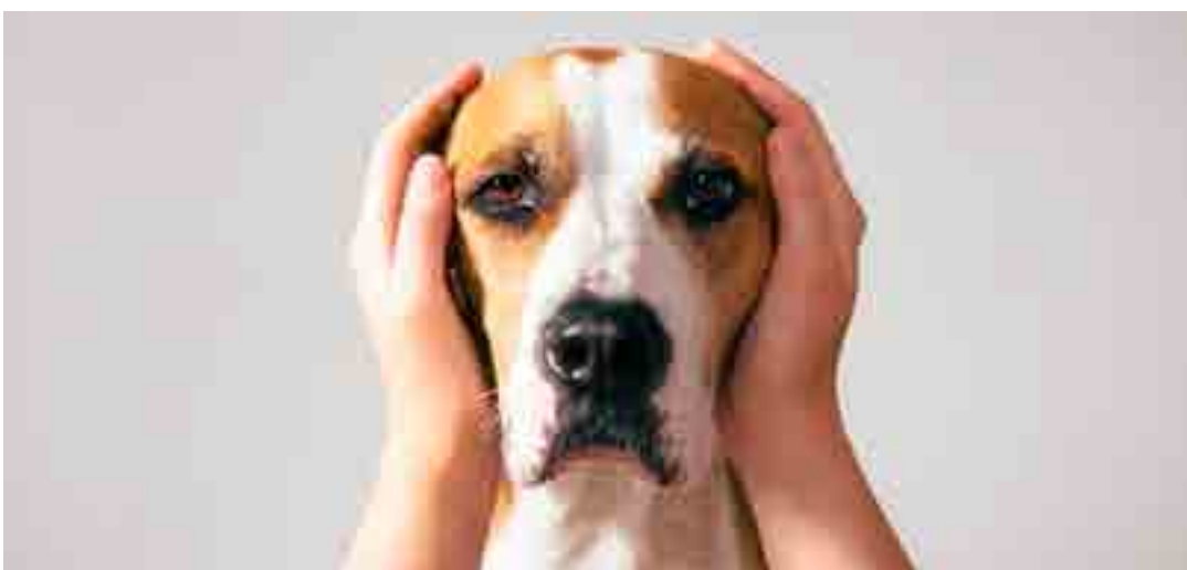
Os foguetes causam pânico e podem trazer graves problemas para a saúde do seu bichinho de estimação.

As informações divulgadas foram entregues hoje (28) ao TCU para fins de cálculo de distribuição do Fundo de Participação dos Municípios (FPM), feita de acordo com o número de habitantes. A tabela com a prévia da população para cada município será publicada no Diário Oficial da União (D.O.U.). A nota metodológica e as estimativas das populações para os 5.570 municípios brasileiros e para as 27 unidades da federação podem ser consultadas aqui.