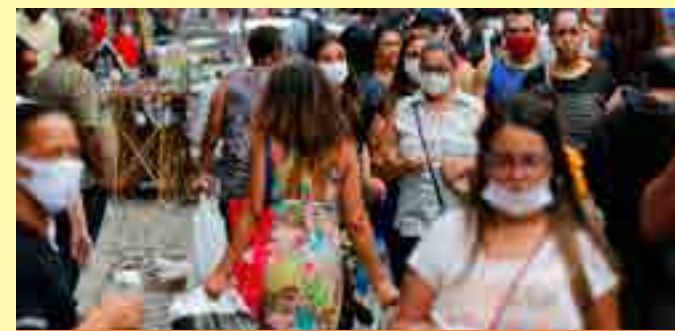
O IBGE divulgou nesta quarta-feira (28) a prévia da população dos municípios com base nos dados coletados pelo Censo Demográfico 2022 até o dia 25 de dezembro.