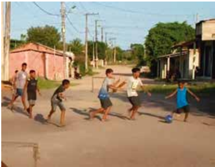
Não possui rede de esgoto, as ruas não têm calçamento, portanto, são esburacadas e quando não enfrentam a poeira, os moradores têm que encarar as consequências da chuva, com a lama que se forma.

rua com risco de sofrer qualquer tipo de acidente, conforme revela o senhor Vander, presidente da Associação de Moradores que já cansou de ir à prefeitura tentar uma audiência com o prefeito Daniel Santana, para pedir alguma ajuda. “O jeito agora é reunir os moradores e irmos para a porta da prefeitura ver se o prefeito nos atende”, avisou.