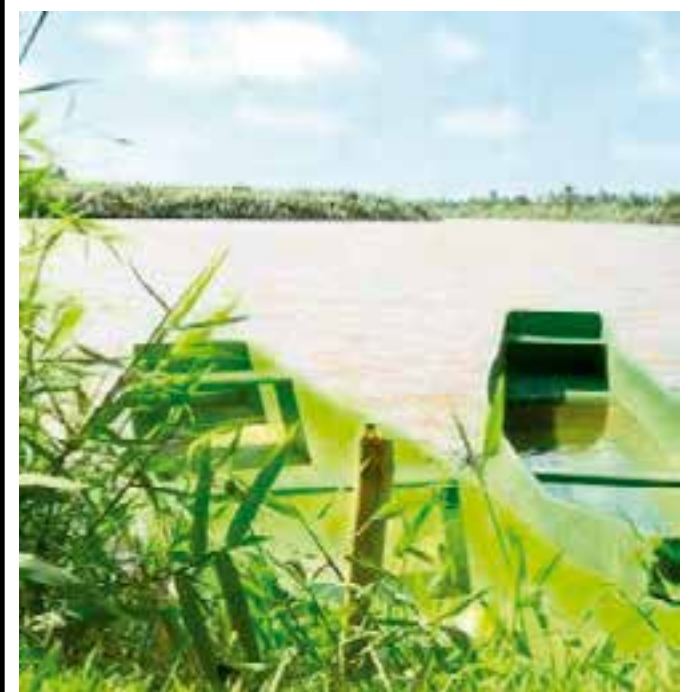
De acordo com a prefeitura, no último final de semana, testes realizados na água captada no rio, mostraram que a salinidade da água ultrapassou 4400ppm na maré cheia. O limite permitido pela OMS para consumo humano é de 250ppm.