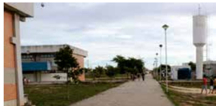
Já a Ufes conta com duas seleções programadas. Para professores temporários, são oferecidas dez vagas em diversas áreas.

Já para professores efetivos, a Ufes oferta cinco oportunidades para departamentos de ensino em Vitória. Neste caso, as remunerações che-