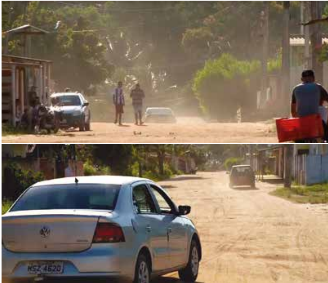
Abandonado pelo Poder Público, o bairro enfrenta todo o tipo de problema, a começar pela falta de infraestrutura.

E para piorar, não há área de lazer para as crianças brincar, o que fazem no meio da