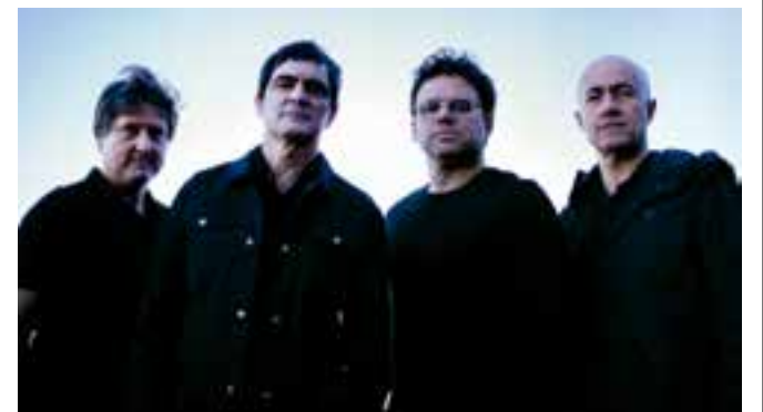
O repertório reúne os sucessos dos três primeiros álbuns e algumas das músicas mais representativas do Skank.

Skank “Os Três Primeiros”: Local: SAMA Rock Festival | Hotel Ibis Style - Rod. Governador Mário Covas Data: dia 01 de novembro | sexta-feira Horário: 23h50 Preço: R$92 (meia) e R$184 (inteira)