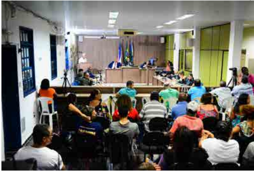
A preocupação com a onda de assaltos, arrombamentos, entre outros crimes no município, além de falhas na vigilância por videomonitoramento e o esquema de segurança para o Carnaval de Guriri nortearam os trabalhos na última sessão da Câmara.