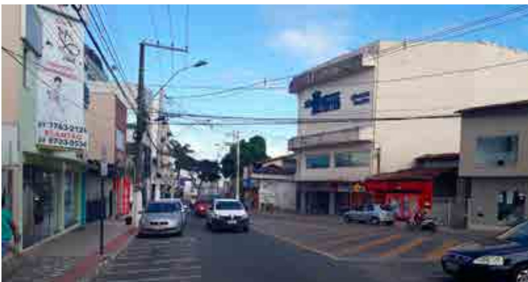
A preocupação com a onda de assaltos, arrombamentos, entre outros crimes no município, além de falhas na vigilância por videomonitoramento e o esquema de segurança para o Carnaval de Guriri nortearam os trabalhos na última sessão da Câmara.