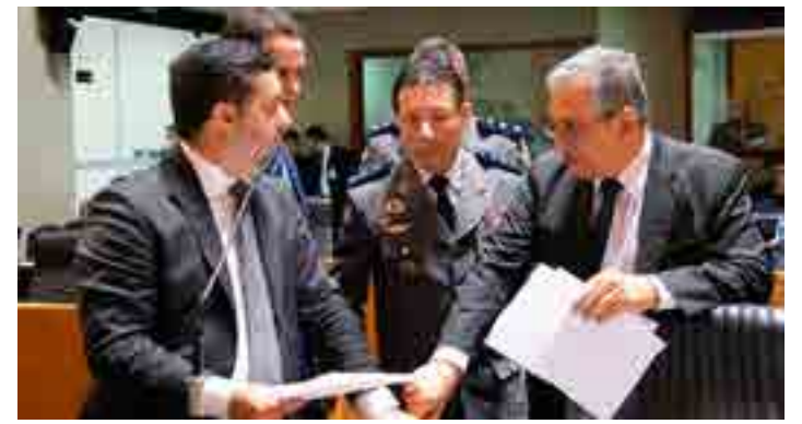
“Essa norma aprimora, ainda que de forma pontual, o sistema de segurança pública ao dotar seus órgãos de mais um mecanismo de valorização do trabalho policial”, finalizou.