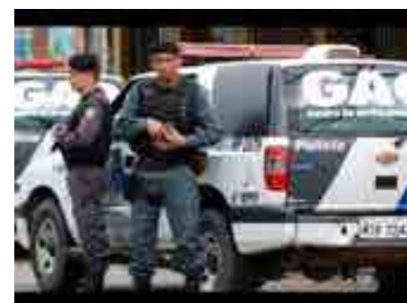
“muitos profissionais são afastados de suas funções, anualmente, por causa de problemas psicológicos, enquanto outros tantos são vítimas de homicídios, além do índice elevado de suicídios, especialmente no segmento militar.

Art. 3º Esta Lei Complementar entra em vigor na data de sua publicação. Sala das Sessões, em 20 de fevereiro de 2019.